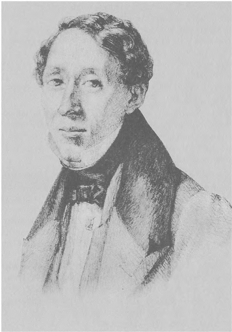
Х.К.Андерсен. Портрет работы Адама Мюллера. 1833