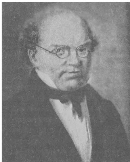
Латинская школа в Слагельсе, в которой учился Андерсен. Фотография