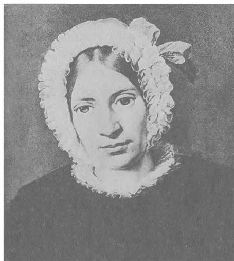
Балерина А.М.Шал'. Литография Г.Л.Ладе