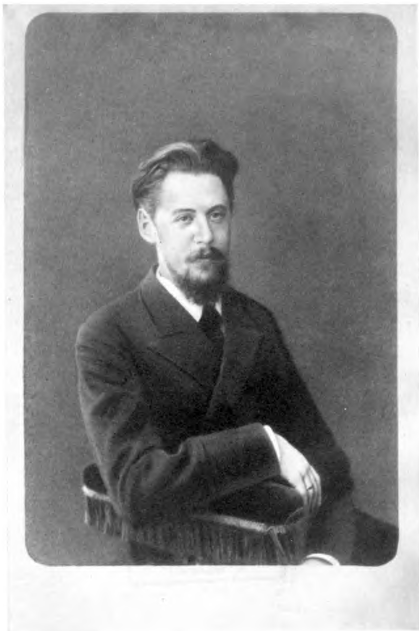
И. Ф. Анненский. 80-е годы XIX в.