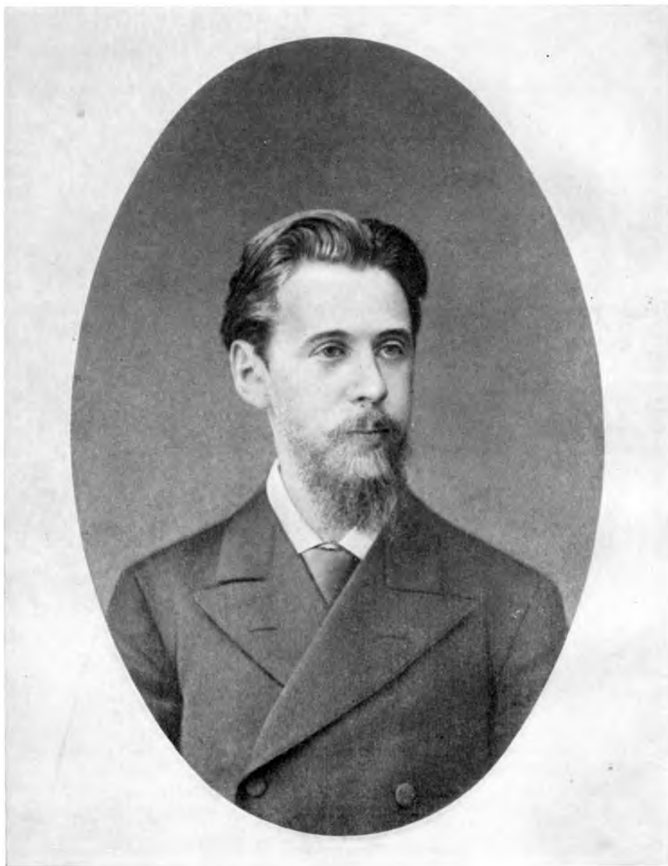
И. Ф. Анненский. Конец 70-х годов XIX в.