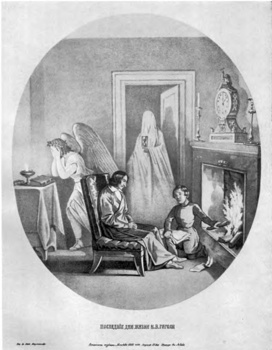
Последние дни жизни Н. В. Гоголя. Рисунок работы А. С. Соловьевского (ГПБ)