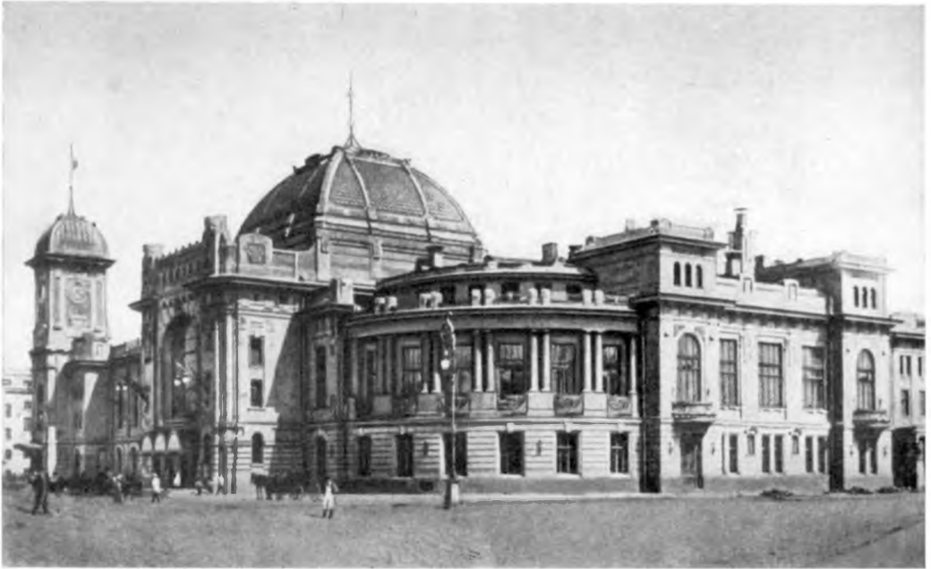
Царскосельский (ныне Витебский) вокзал в Петербурге