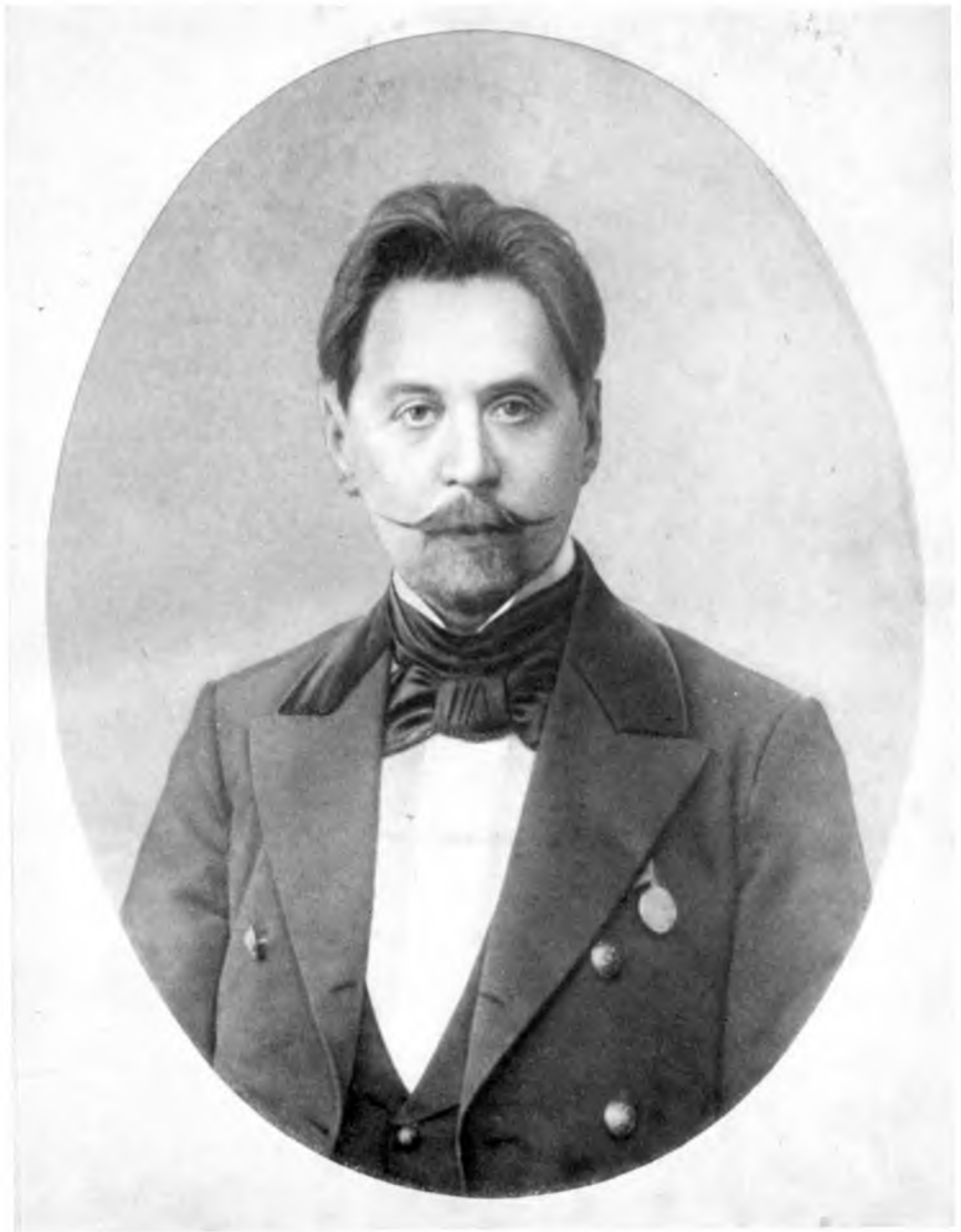
И. Ф. Анненский. 900-е годы