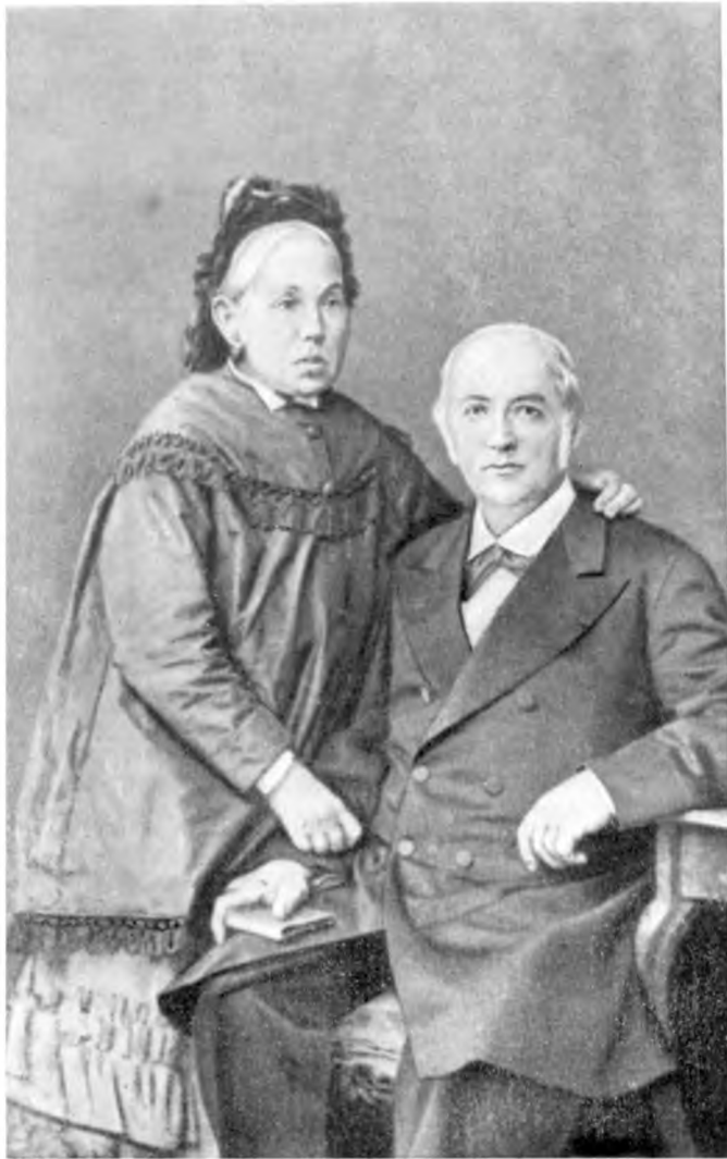
Ф. Н. и Н. П. Анненские