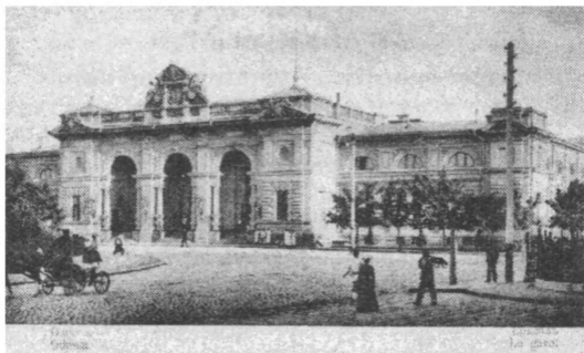
Здание Одесского вокзала, фотография начала XX века

“...Когда я брал на вокзале билет, кассир обсчитал меня на двугривен- ный”.