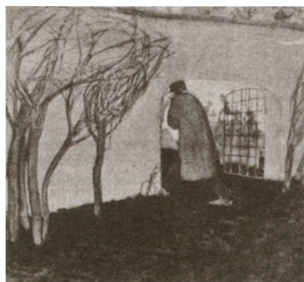
«Поэт Хлебников» <у входа на Волково кладбище>. Акварель худ. Б.Д. Григорьева (ж. «Нива», 1911, № 32).

Эту службу в «должности поэта» Х., не прекращая прежнего сотрудничества, в кон. окт. сменил на место вольнонаемного лектора школьно-библиотечной части Волжско-Каспийской флотилии. В то время Х., никогда не стремившийся обеспечить свой быт, а в последние годы подвергшийся моральным и физич. испытаниям, «ходил полубосой, полуодетый, невымытый, нечесанный и вечно голодный. Его диогенство было почти принципиальным» (А. Бородин — газ. «Бакин. рабочий», 1922, 16 июля). Печатался нечасто: стих. « В берлоге у барона » (газ. «Коммунист», 1920, 29 окт.), « Очана-мочана... » и « Дуб Персии » (ж. «Иск-во», Баку, 1921, № 2–3), ст. « В мире цифр » (ж. «Военмор», 1920, № 49). Выступал с чтением стихов в бакин. «Цехе поэтов».