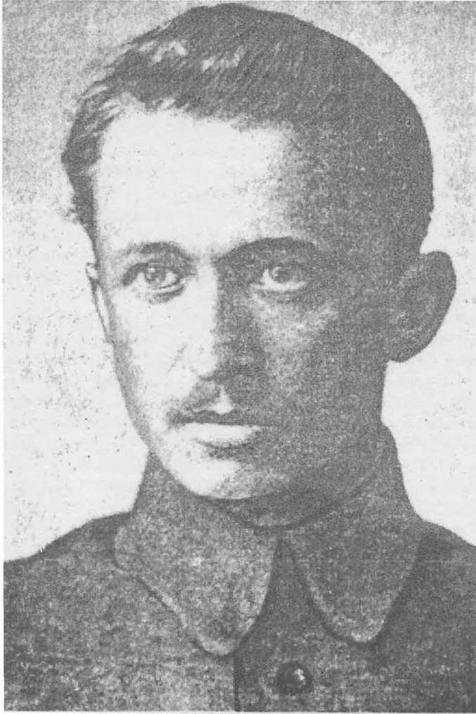
Министр финансов Российского правительства адмирала А.В. Колчака И.А. Михайлов.