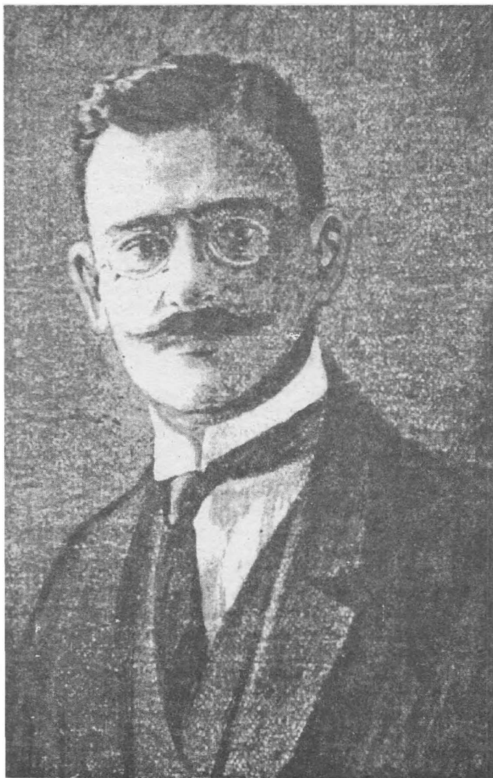
Министр без портфеля Российского правительства адмирала А.В. Колчака и председатель Государственного экономического совещания Г.К. Гинс.