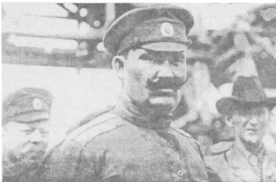
Атаман Г.М. Семенов, 1918 год.