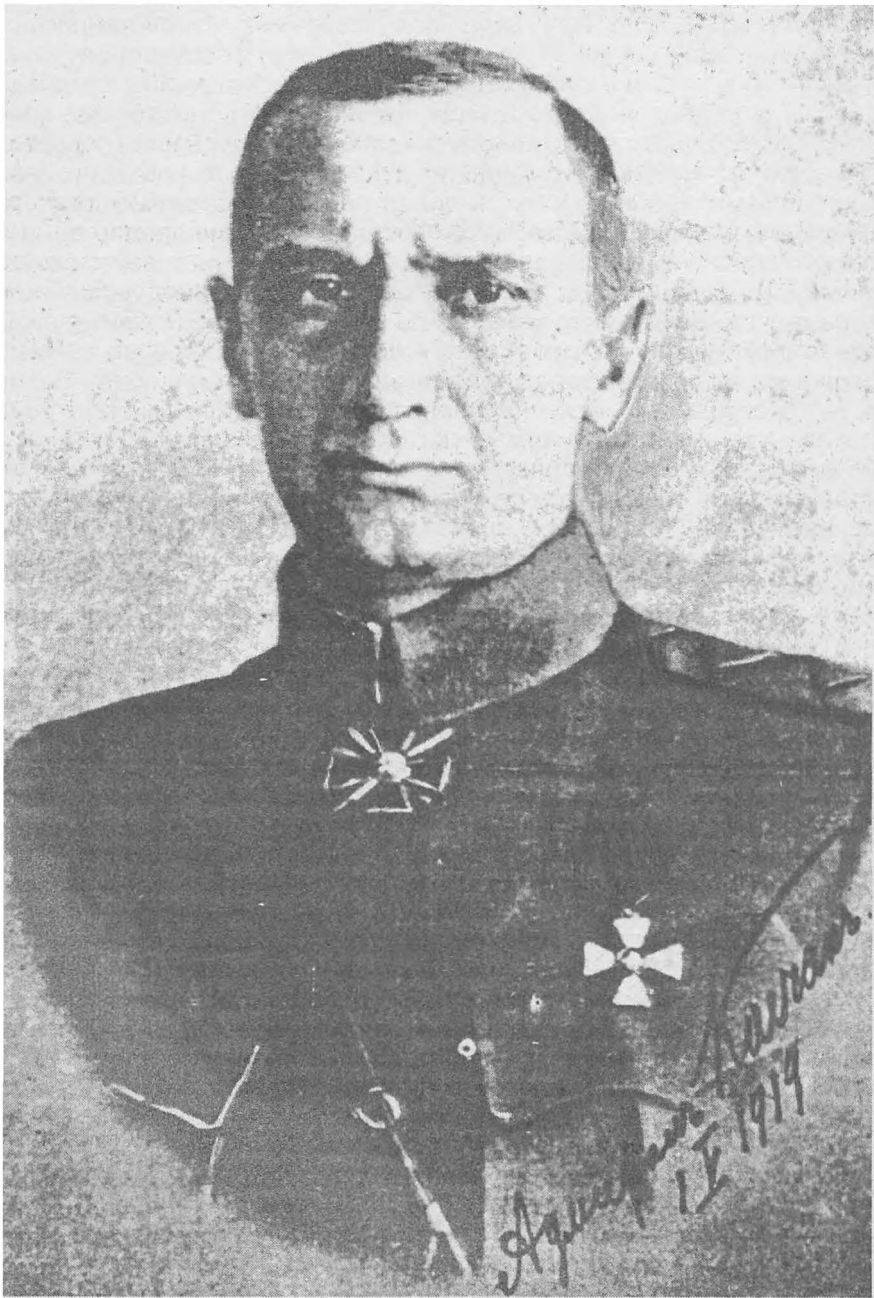
Верховный правитель России адмирал А.В. Колчак. 1 мая 1919 года.