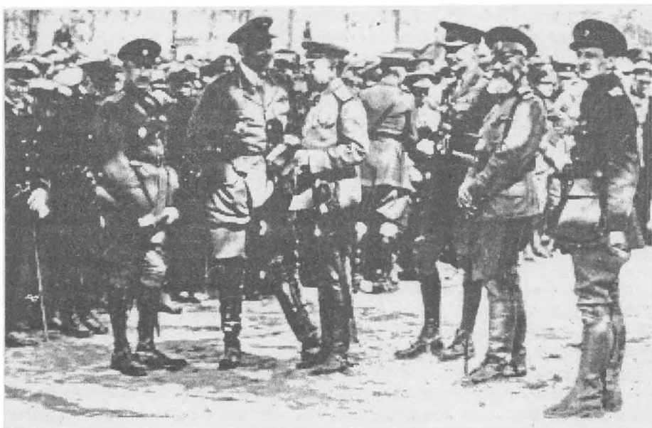
Командование интервентов и белогвардейцев на Русском Севере в ожидании прибытия бригады британских добровольцев. На переднем плане: второй слева генерал У.Э. Айронсайд, третий слева генерал Е.К. Миллер. Архангельск, 27 мая 1919 года.