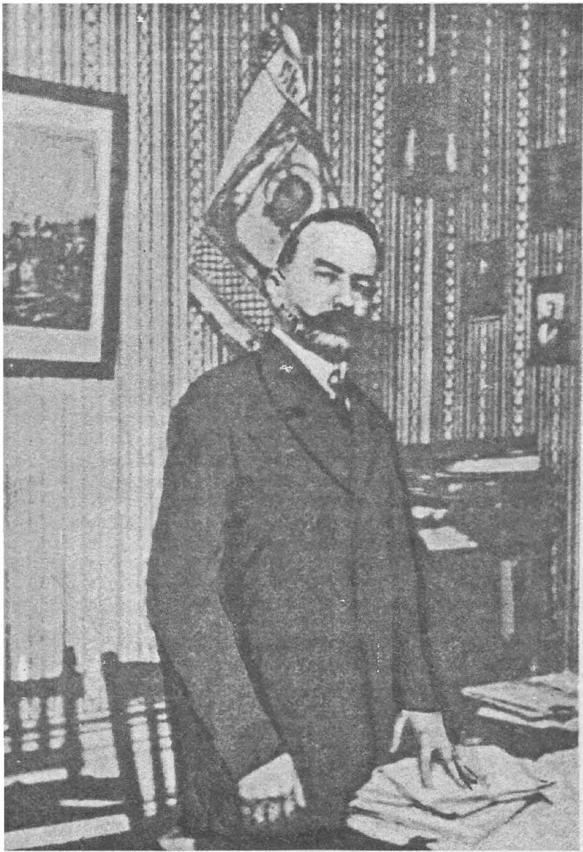
Генерал Е.К. Миллер в штаб-квартире РОВС в 1930-е годы.