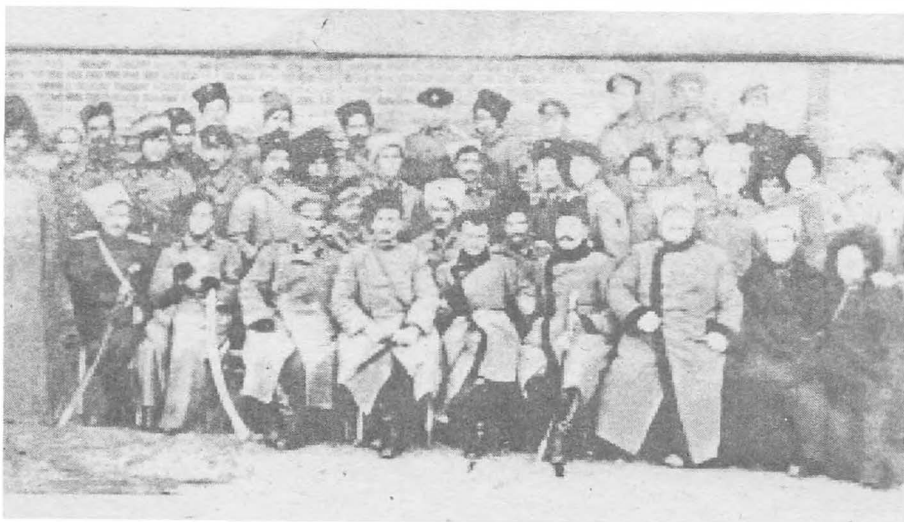
Атаманы И.М. Калмыков и Г.М. Семенов с офицерами штаба Калмыкова в 1920 году.