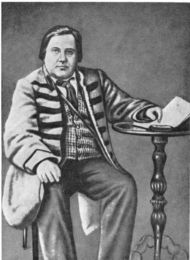
В. И. Дунин-Марцинкевич