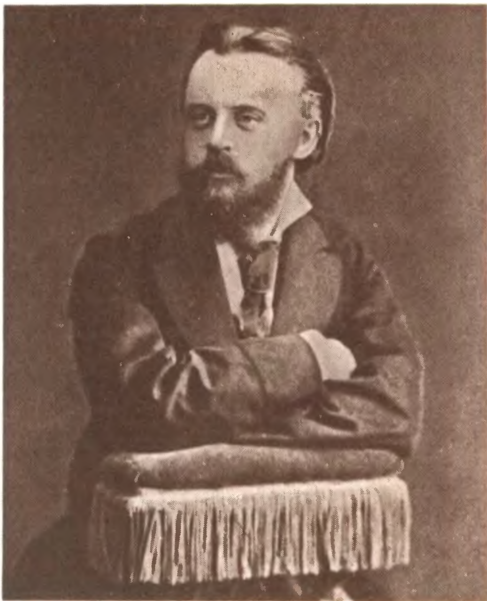
А. Н. Веселовский.