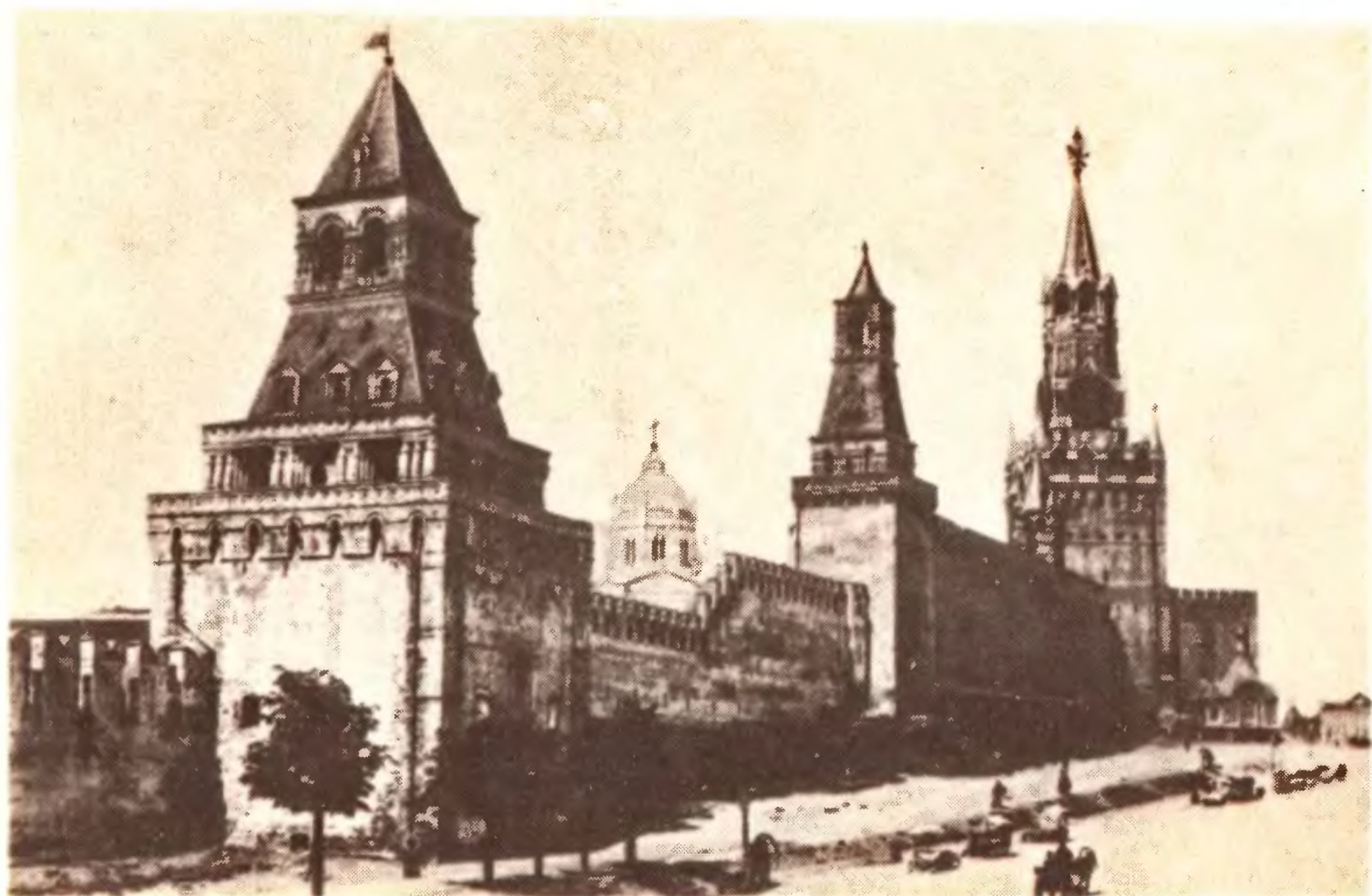
Кремль. Спасская башня.