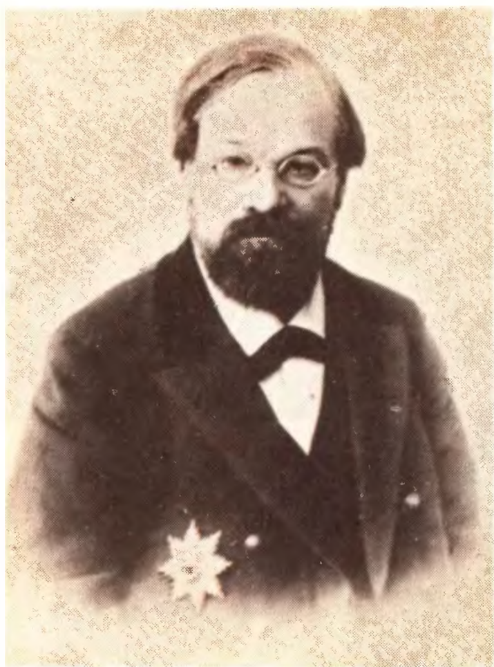
Н. В. Бугаев. 1870-е гг.