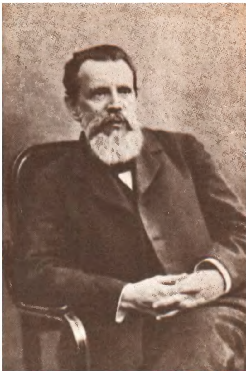
М. М. Ковалевский. 1889.