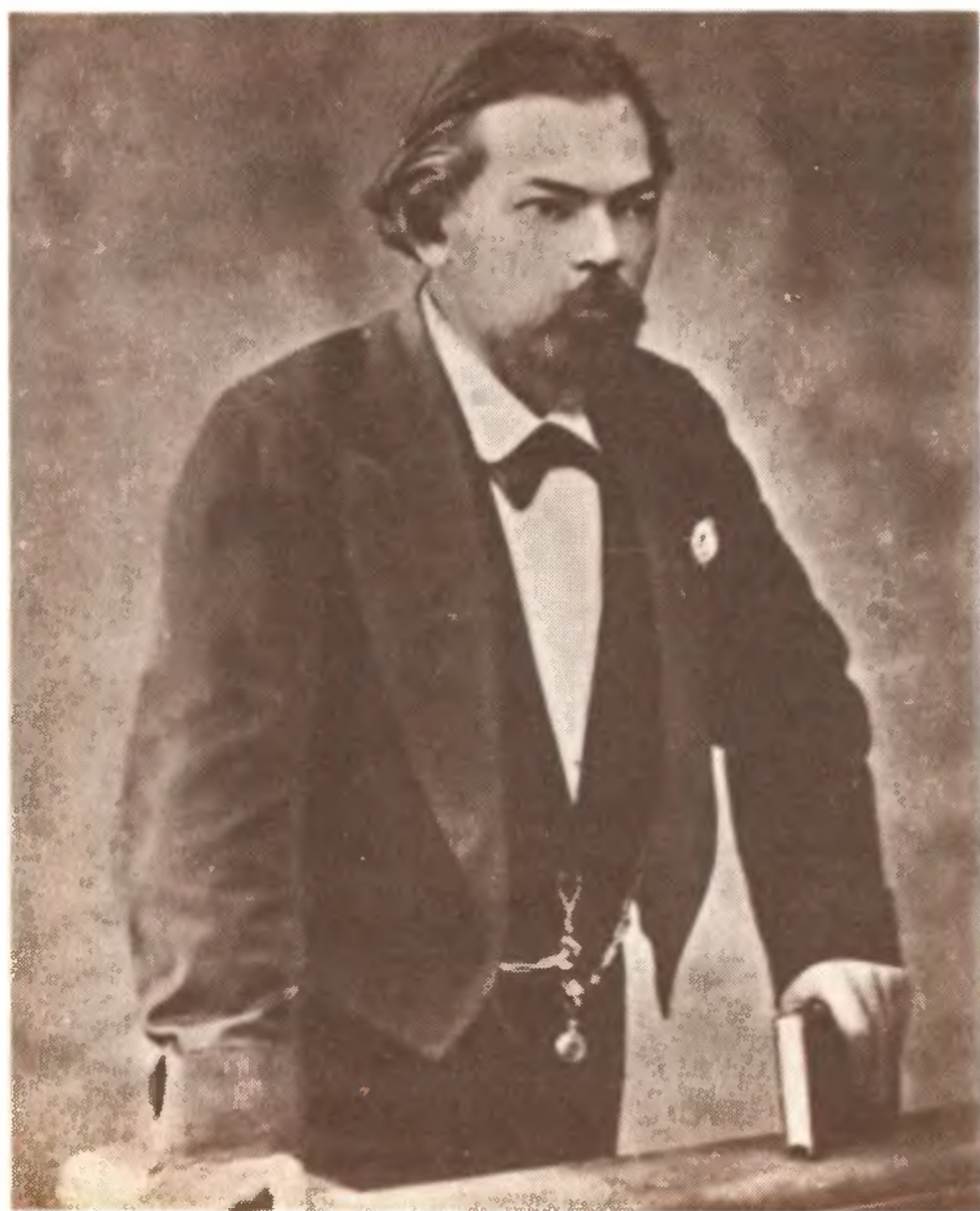
Ф. Н. Плевако.