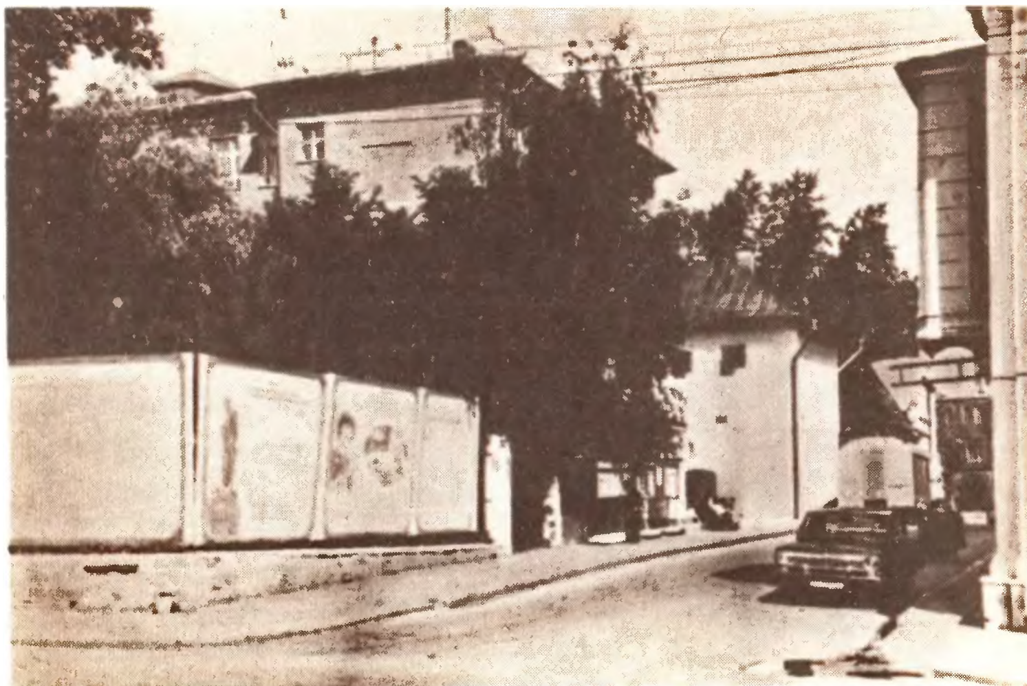
Чертольский пер. в Москве (б. Царицынский).