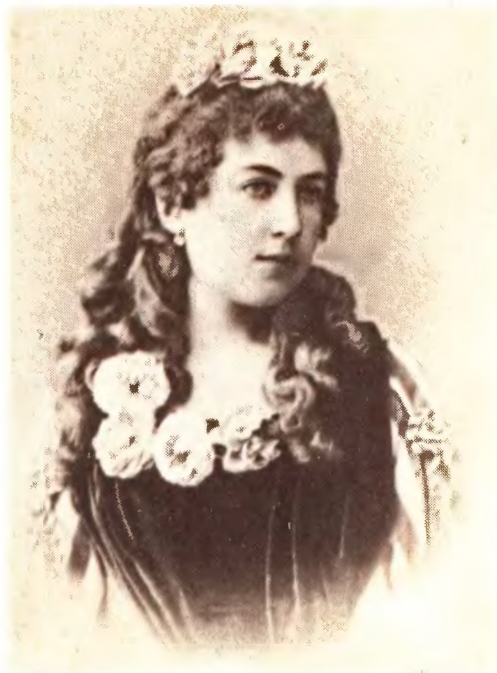
А. Д. Бугаева. Около 1880 г.