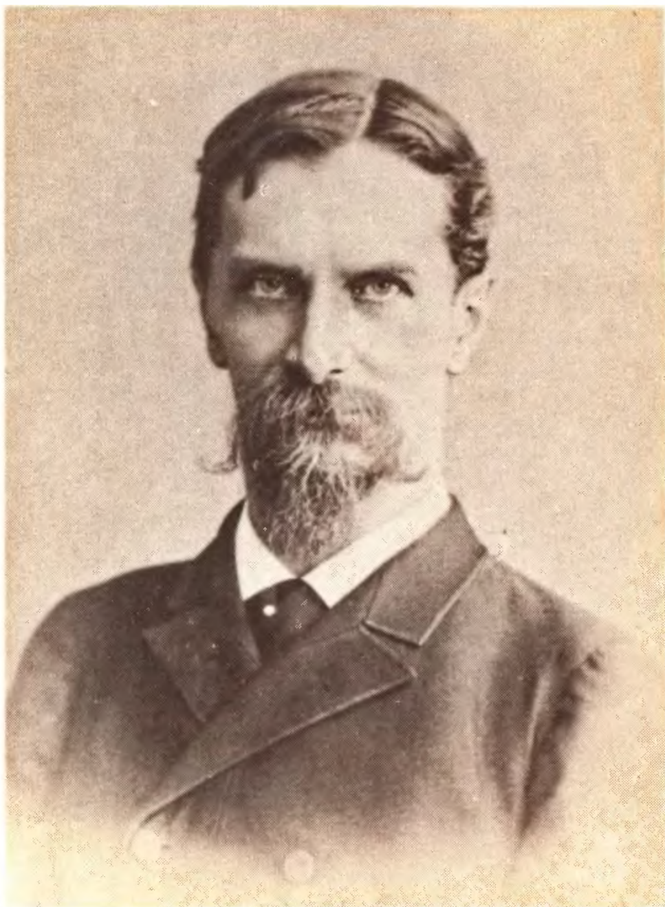
К. А. Тимирязев.