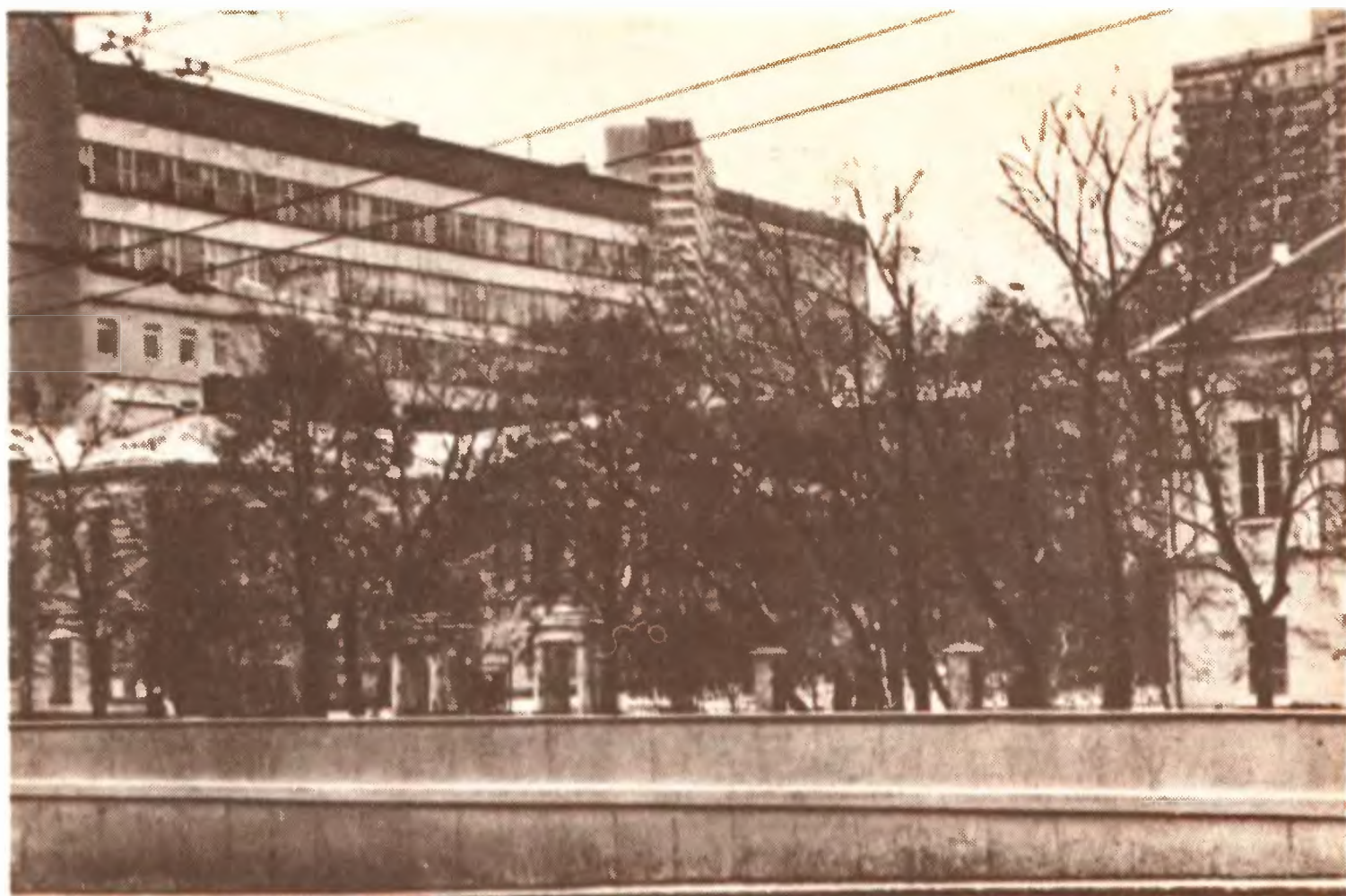
Суворовский бульвар, 7.