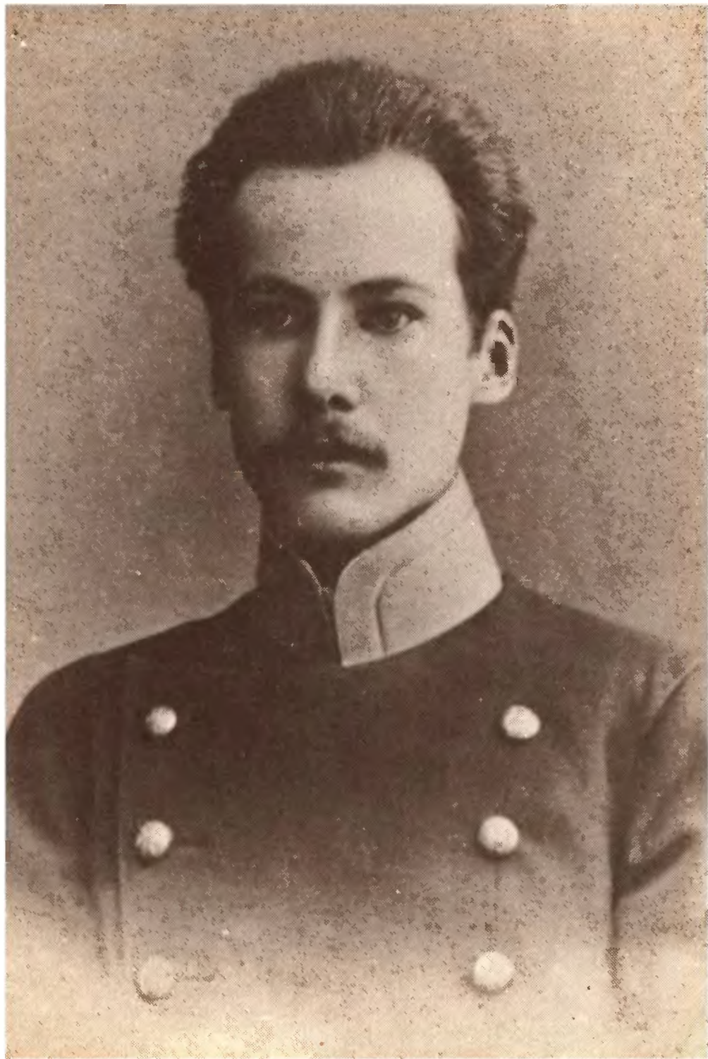
А. Белый. 1903.