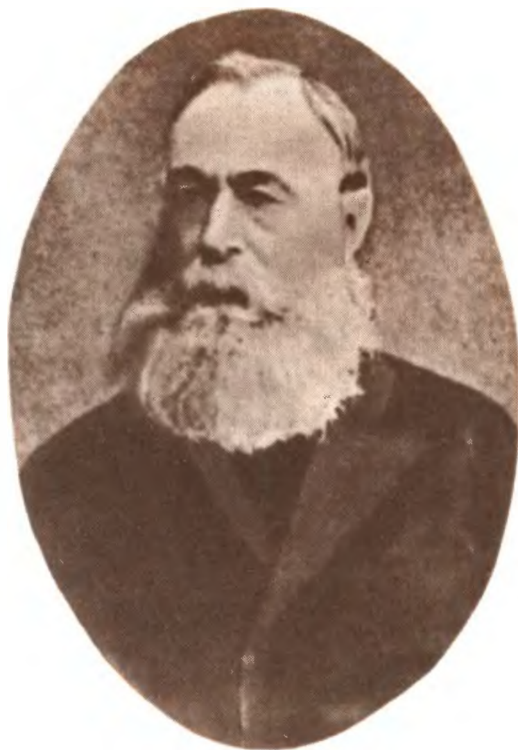
Б. Н. Чичерин.