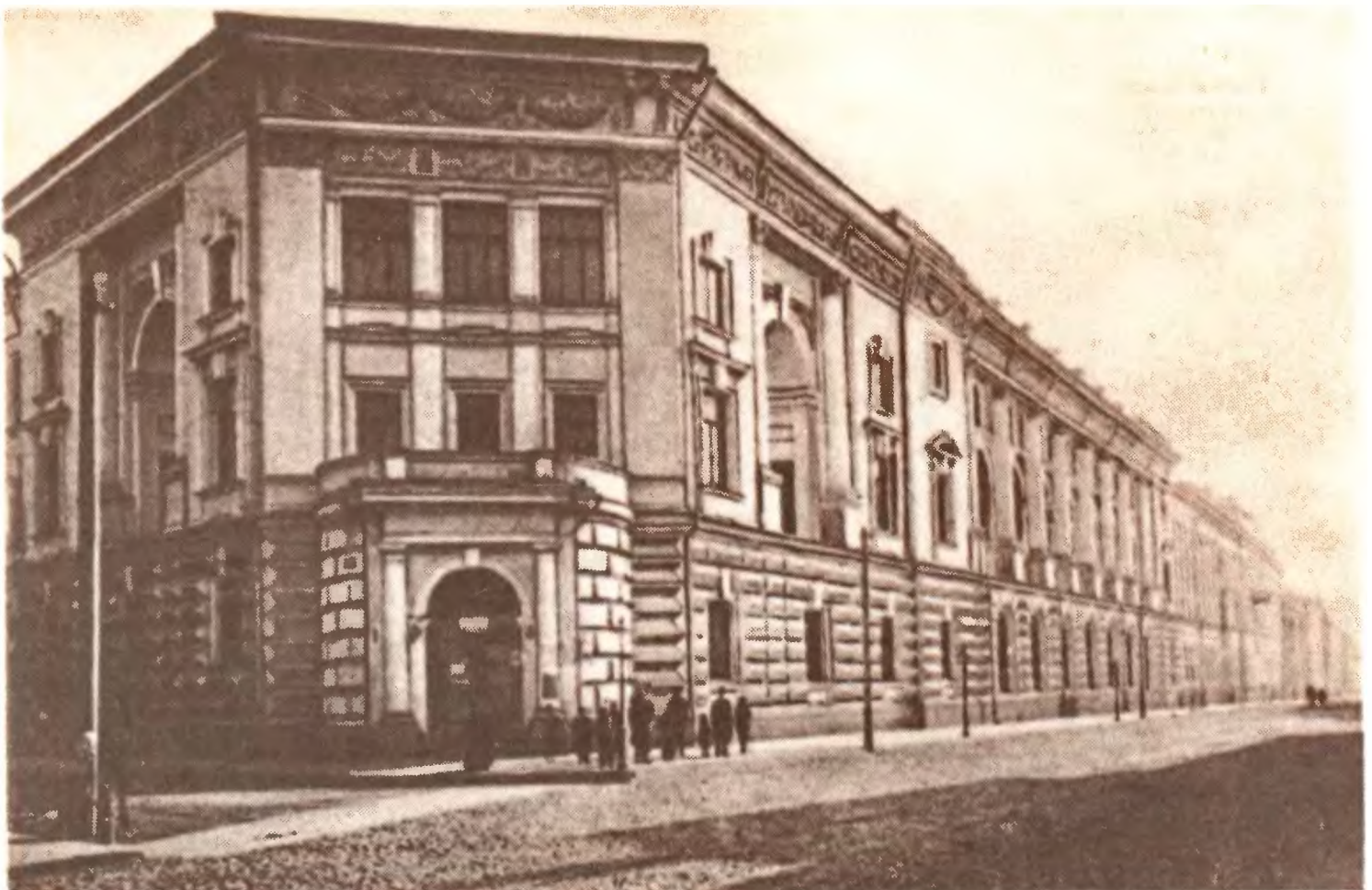
Зоологический Музей. Москва. 1890—1900-е гг.