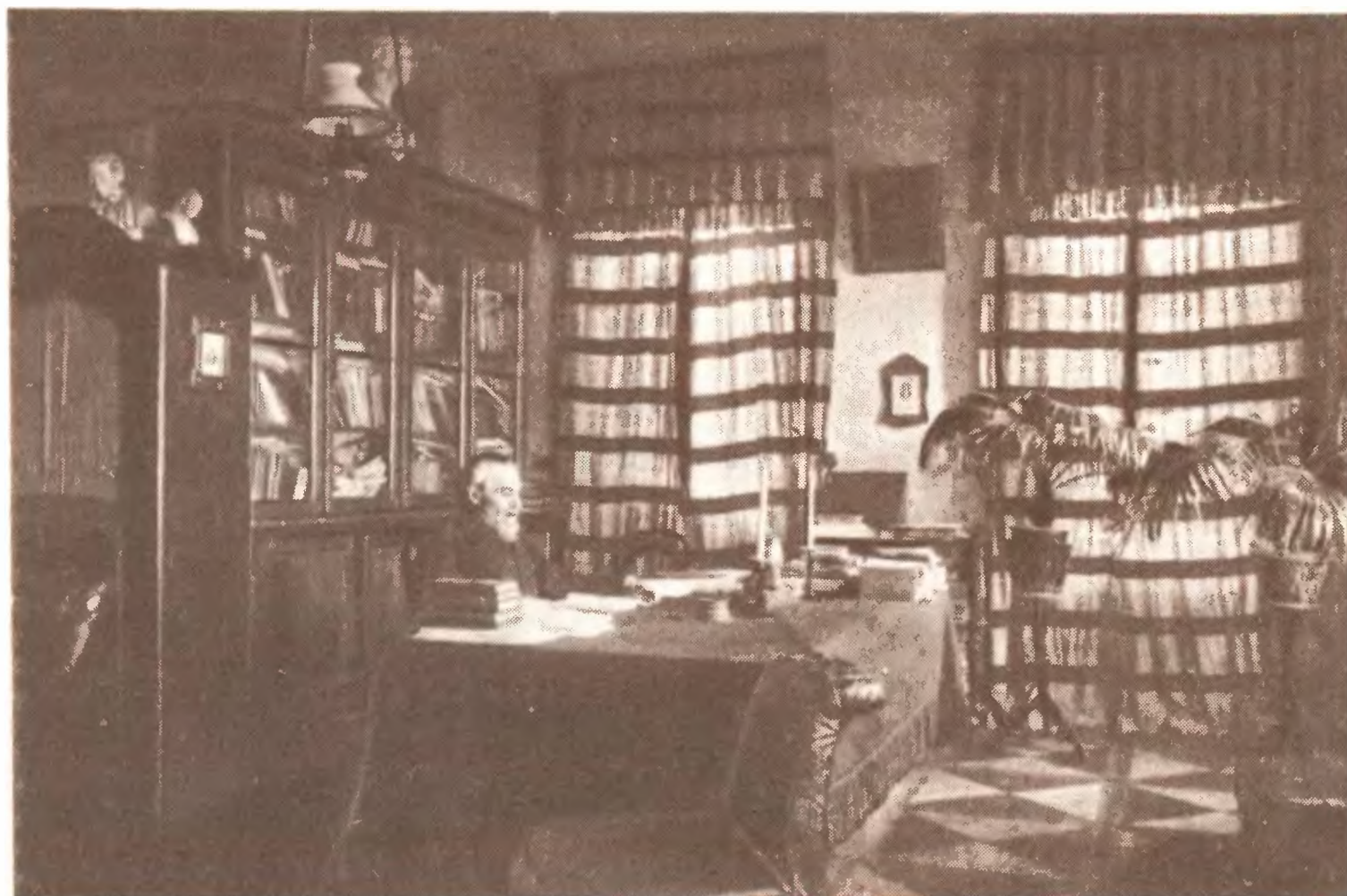
Л. И. Поливанов. 1890-е гг.