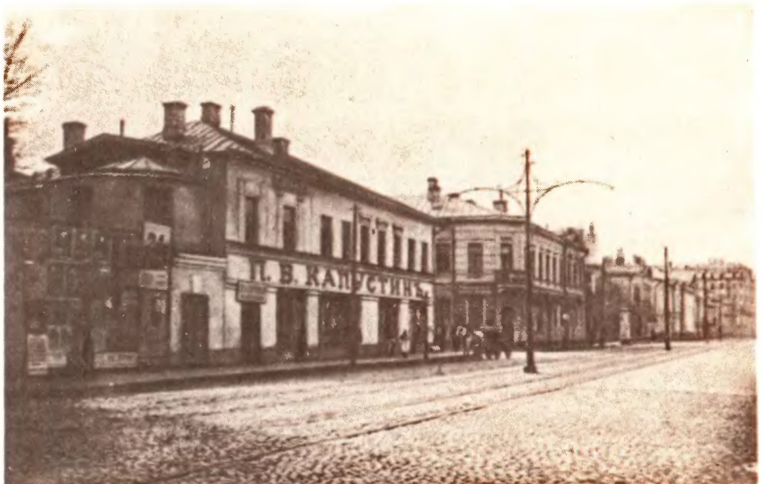
Пречистенка. 7 марта 1913 г.