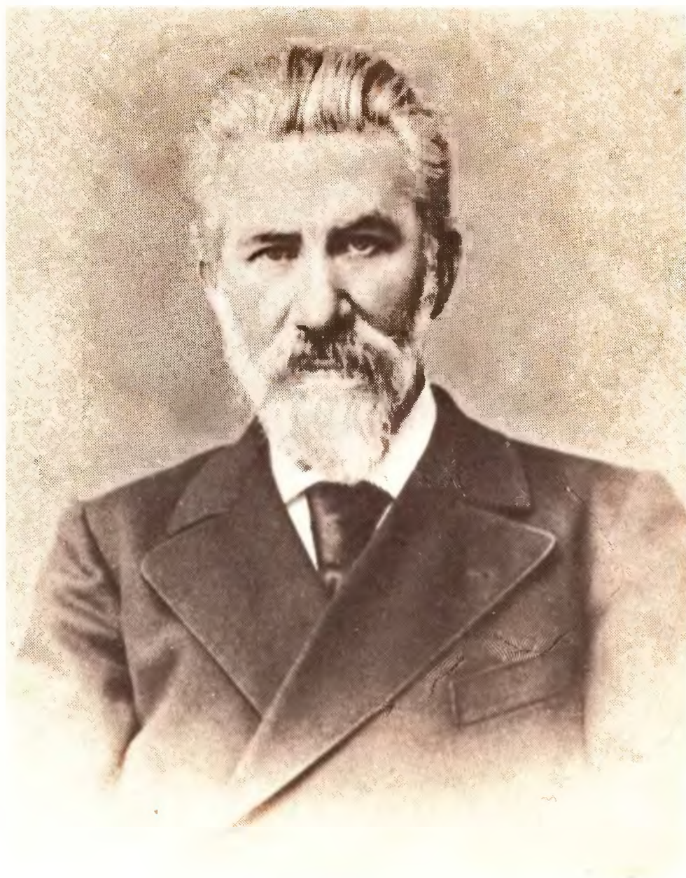
Д. Н. Анучин.