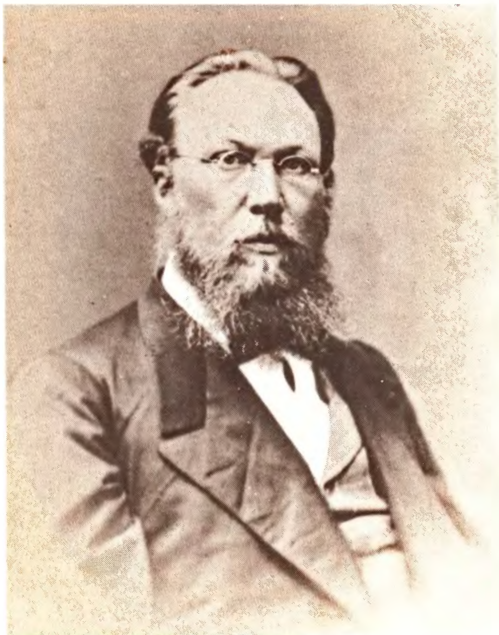
Надпись А. Белого на фотографии: «Доктор Белоголо- вый, друг дедушки со стороны матери».