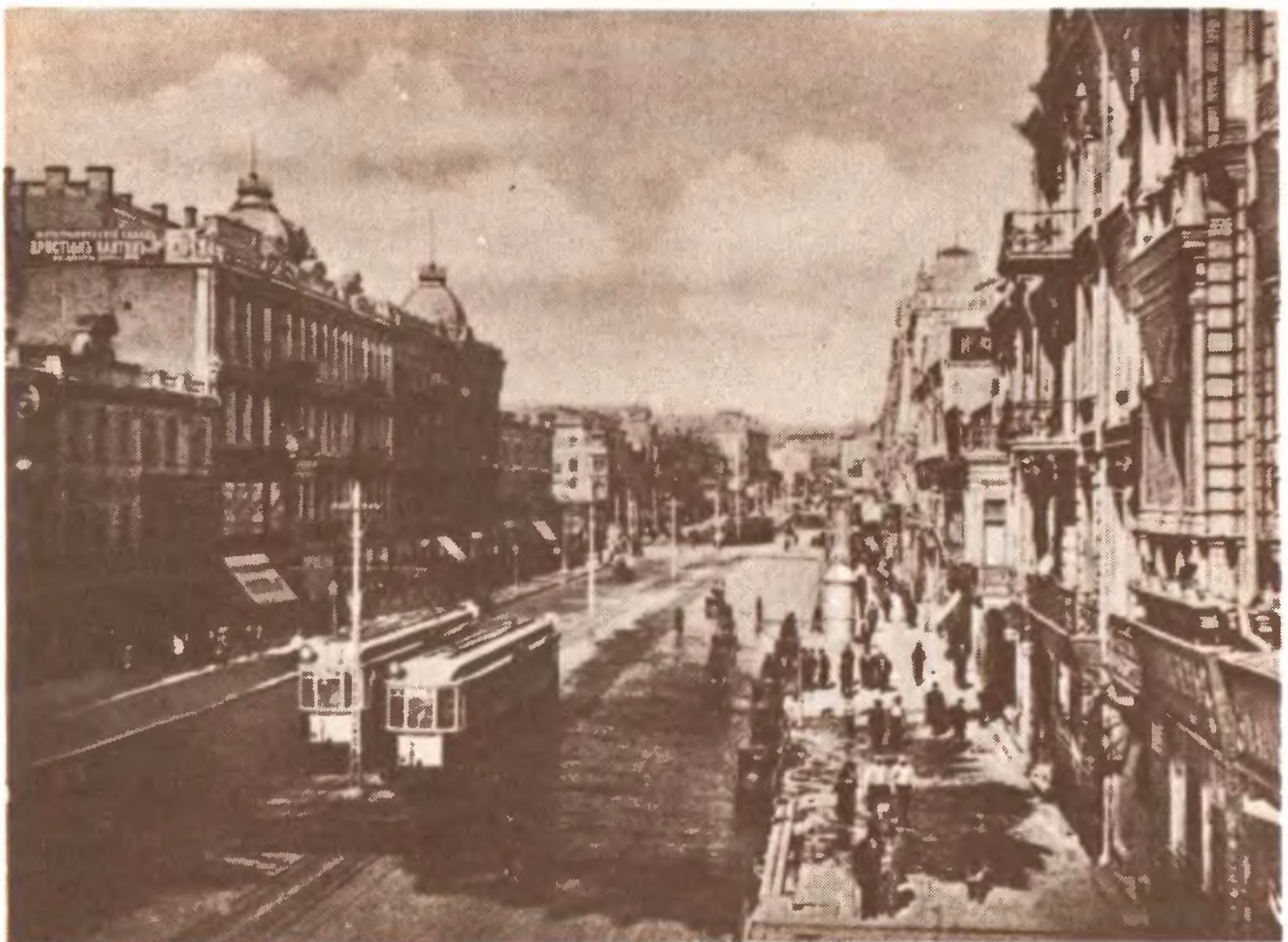
Киев. Крещатик. 1910-е гг.