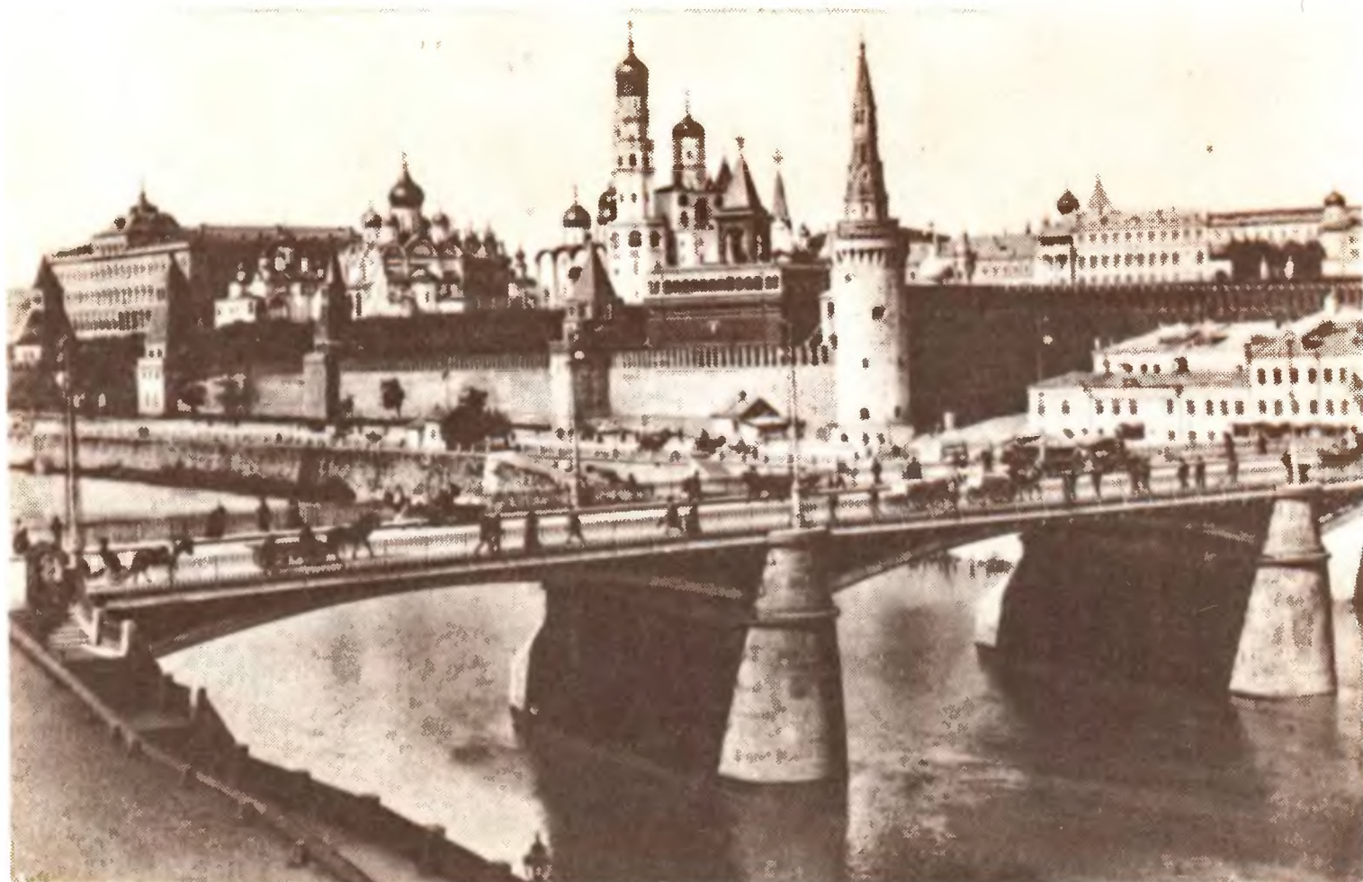
Вид Московского Кремля. 1890-е гг.