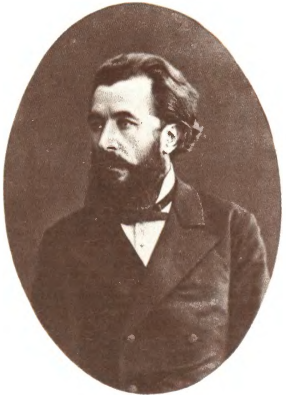
Н. В. Склифосовский.