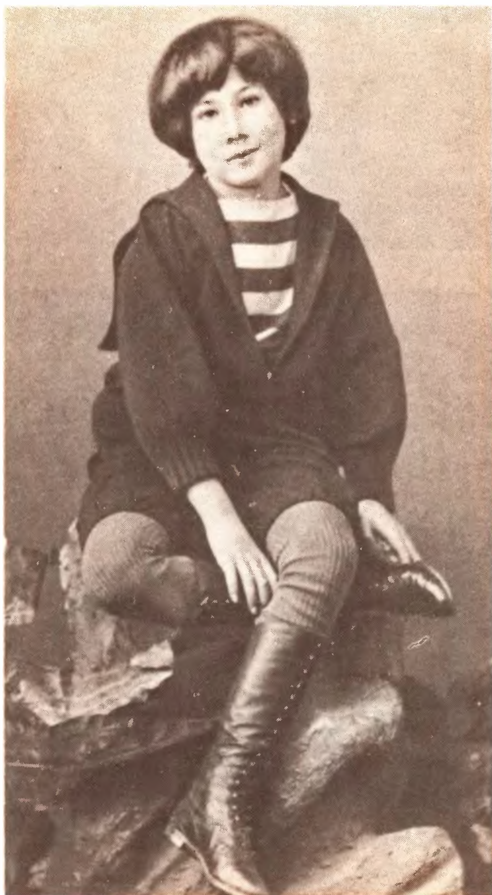
А. Белый. 1887—1888.