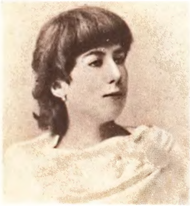
А. Д. Бугаева. 1880.