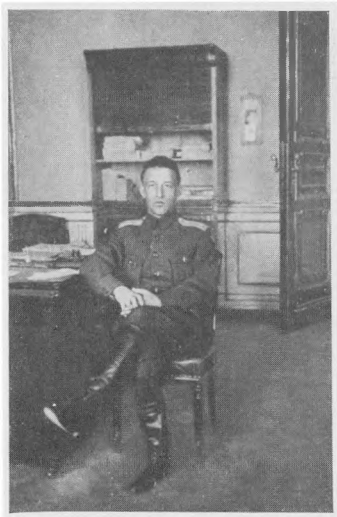
1917 (Зимний дворец)