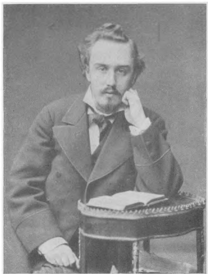
А. Л. Блок (отец поэта)