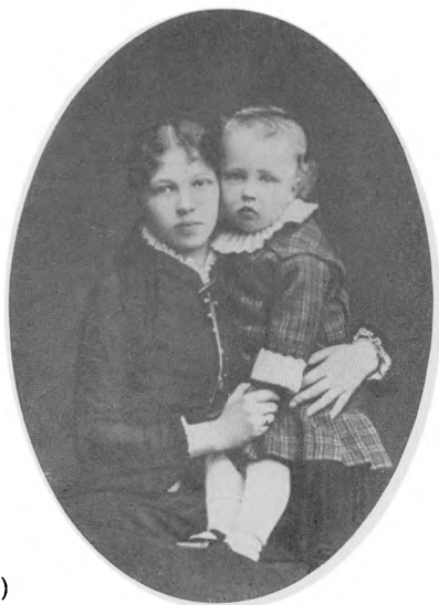
С матерью (1883)