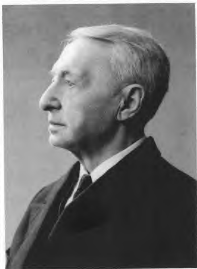
И. А. Бунин. 1938