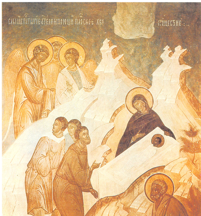
Свете Тихий, от Девы миру возсиявый...