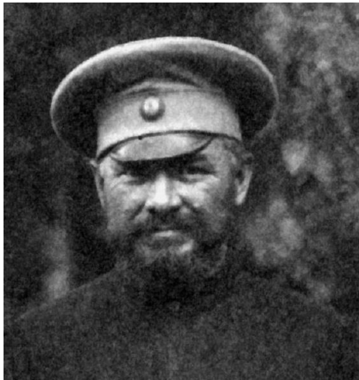
Федор Крюков. Фото 1918 г.