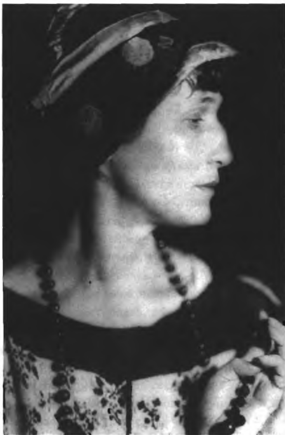
Анна Ахматова. 1922 г.

В газете «Жизнь искусства» № 1 (824) напечатаны рецензии М. С. Шагинян на сб. «Анно Домини МСМХХI» и поэму «У самого моря»: «Победит манера, — и творчество Ахматовой застынет; победит стиль — и Ахматова войдет в русло русской классической лирики уже полноправно. <...> Ахматова (с годами — все больше) умеет быть потрясающе народной, без всяких quasi, без фальши, с суровой простотой и с бесценной скупостью речи». — Шагинян М. С. Собр. соч. М., 1971. Т. 1. С. 757–760.