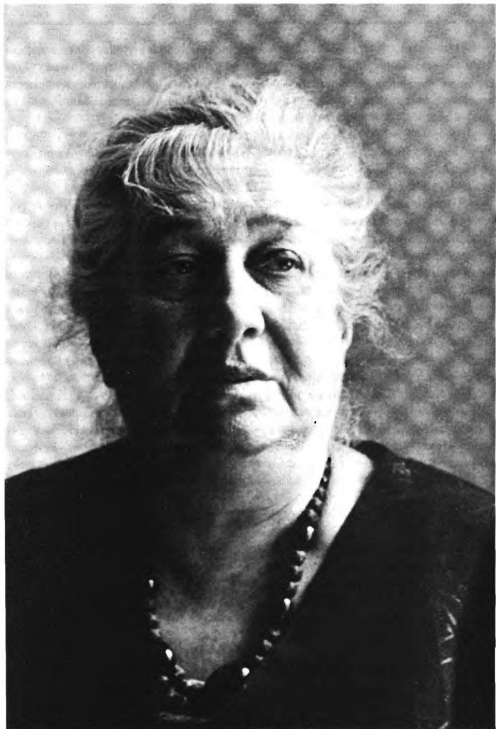
Анна Ахматова. 1965 г.