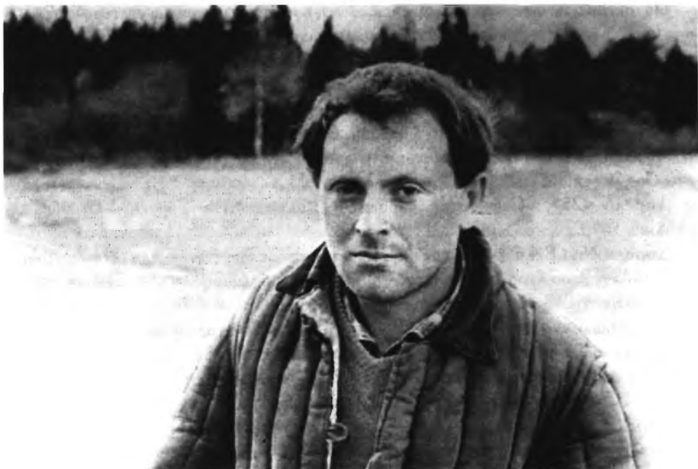
Иосиф Бродский в ссылке. 1964 г.

Апреля 14. «В 11 ч. утра переезжаю на Ордынку. Корнилов. Аманда». — ЗК. С. 456–457.