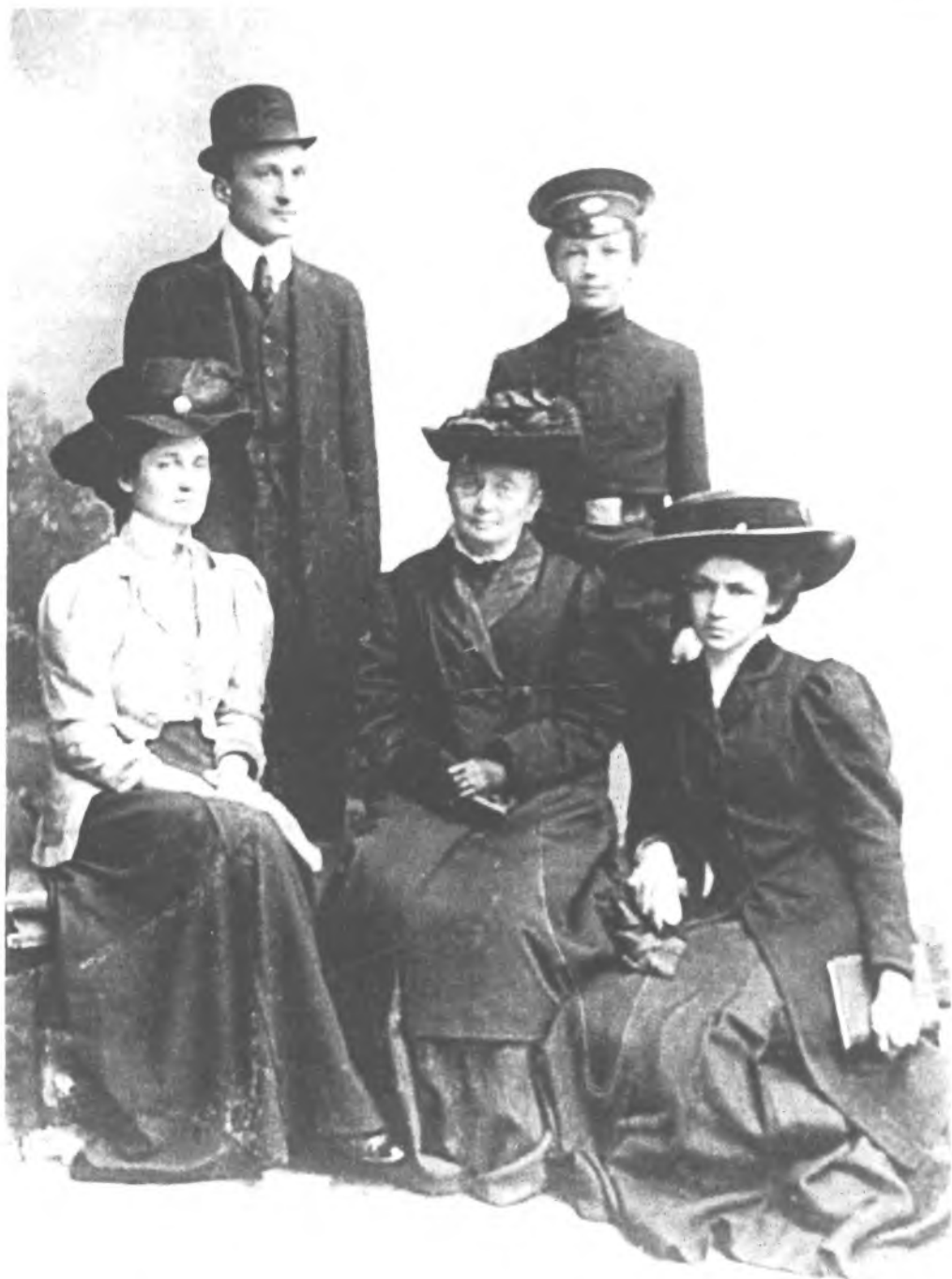
Семья Горенко: Ивна Эразмовна, Анна, Андрей, Виктор, Ия. 1909 г.