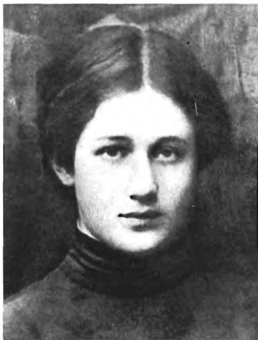
Анна Горенко. 1904 г.

<Весна>. «Встречи с Анной Андреевной Горенко. За всё время было приблизительно 10 встреч. У нее еще не бывал; она у Гумилевых не бывала также». — Там же . С. 159.