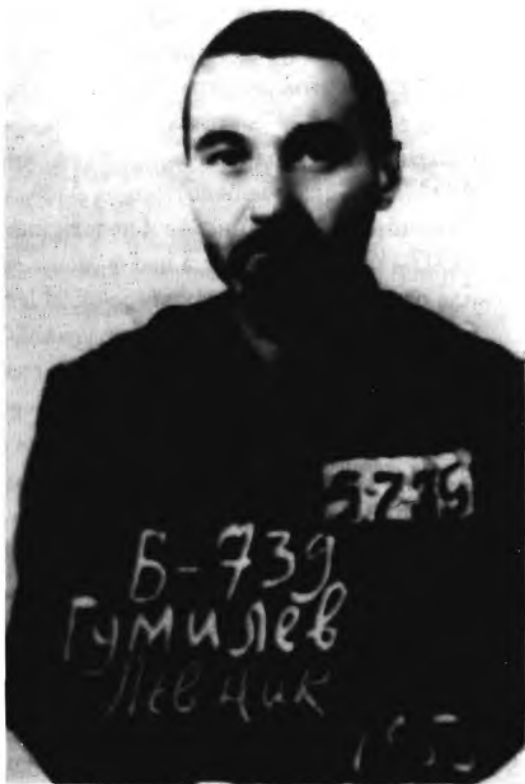
Л. Н. Гумилев. Лагерная фотография. 1953 г.

Августа 15. Договор А. А. с Ленинградским отделением Гослитиздата на перевод стихов В. Гюго для его собрания сочинений (400 строк по 7 руб. за строку). — РНБ. Ф. 1073. № 53. Л. 12.