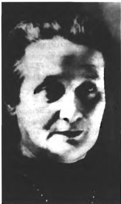
Анна Ахматова. 1946 г.

— на сб. «Из шести книг» (Л., 1940): «И. Берлину — в знак уважения и сердечной приязни. 4 янв. 1945 <!>. Анна Ахматова». На с. 6 рукой А. А. вписано стих. «Истлевают звуки в эфире...» («Синque». 2) с датой: «1945, дек. Фонтанный Дом». — Там же. Инв. № 3213.