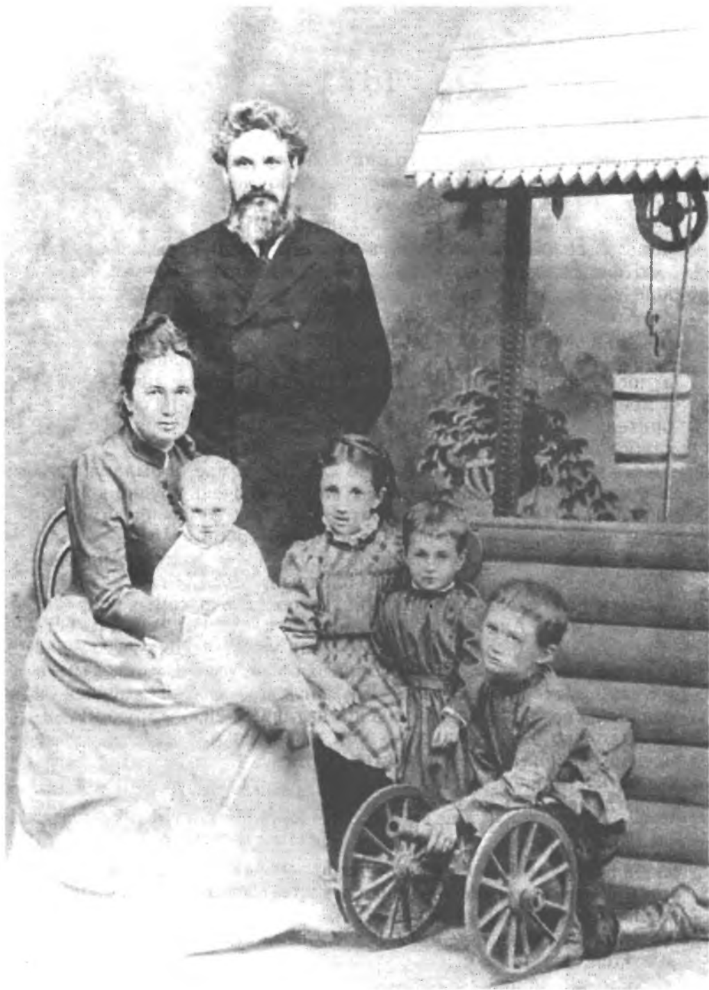
Семья Горенко: Андрей Антонович, Инна Эразмовна, Ирина (Рика), Инна, Анна, Андрей. 1893 г.