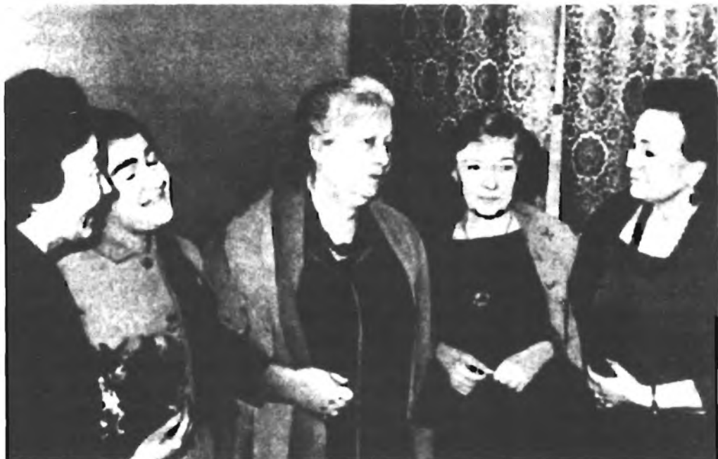
Анна Ахматова и Ольга Берггольц среди делегатов Второго Всероссийского съезда писателей. 1965 г.

Она — усталая, прибранная, с новыми зубами. Рассказывает об Италии, тоже устало и по виду разочарованно». — ЛО. 1992. № 5–6. С. 50.