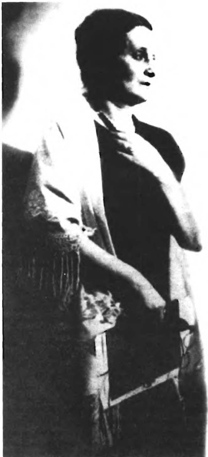
Анна Ахматова на Блоковском вечере в Ленинграде