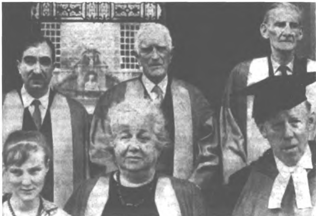
Анна Ахматова. Оксфорд. 5 июня 1965 г.