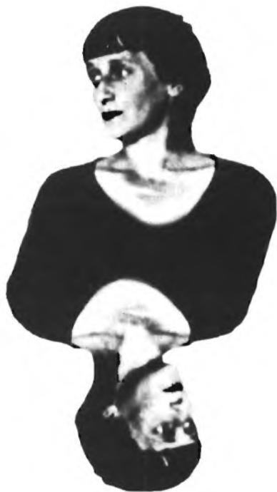
«Пиковая дама». Шуточная фотография