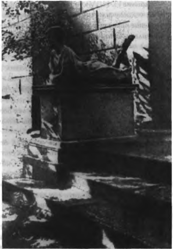
Анна Ахматова в позе сфинкса во дворе Фонтанного Дома. 1926 г.