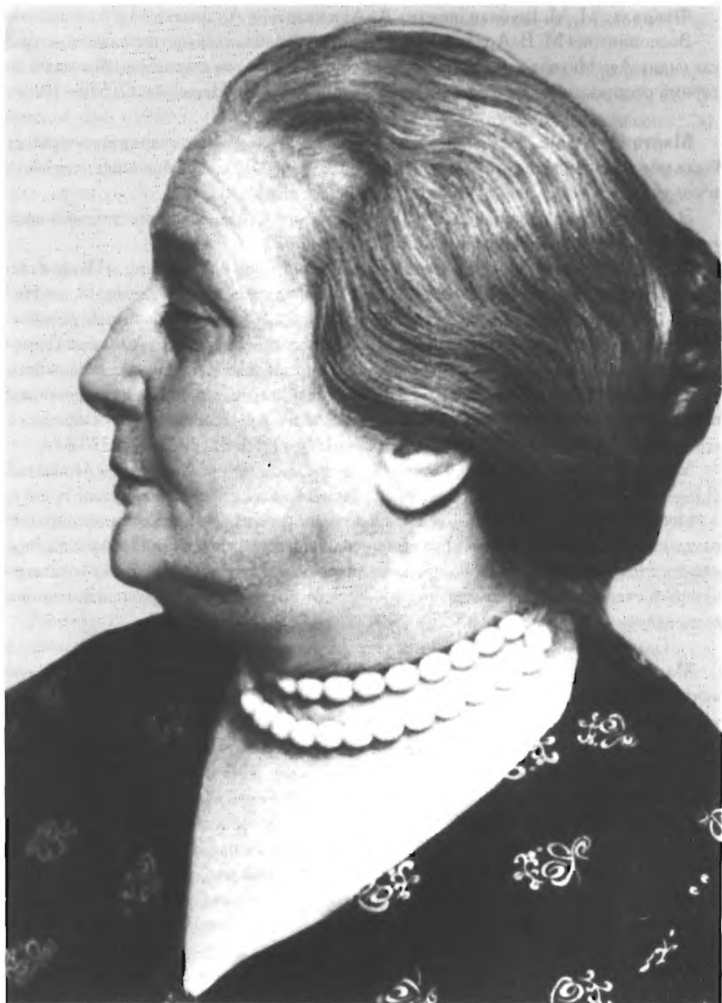
Анна Ахматова. 1950-е гг.