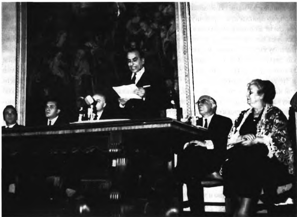
Вручение Анне Ахматовой литературной премии «Этна-Таормина». 12 декабря 1964 г.