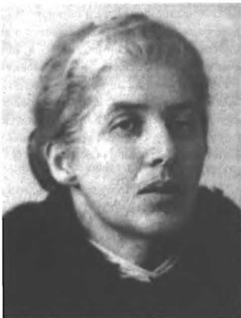
Л. К. Чуковская

Ноября 25. Наркомом внутренних дел СССР вместо Н. И. Ежова назначен Л. П. Берия.