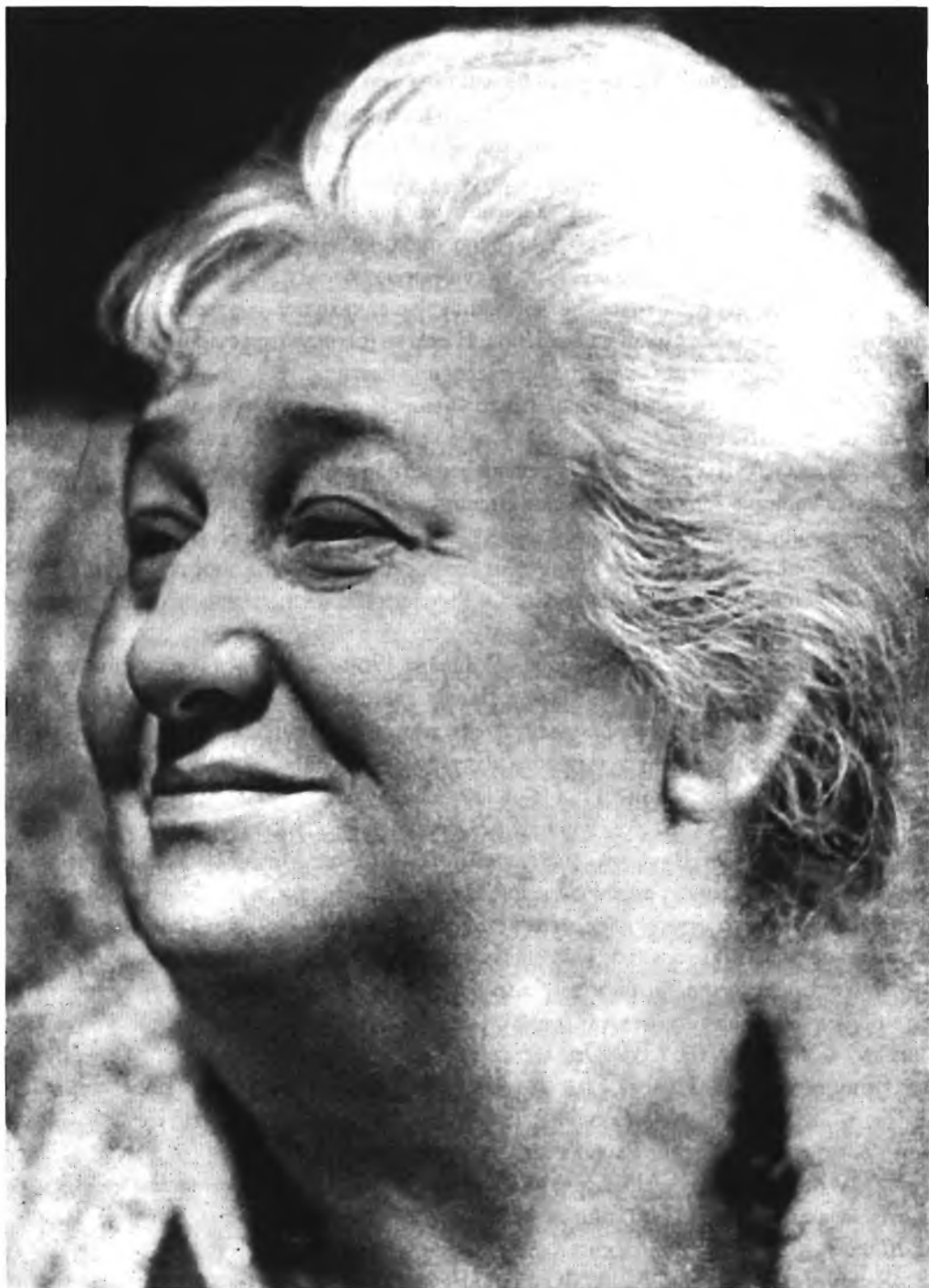
Анна Ахматова. 1964 г.