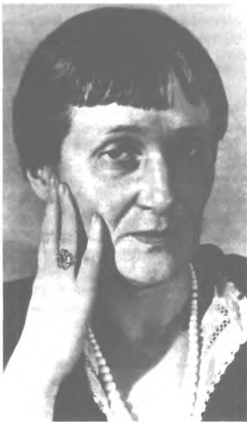
Анна Ахматова. 1941 г.