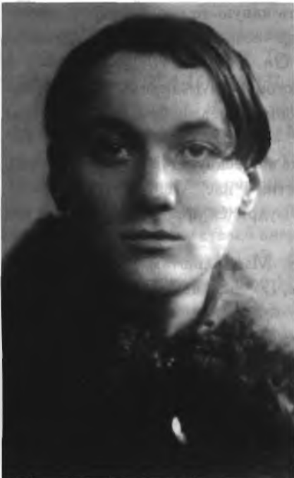
Лев Гумилев. 1934 г.