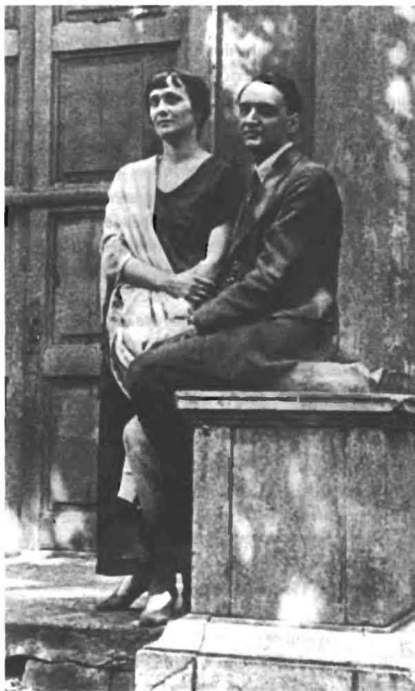
Анна Ахматова и Н. Н. Пунин. 1927 г.