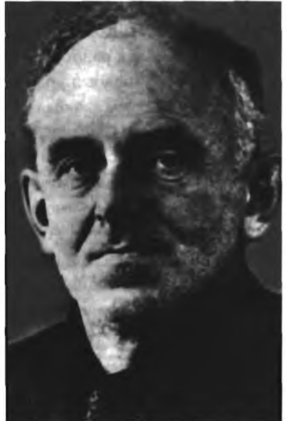
О. Э. Мандельштам