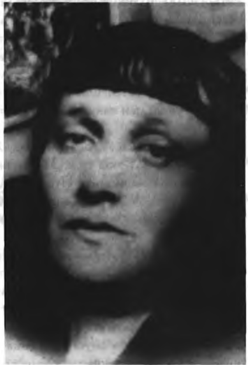
Анна Ахматова. 1930-е гг.

1931.21.V». — РГАЛИ. Ф. 2633. Оп. 1. Ед. хр. 29.