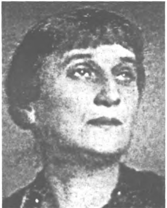
Анна Ахматова. 1942 г. Ташкент