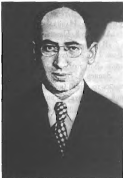
А. С. Лурье

После ухода от Шилейко А. А. живет вместе с А. С. Лурье и О. А. Глебовой-Судейкиной по адресу: Фонтанка, 18, кв. 28 (четвертый двор, верхний этаж). — ЗК. С. 662.