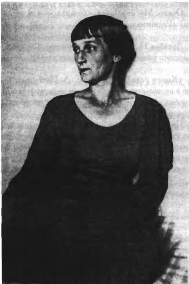
Анна Ахматова. 1936 г.