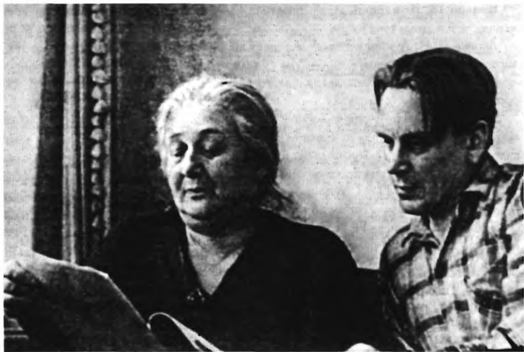
Анна Ахматова и П. Н. Лукницкий. 1962 г.

Января 10. Приписка на автографе очерка «Путь Пастернака»: «Когда я все это, однако, написала? Нашла сегодня после трехмесячного пребывания в больнице и удивилась». — НН. 1998. № 45. С. 58.