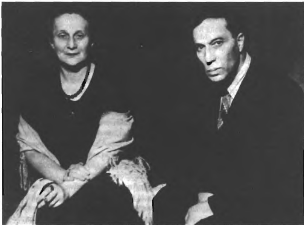
Анна Ахматова и Борис Пастернак. 1946 г.