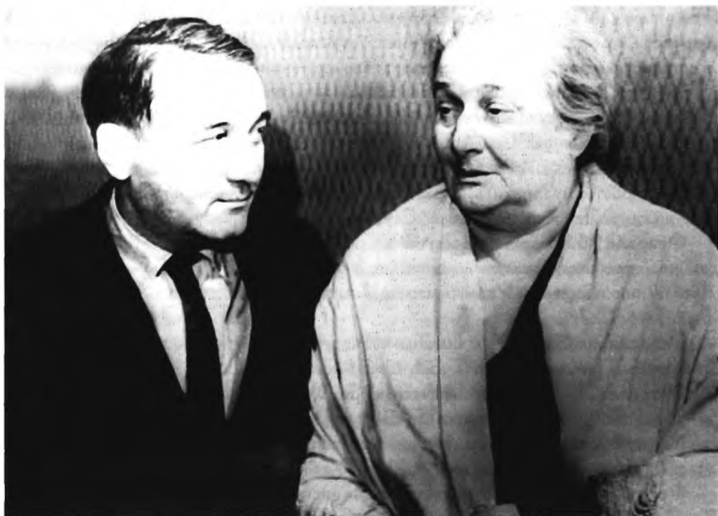
Анна Ахматова и Лев Гумилев. 1960 г.

Февраля 3. Черновик заметки «Рудаков. Листки из дневника». — РНБ. Ф. 1073. № 84. Л. 1–1 об.