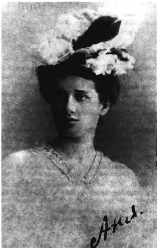
Анна Горенко. 1905 г. Евпатория

«Моя мать целый год провела со всеми детьми в Евпатории. <...> О событиях 1905 года мы узнавали только по слухам. Я бродила по пустынному пляжу и в первый раз слушала „взаправдашные“, а не учебные выстрелы с „Потемкина“. — А2. С. 462.