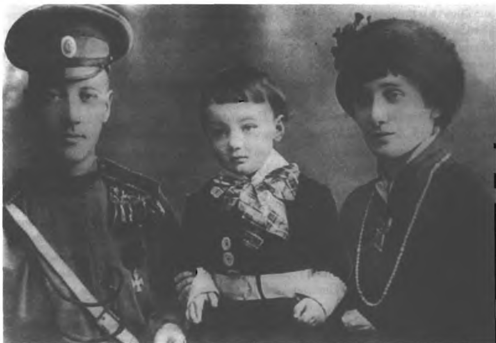
Н. С. Гумилев, Лева Гумилев, Анна Ахматова. 1915 г.

Январь, между 25 и 27. Н. С. Гумилев приехал с фронта в Петроград. — Лукн. (Тб.). С. 57.