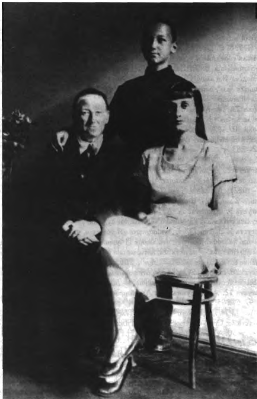
Лева Гумилев, Анна Ахматова, А. И. Гумилева. 1927 г.