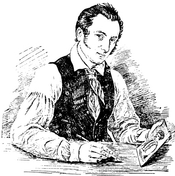
Николай Александрович Бестужев