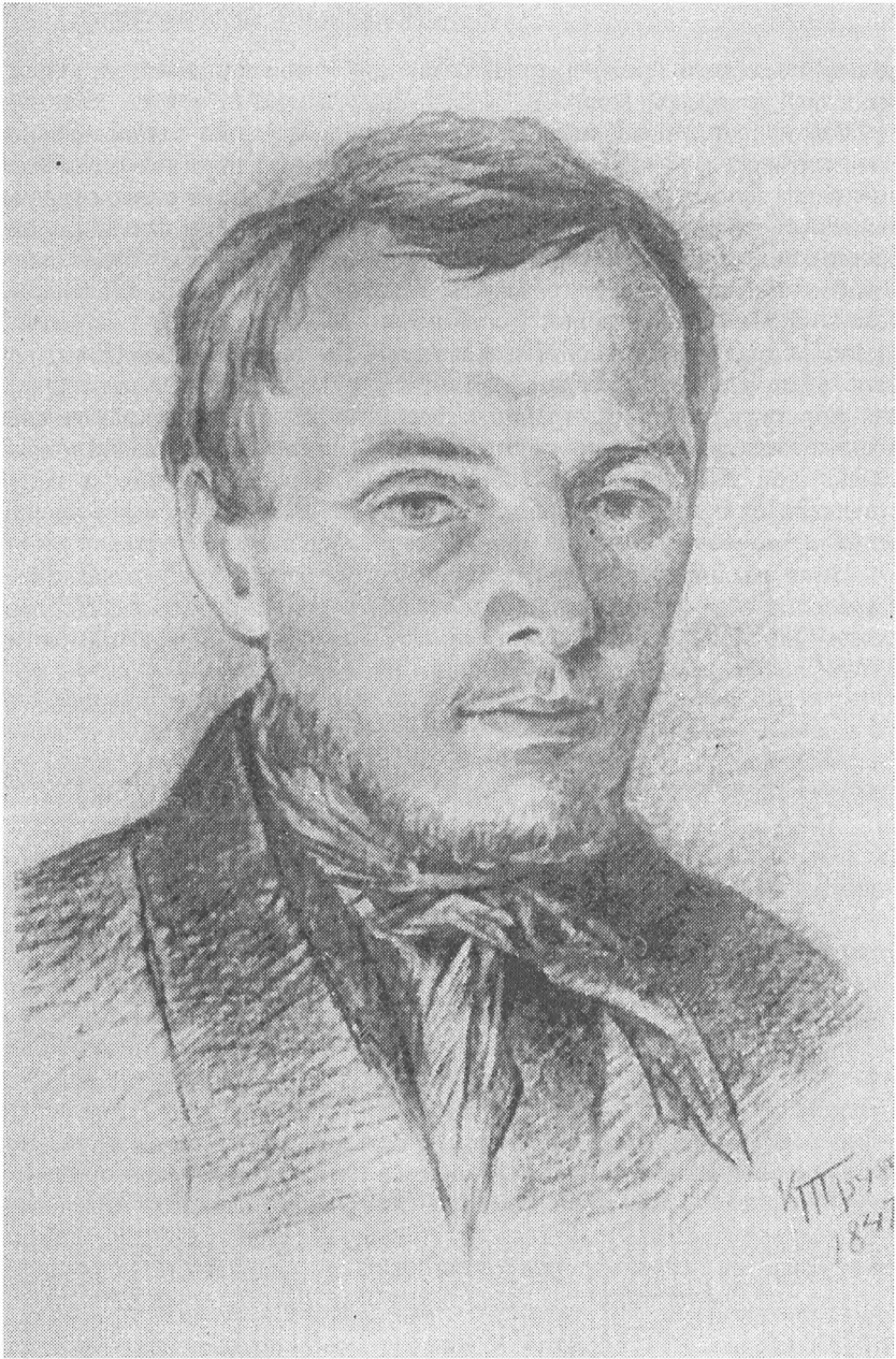
Графический портрет Ф. Достоевского с рисунка К. Трутовского (1847)