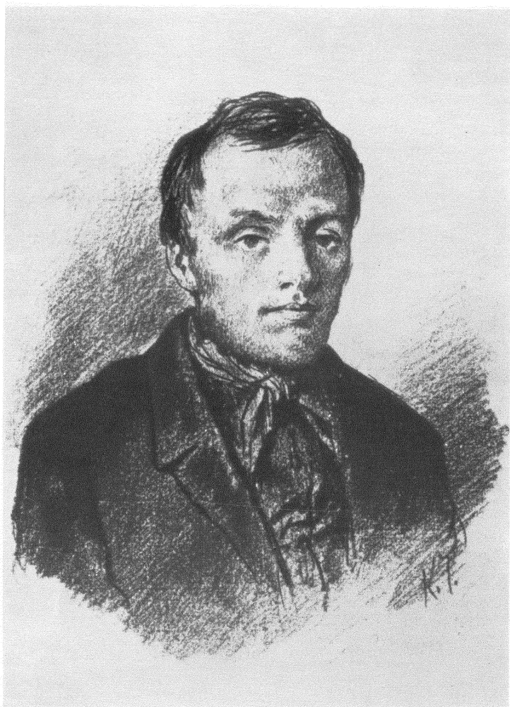
Ф. М. Достоевский. Рисунок К. А. Трутовского. 1847 г.