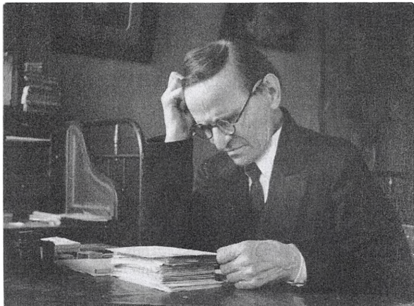
Степан Борисович Веселовский