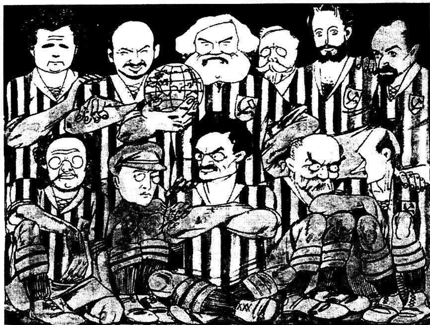
Карикатура из журнала «Красный перец», 1923, №14, с. 7.

Карикатурное изображение ведущих советских политиков, стоящих у власти в 1923 году, в виде сборной команды по футболу.