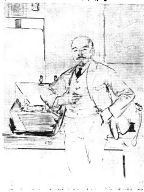
В.И. Ленин.(эскиз) Худ. Ф.Малевин.

Сам Б.М. Кустодиев для статьи «О портретах Ленина», написанной для Лениздата, к изданию сборника, к сожалению не увидевшего свет, писал: «Самое существенное в вопросе о портретах Ленина – это то или иное задание, данное портретисту. Ленин-учёный – одно лицо; Ленин-агитатор, говорящий речь на площади – другое и т.д. На чем же остановиться? Если говорить о каком-то одном портрете, который должен суммировать все стороны характера и деятельности Ленина, то от художника требуется синтез целого ряда образов. Всякий же синтез, понятно, будет субъективен». 74 Для контраста приведём два портрета Ленина: один - Земной, другой – Небесный.