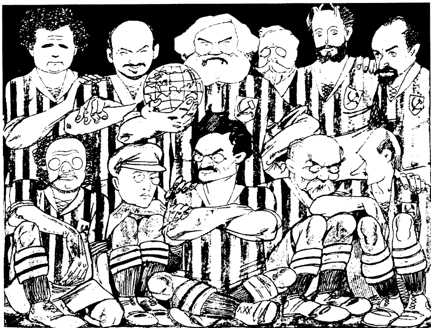
Карикатура из журнала «Красный перец», 1923, №14, с.7.

Карикатурное изображение ведущих советских политиков, стоящих у власти в 1923 году, в виде сборной команды по футболу.