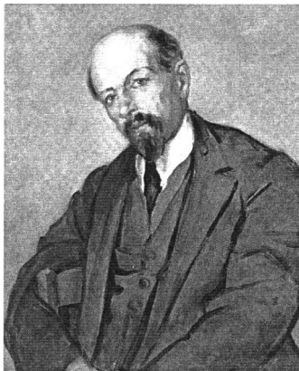
Портрет Ленина. Худ. Эмиль Бернар

Хочется представить редчайший и неожиданный портрет играющего в шахматы Ленина, написанный знаменитым мастером Эмилем Бернаром (1868-1941).