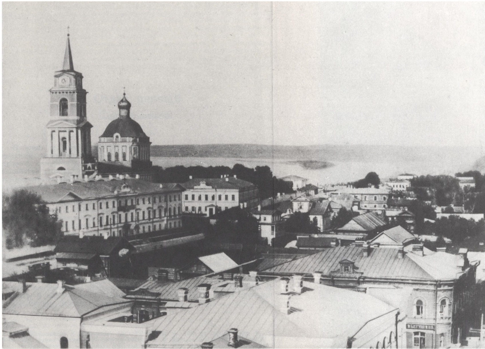
Пермь. Кафедральный собор. Фото 1880-х гг.