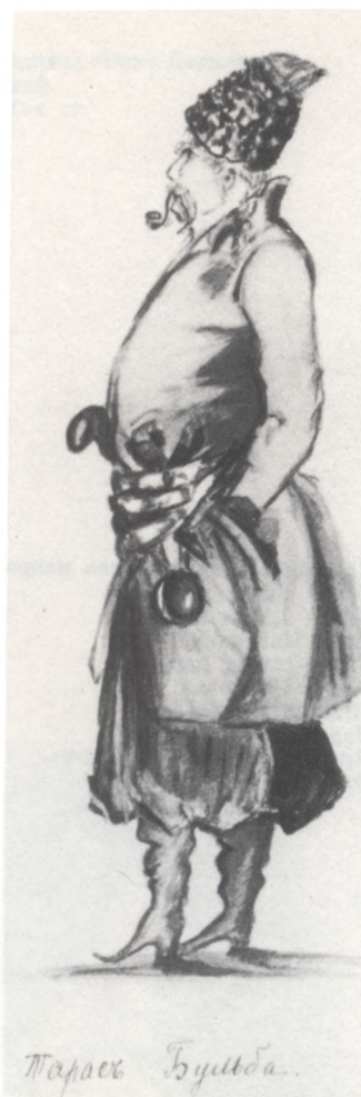
Павел Павлович Дягилев в костюме Тараса Бульбы. Акварель. 1880-е гг.