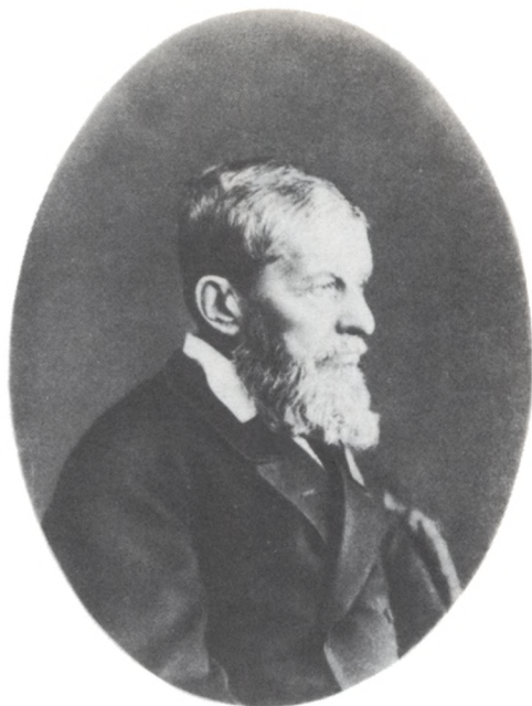
Павел Дмитриевич Дягилев. Фото 1870-х гг.