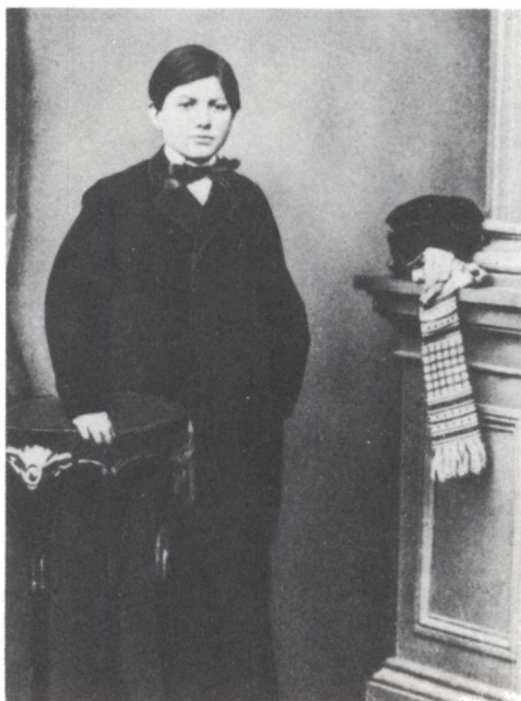
Павел Павлович Дягилев. Фото нач. 1860-х гг.