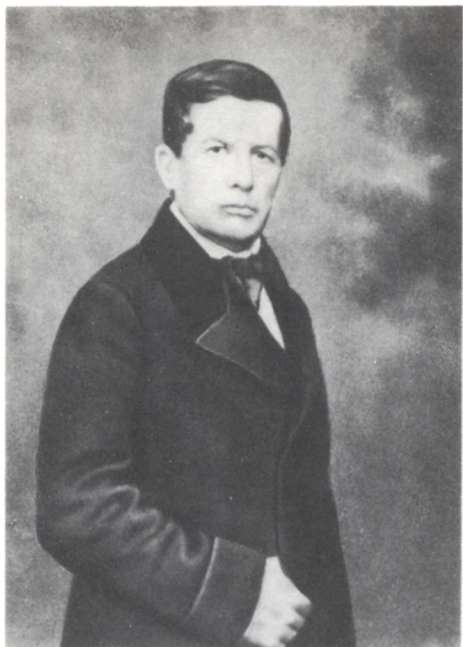
Павел Дмитриевич Дягилев. Фото нач. 1850-х гг.