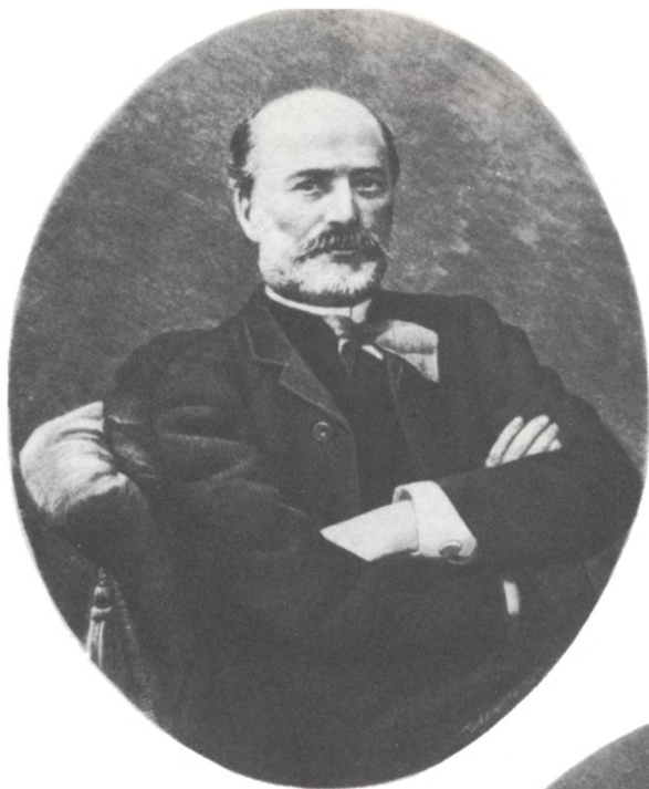
Валерьян Александрович Панаев. Фото 1880-х гг.