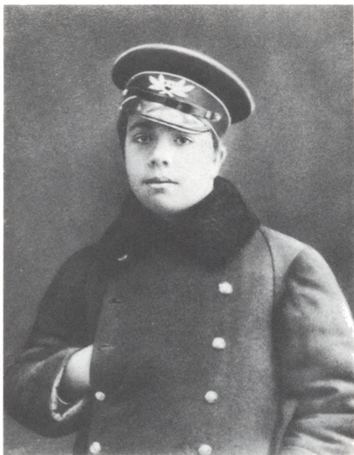
Сергей Павлович Дягилев (гимназист). Фото середины 1880-х гг.