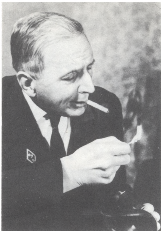
Сергей Валентинович Дягилев. Фото 1963 г.