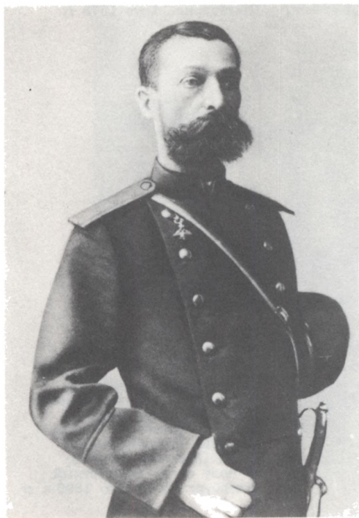
Михаил Ардальонович Баралев- ский. Фото 1880-х гг.