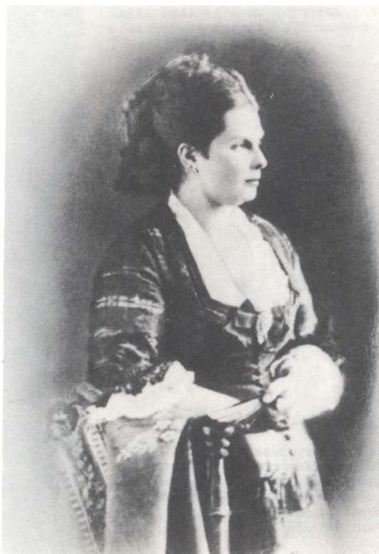
Анна Павловна Дягилева-Философова. Фото 1875—76 гг.