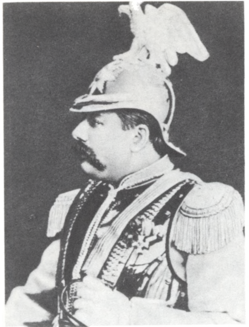
Павел Павлович Дягилев. Фото кон. 1870-х гг.