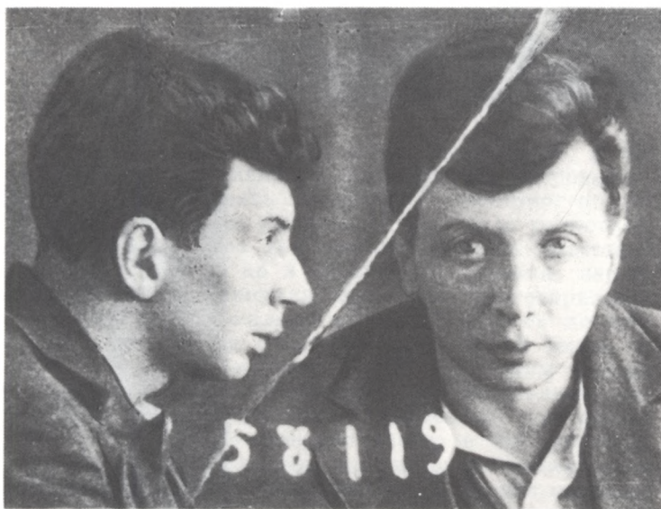
Валентин Павлович Дягилев. Тюремная фотография. Ок. 1929 г.