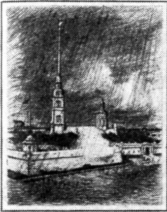
Петропавловская крепость (рис. Е. Лансере)