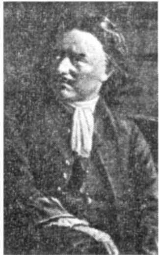
Петр (справа) и Алексей (фрагменты картины Н. Ге «Петр I допрашивает царевича Алексея Петровича в Петергофе»)

Извлечение на свет истории декабризма было первой, но далеко не единственной задачей Вольной печати в ее сражениях за «былое». Запрещенные строки Пушкина и других поэтов, опубликованные во второй книге «Полярной звезды», как бы возвращали 1830—40-е годы; 1820 год является вместе с «Семеновской историей» (третья книга «Полярной звезды»); первым прорывом в минувший XVIII век была знаменитая герценовская работа «Княгиня Екатерина Рома-