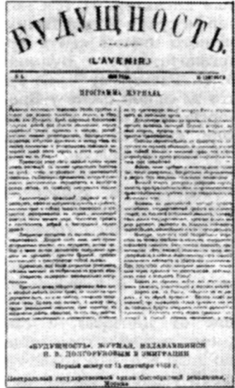
Газета «Колокол» А. Герцена и Н. Огарева и газета «Будущность» П. Долгорукова

К 1861 г. Вольная печать Герцена и Огарева «раскрепостила» уже немало областей российской истории: XVIII век, декабристы, Пушкин, 1840-е годы.