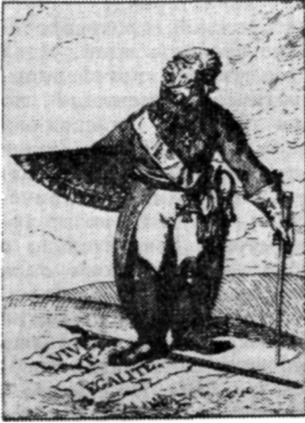
Карикатура на Павла I. 1799 г.

(Из материалов, собранных Н. К. Шильдером 1 )