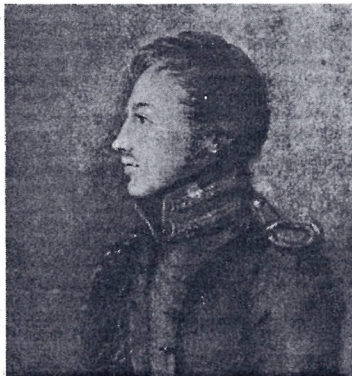
П.И. Пестель. 1929

То, что случилось в 1825-м, также вытекало из ряда древних, чисто российских традиций.