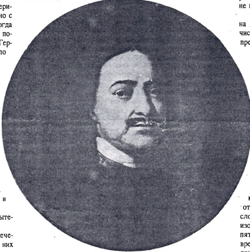
Петр I. Портрет работы Ив. Никитина. 20-е гг. 18 в. Государственный Русский музей. Санкт-Петербург

Это российское взлуд неоднократно встречается в отечественной истории - признак внезапного бурного взрыва, революционности. Разрешение, среди медленно разгорающейся, старинной, средневековой, в сущности, Руси не найти сколько нужно способных