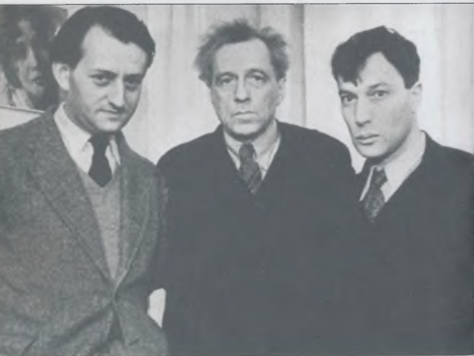
А. Мальро, Вс. Мейерхольд, Б. Пастернак дома у Мейерхольда