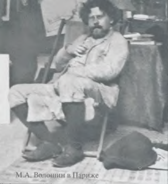
М.А. Волошин в Париже