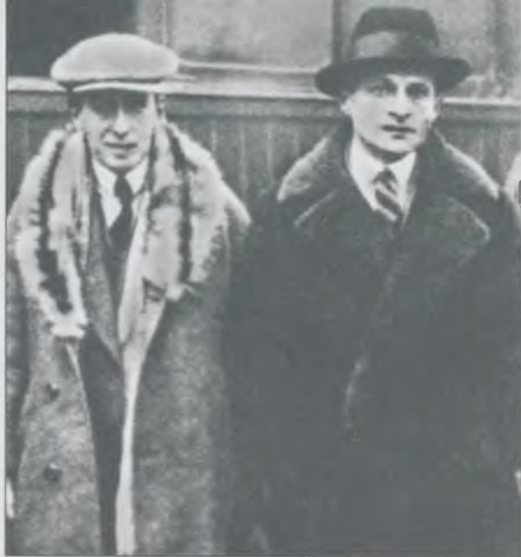
Илья Эренбург и Юлиан Тувим. Польша, декабрь 1927