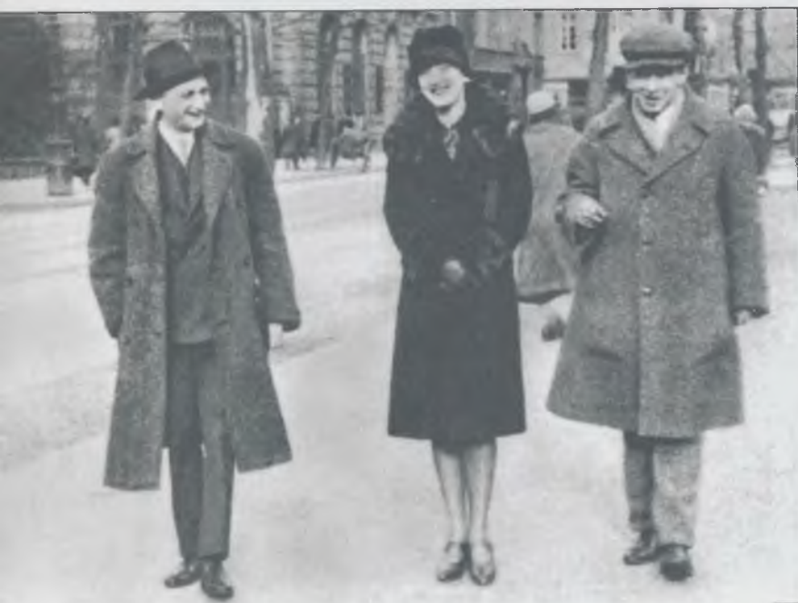
Й. Рот, Л. Козинцева-Эренбург и И. Эренбург. Франкфурт, 1927