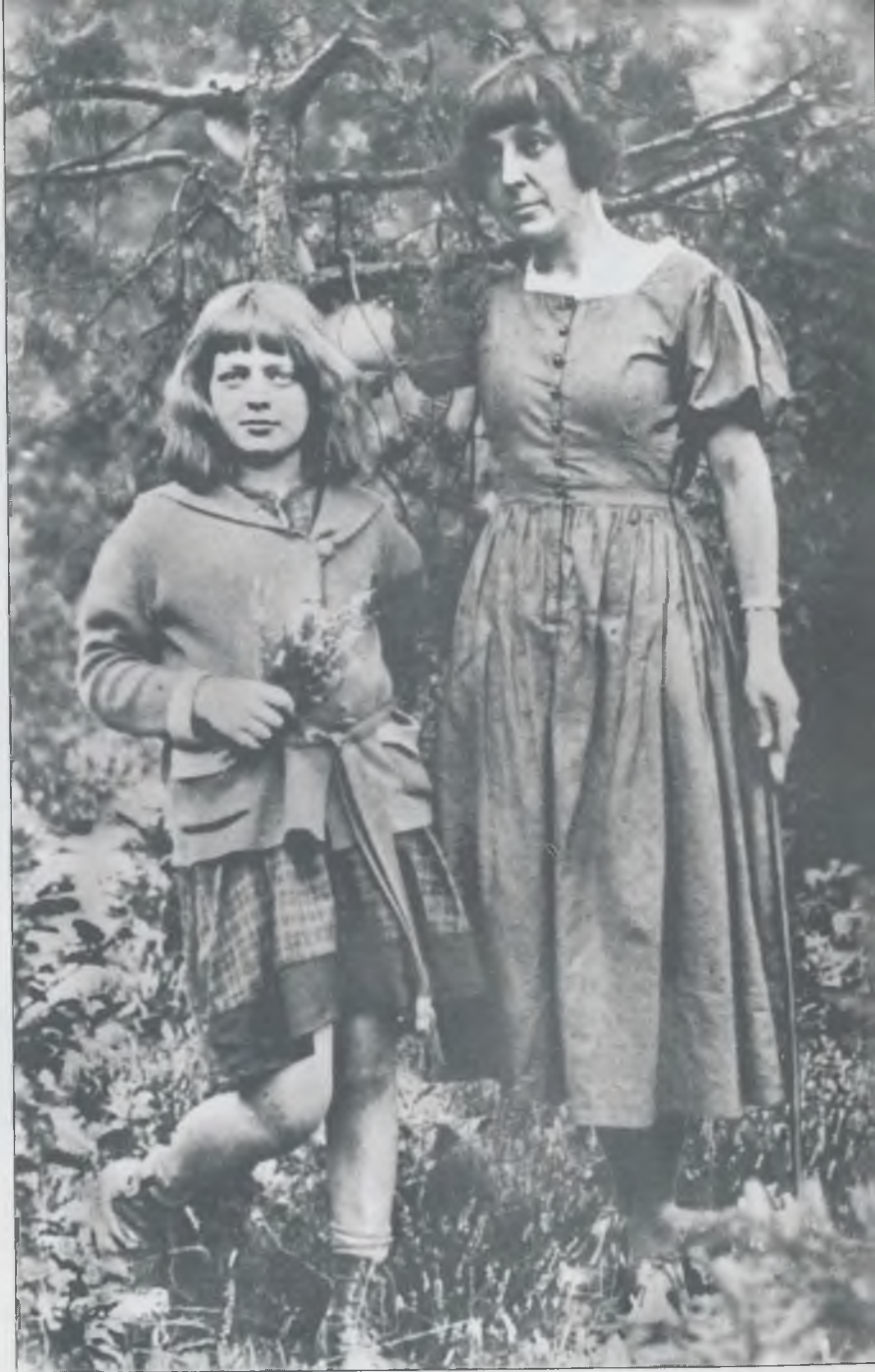
Марина Цветаева с дочерью Ариадной Эфрон