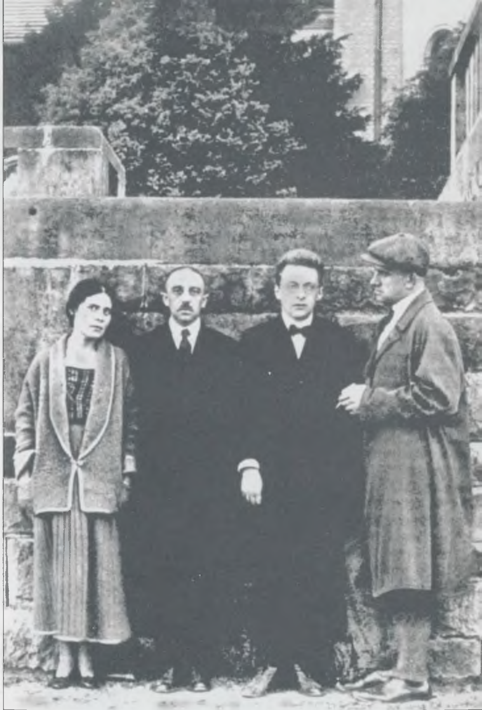
Л.Ю. Брик, О.М. Брик, Р.О. Яacobсон, В.В. Маяковский. Германия, 1923