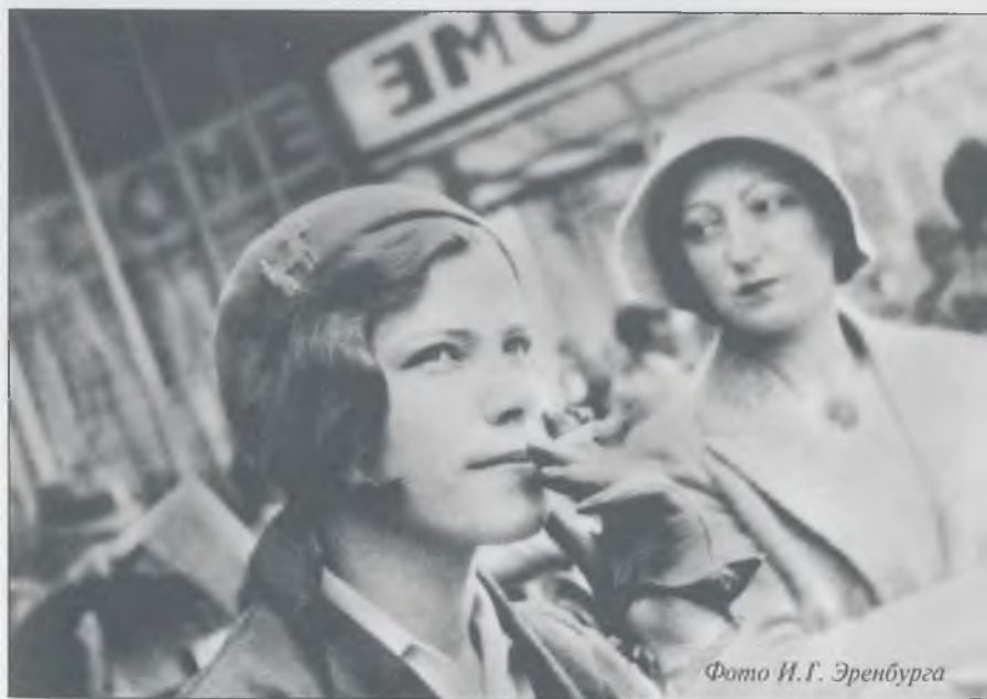
Фото И.Г. Эренбурга