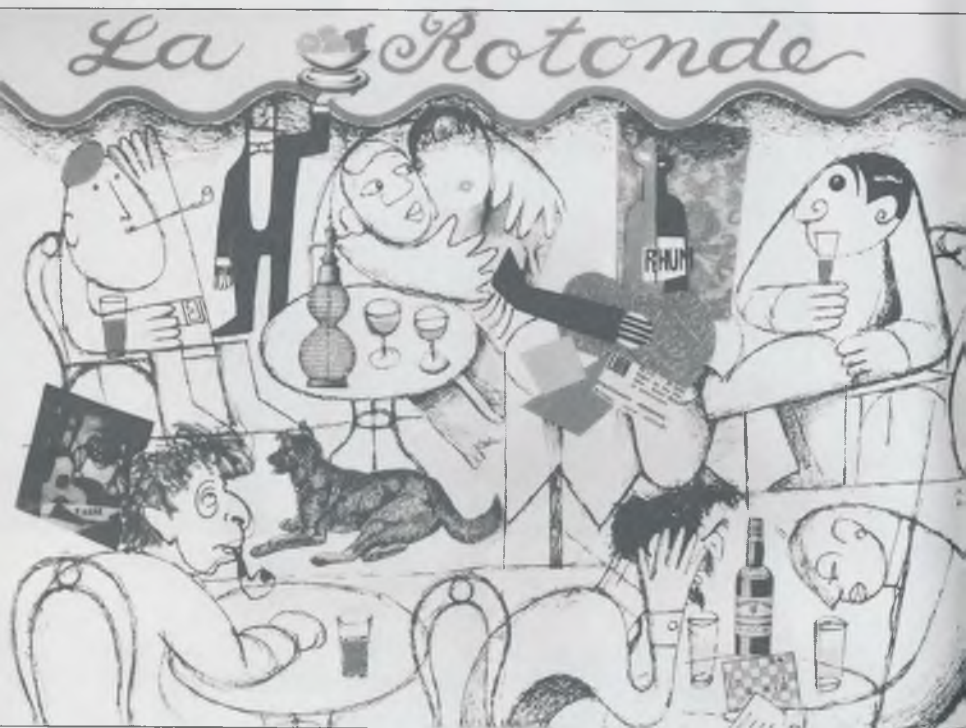
Эренбург, Брак, Ривера и Пикассо в кафе «Ротонда». Рисунок А. Гоффмейстера