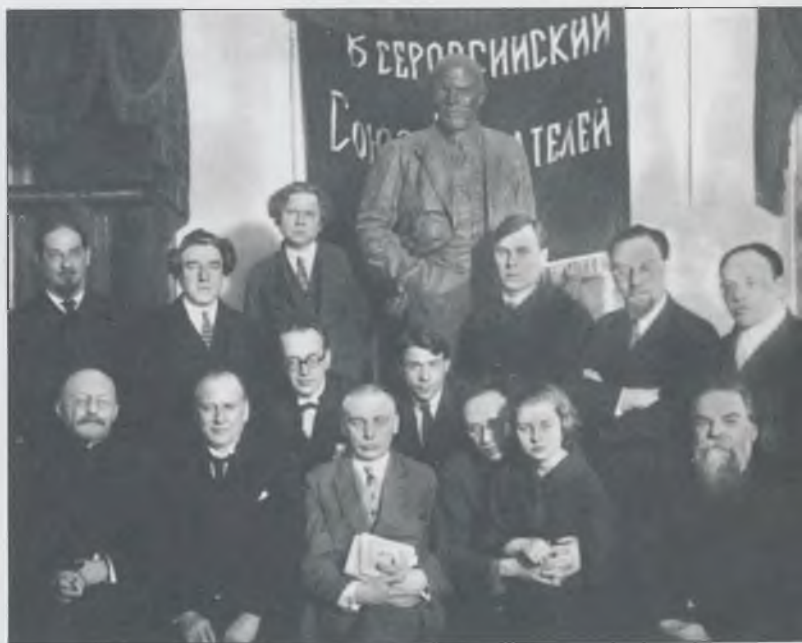
Празднование 5-летнего юбилея журнала «Красная новь». Москва, 1927 Сидят: В.В. Вересаев, Х.Г. Раковский, Б.А. Пильняк, А.К. Воронский, М.П. Герасимов, К.Б. Радек с дочкой Соней, П.Н. Сакулин. Стоят: ?, В.П. Полонский, Ф.В. Гладков, ?, А.М. Эфрос, И.Э. Бабель