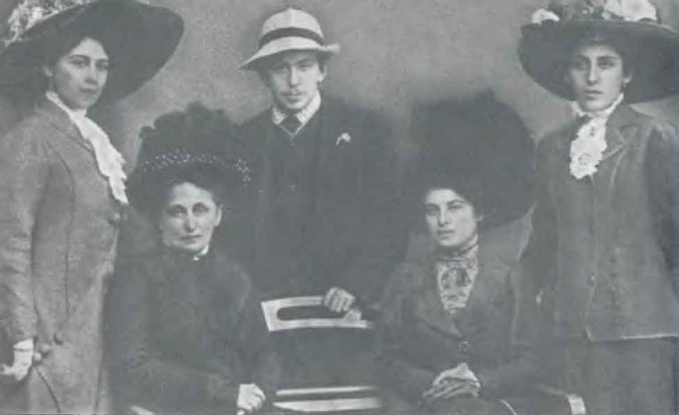
Илья Эренбург с матерью и сестрами. Киссинген, 1909