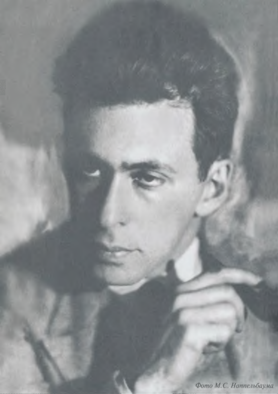
Илья Эренбург. Ленинград, 1926