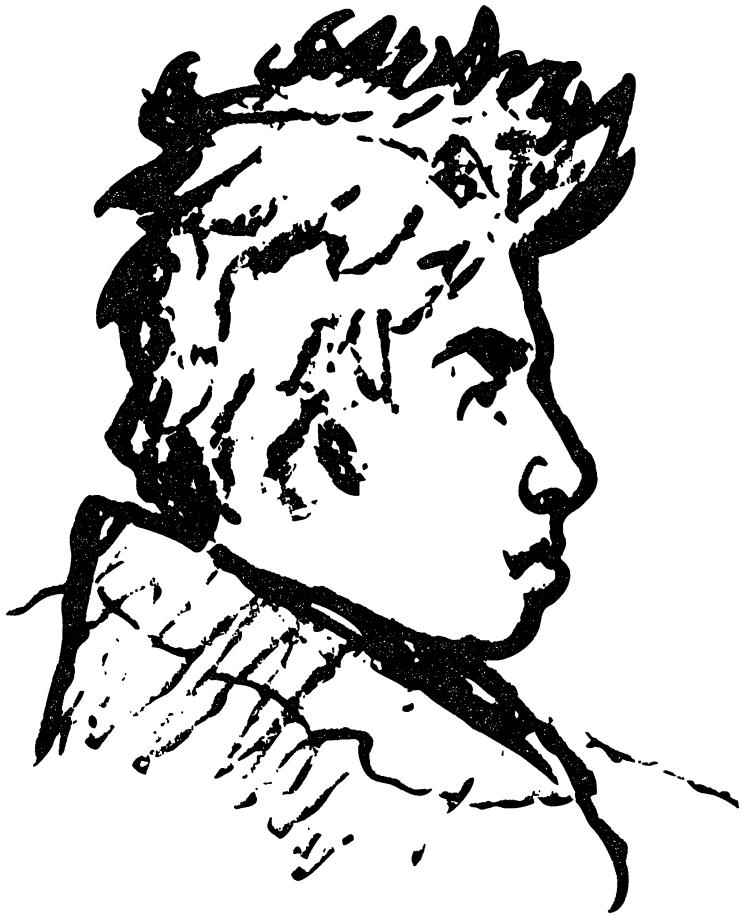
Рисунок Е. Кругликова. Париж, 1912