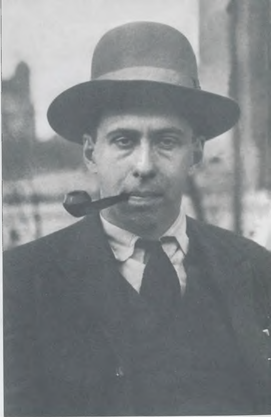
Илья Эренбург. Берлин, 1922