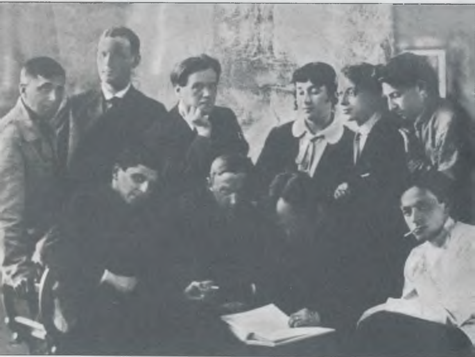
Серрапионовы Братья. Петроград, 1922