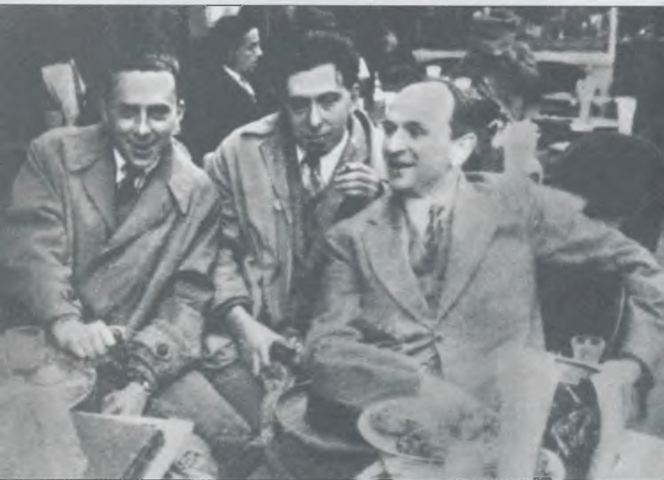
О.Г. Савич, И.Г. Эренбург, и В.Г. Лидин. Париж, 1927