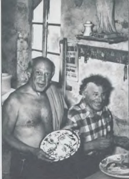
П. Пикассо и М. Шагал в мастерской Пикассо