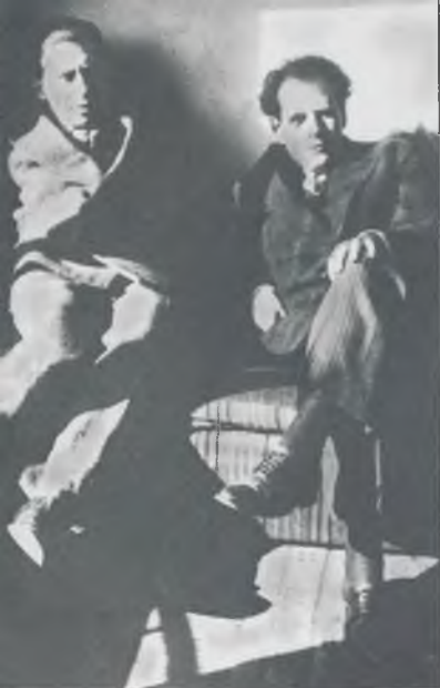
И. Эренбург и С. Эйзенштейн в парижской квартире Эренбурга