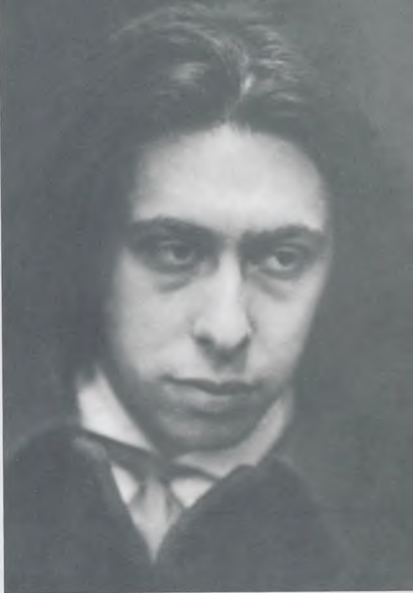
Илья Эренбург. Париж, 1915