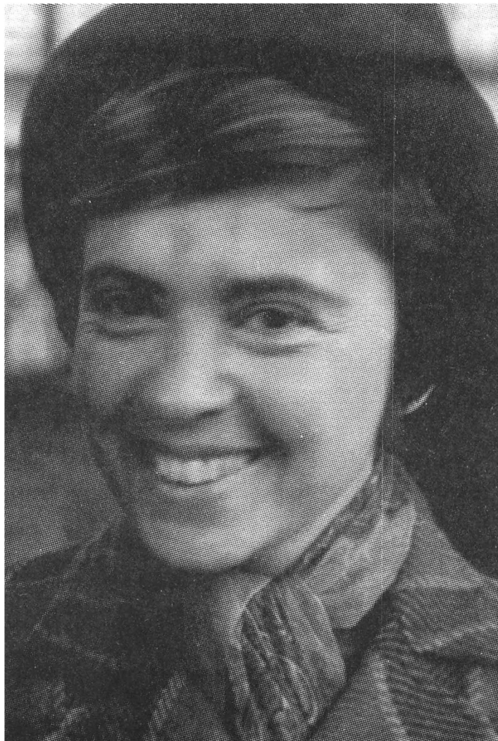
Фрида Вигдорова, июнь 1954 г.