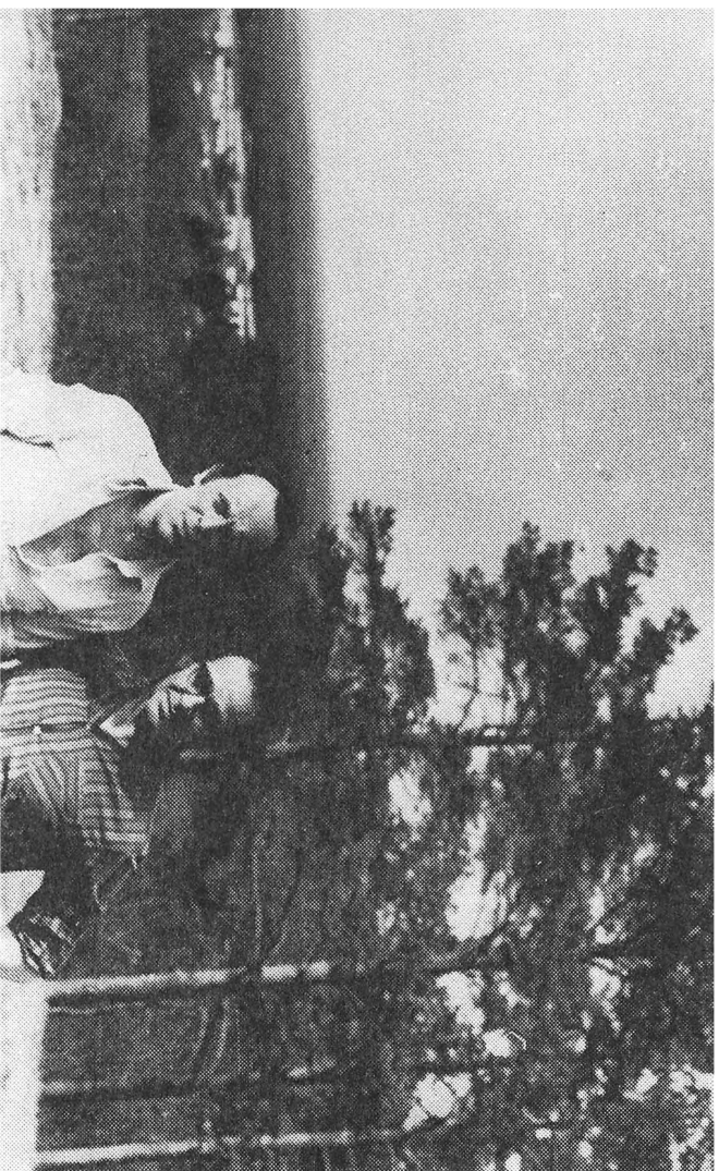
Прощание перед отъездом И. Бродского в эмиграцию, 20 мая 1972 г.