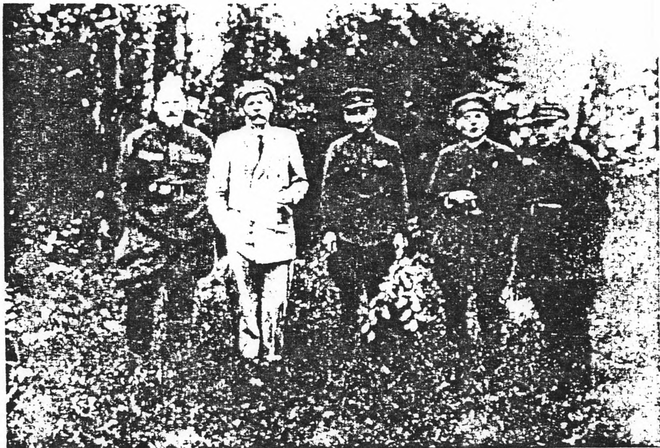
В гостях у ОГПУ. М. Горький на Соловках. 1929 г.