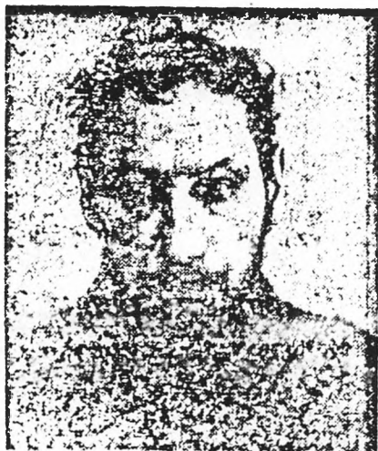
Фотография из дела