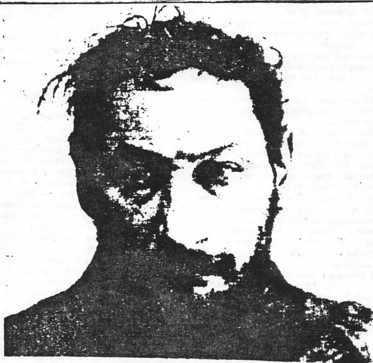
Заклученный П. А. Флоренский, 1933 г.

В одном из последних писем с Соловков — 13 февраля 1937 года — Флоренский писал: «...Удел величия — страдание — страдание от внешнего мира и страдание внутреннее, от себя самого. Так было, так есть и так будет. Почему это так — вполне ясно; это — отставание по фазе: общества от величия и себя самого от собственного величия... Ясно, свет устроен так, что давать миру можно не иначе, как расплачиваясь за это страданиями и гонением. Чем бескорыстнее дар, тем жестче гонения и тем суровее страдания».