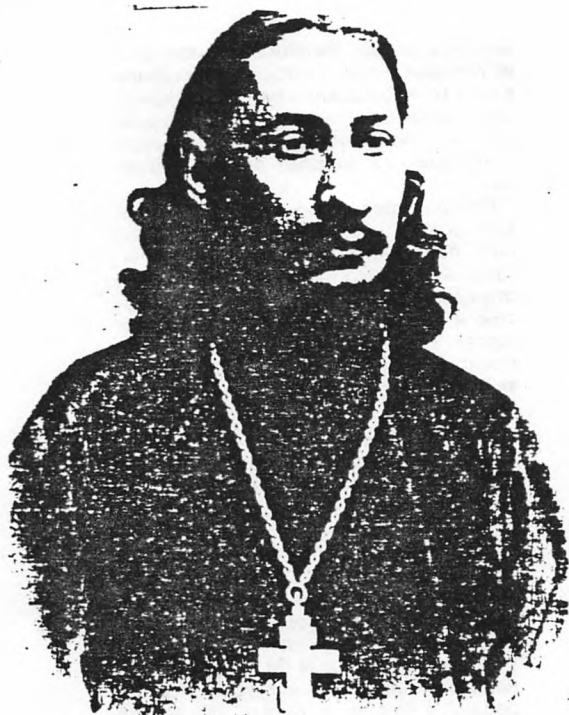
Отец Павел Флоренский. 1912 г.