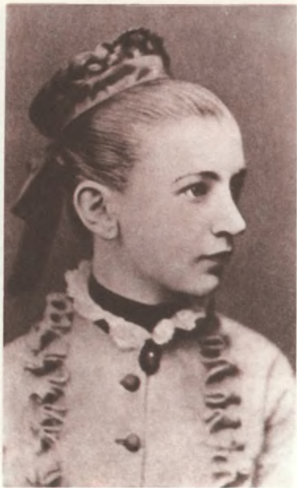
Марте 19 лет