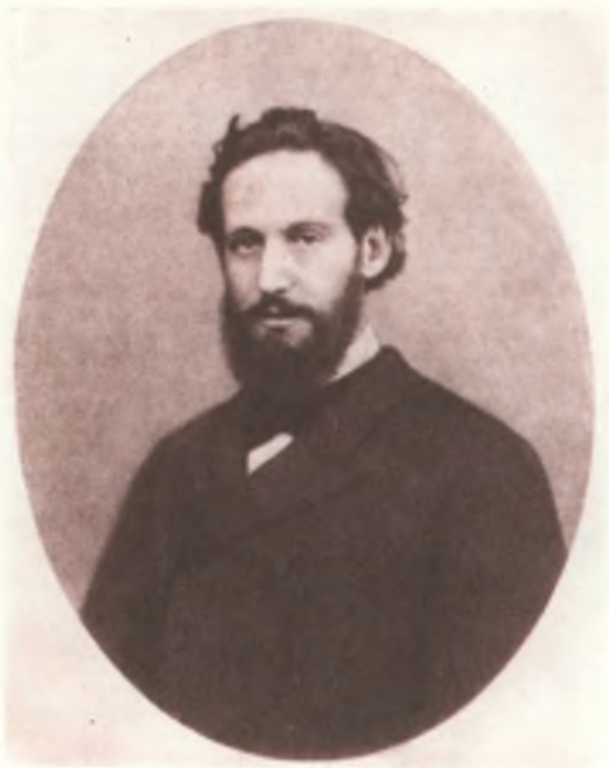
Доктор Эрнст фон Флейшль