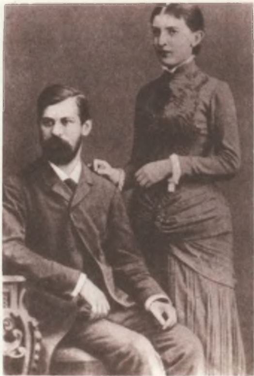
Зигмунд Фрейд и Марта Бернайс. Вандсбек, 1885