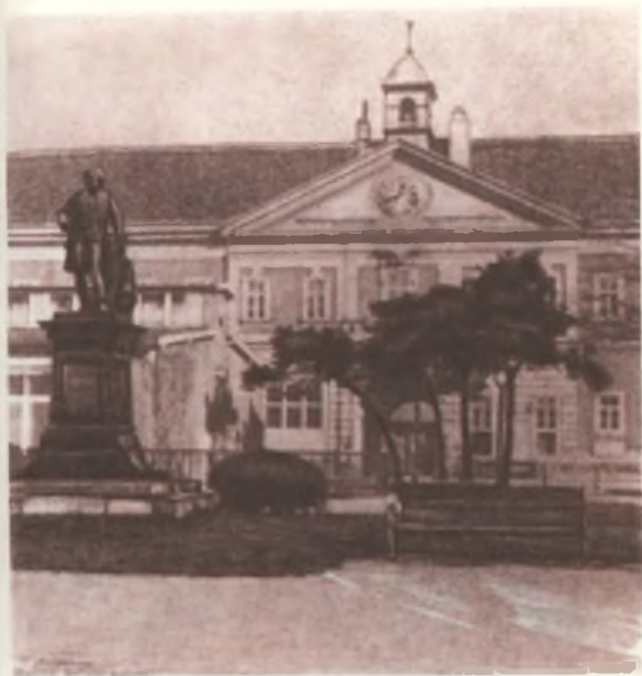
Венская общегородская клиника