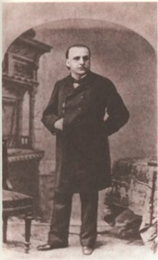
Профессор Жан-Мартин Шарко