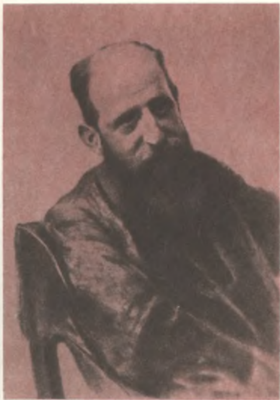
Доктор Йозеф Брейер, профессор психологии, близкий друг Фрейда