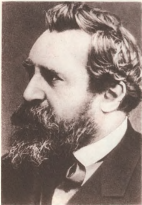
Профессор Теодор Г. Мейнерт