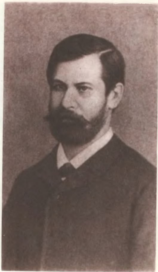
Зигмунд Фрейд, 1885