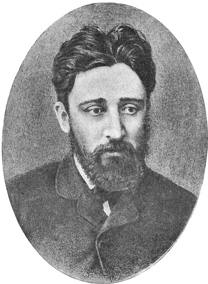
В. М. ГАРШИН С фотографии 1884 г.