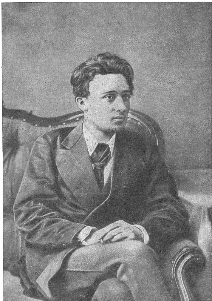
В. М. ГАРШИН С, фотографии 1876 г.