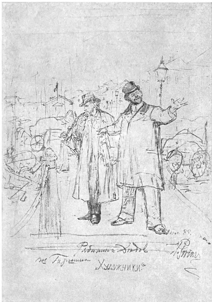
Карандашный этюд И. Е. Репина к рассказу „Художники“ (1888 г.)