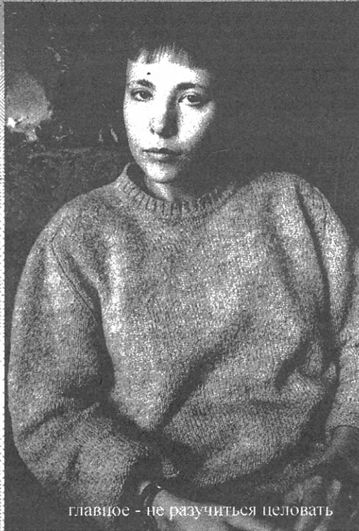
главное - не разучиться целовать