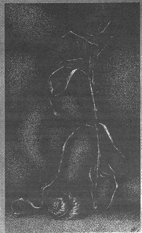
Сухая музыка, бум., тушь., 34x19 см, 1995 г.

сухая музыка созвездий свечой сгоревшей прозвучала. сотри изгибы тонких линий... морской ракушкой стань сначала.