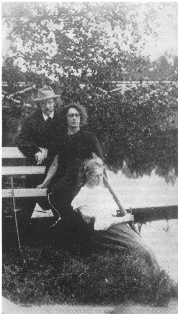
Вячеслав Иванов Л. Зиновьева-Аннибал и ее дочь