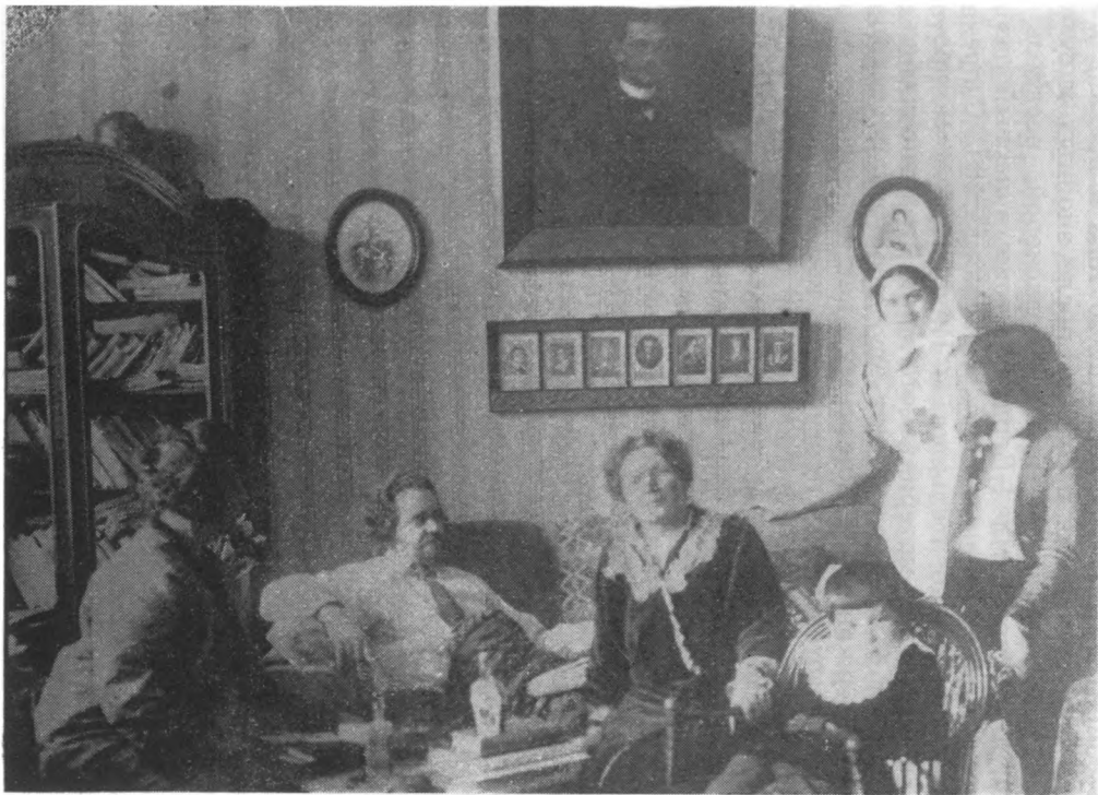
Сестры Герцык в гостях у больного Н. Бердяева