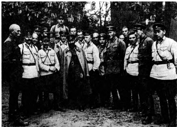
Командный состав Среднеазиатского военного округа. Второй справа – А.В. Горбатов