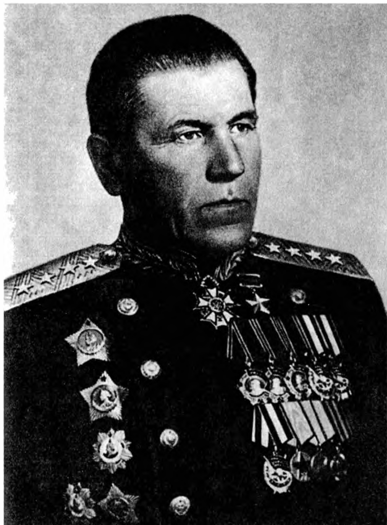
Александр Васильевич Горбатов