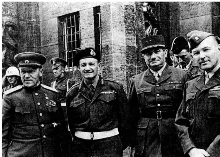
Советский военный комендант Берлина А.В. Горбатов с военными комендантами от Великобритании, Франции и США. 1945 г.