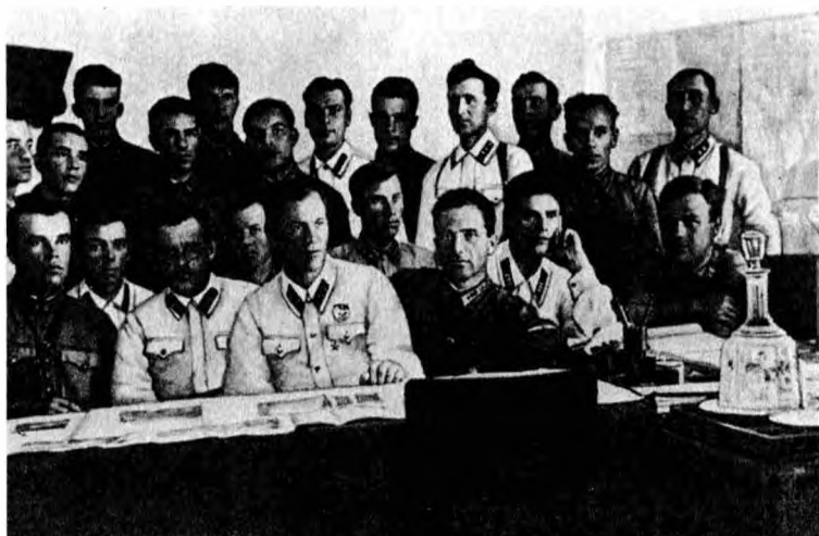
Командир 4-й Туркменской горнострелковой кавалерийской дивизии А.В. Горбатов (в первом ряду третий слева) с командным составом соединения, 1933 г.