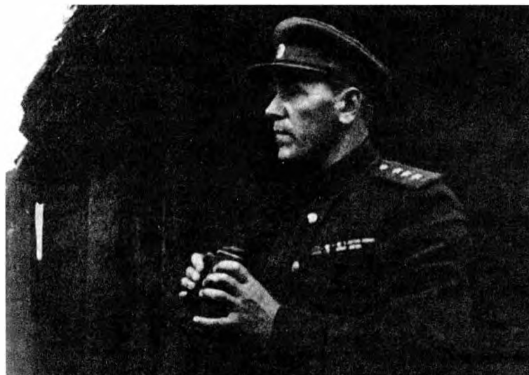
В ходе операции «Багратион». Белоруссия, 1944 г.