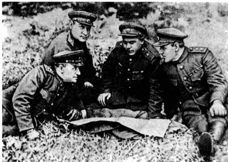
На рекогносцировке. Справа — командующий 3-й армией генерал-лейтенант А.В. Горбатов