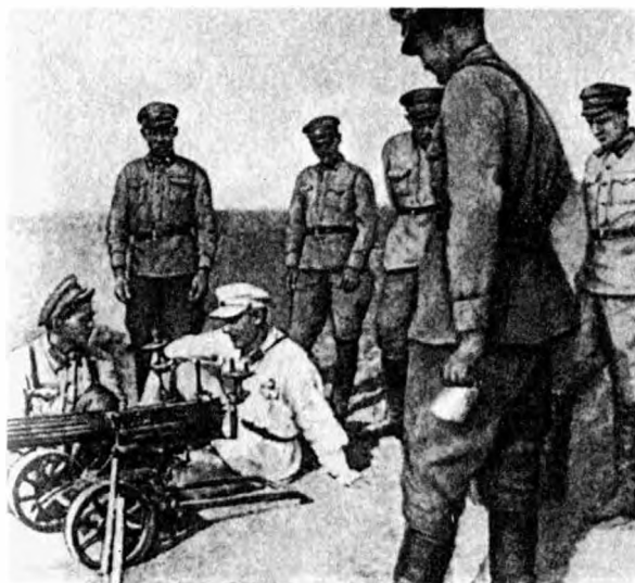
А.В. Горбатов на стрельбище проверяет подготовку пулеметчиков