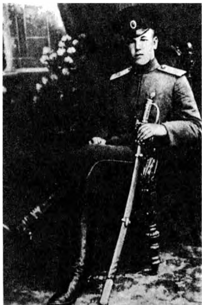
А.В. Горбатов в период службы в 17-м гусарском Черниговском полку. 1912 г.