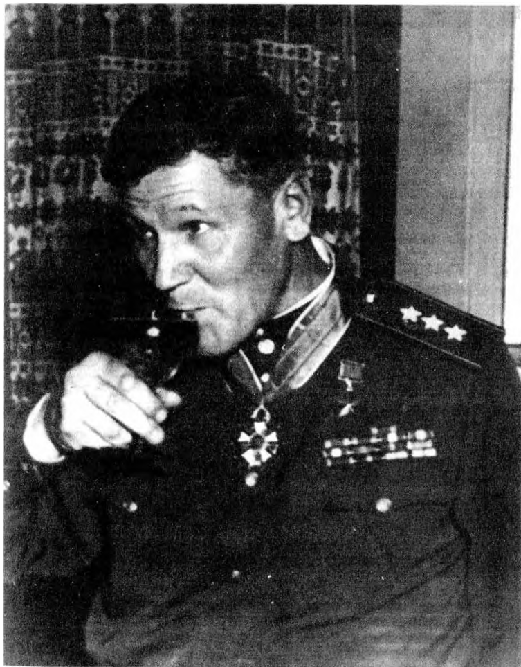
Первая в жизни рюмка в честь Дня Победы