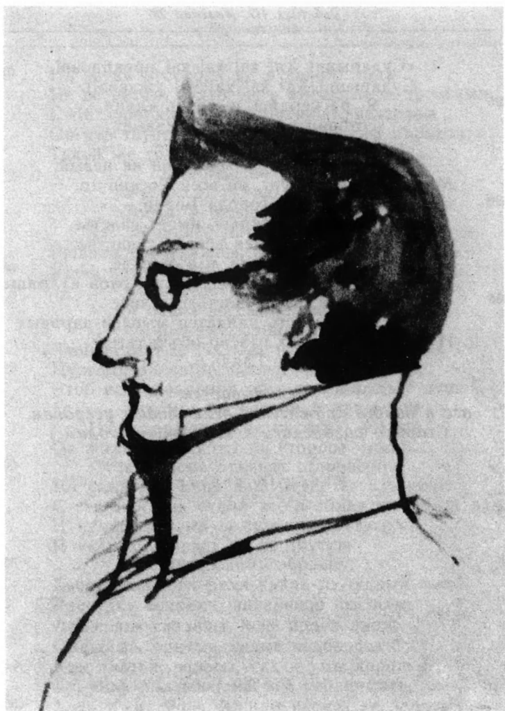
А. С. Грибоедов. Рисунок А. С. Пушкина на полях рукописи главы II «Евгения Онегина». 1823.