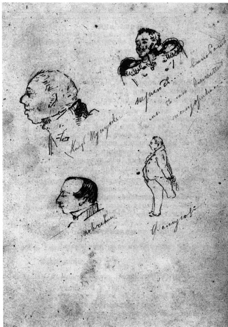
«Горе от ума». Рисунки на последнем листе одного из списков.