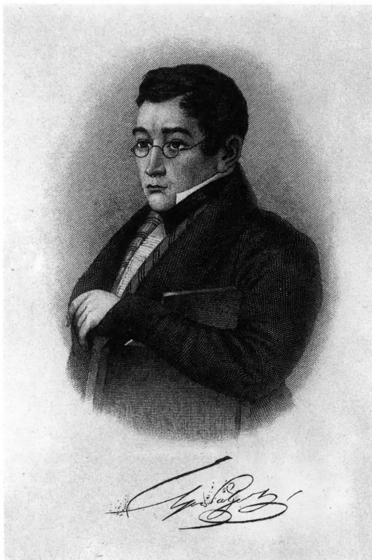
А. С. Грибоедов. Миниатюра М. И. Тербенева, вделанная в переплет Булгаринского списка. 1824. Гравюра Ф. А. Брокгауза.