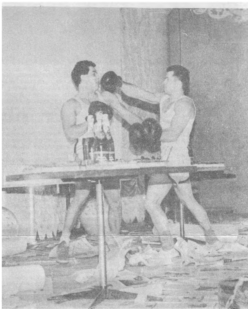
АКЦИЯ “ДОСЛОВНЫМ ПОКАЗ МОД В 1990 ГОДУ”