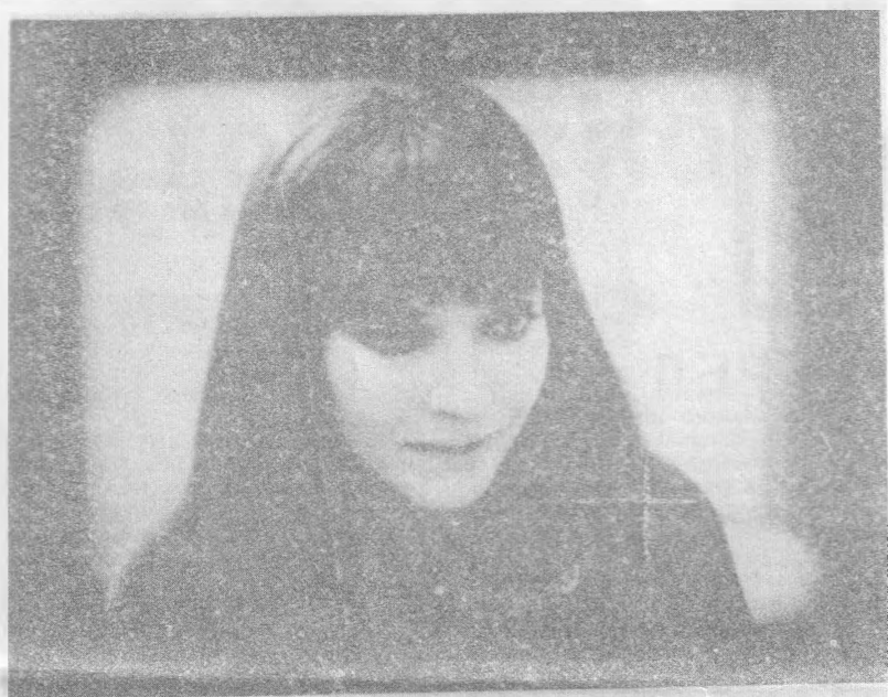
КАДР ИЗ ФИЛЬМА ГОДАРА "АЛЬФАВИЛЬ"