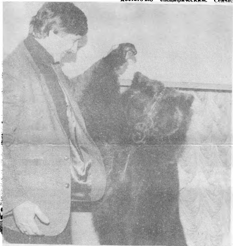
АКЦИЯ “ДОСЛОВНЫМ ПОКАЗ МОД В 1990 ГОДУ”

Что же касается современного советского искусства, то андеграунд — это кучка дураков, которые договорились считать себя умными, а чтобы убедительней выглядело, установили ранжир: вот умный, вот не совсем, вон там совсем монстр, а вот идиот. Дураки уши развесили и слушают.