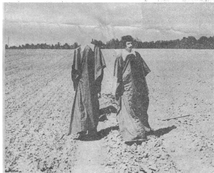
III-И ВАРИАНТ. 1978.