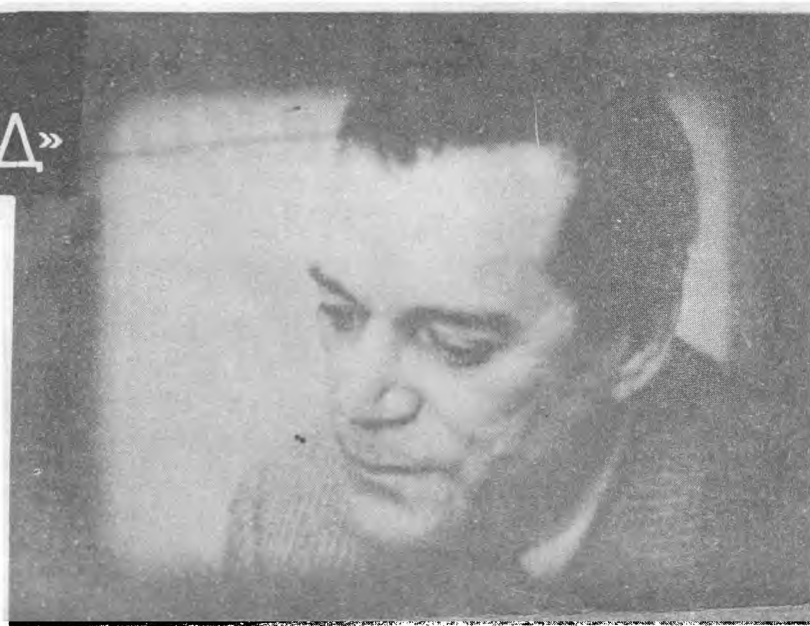
КАДР ИЗ ФИЛЬМА ГОДАРА “АЛЬФАВИЛЬ”