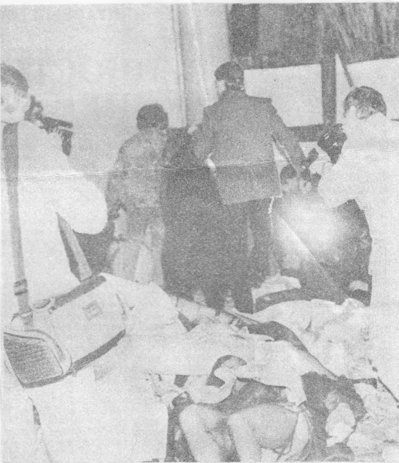
АКЦИЯ "ДОСЛОВНЫЙ ПОКАЗ МОД В 1990 ГОДУ"

ЛОВЕК В ИЗЛИШКЕ. ЛИШНИЙ ПРЕДМЕТ ЕСТЬ СИМВОЛ ИСТИНЫ.