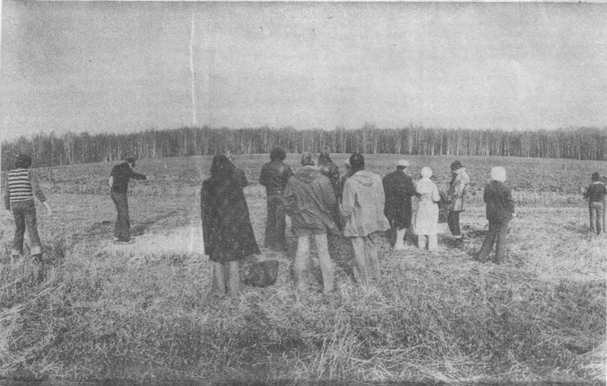
"ВРЕМЯ ДЕЙСТВИЯ". 1978.