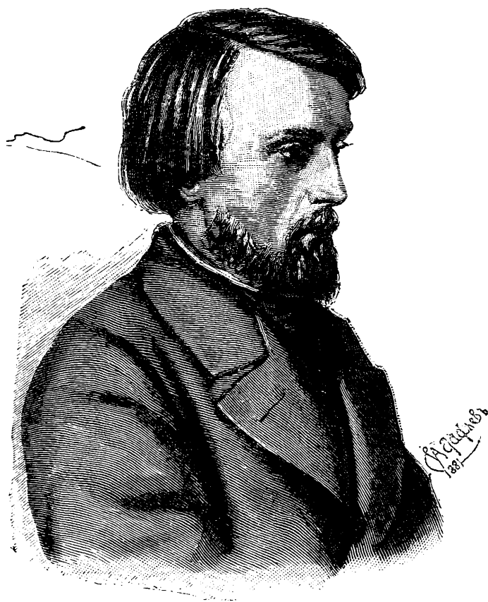
Виссарион Григорьевич БЕЛИНСКИЙ