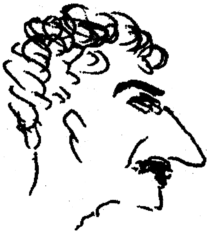
Шарж Г. Попова