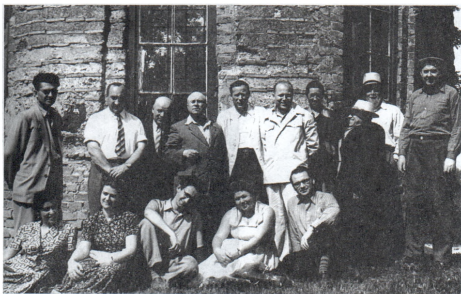
Б.А.Рыбаков с группой украинских археологов. Херсонес. 1950-е гг.