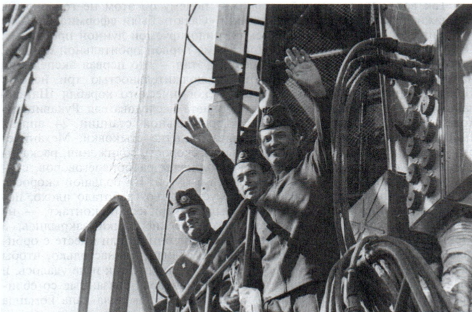
Экипаж прощается с провожающими перед посадкой в КК «Союз-11». Байконур. Июнь 1971 г.