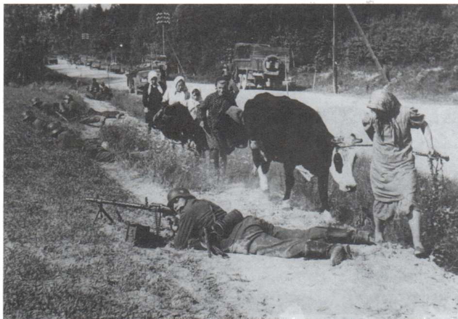
Беженцы, покидающие район боевых действий. Июнь 1941 г.