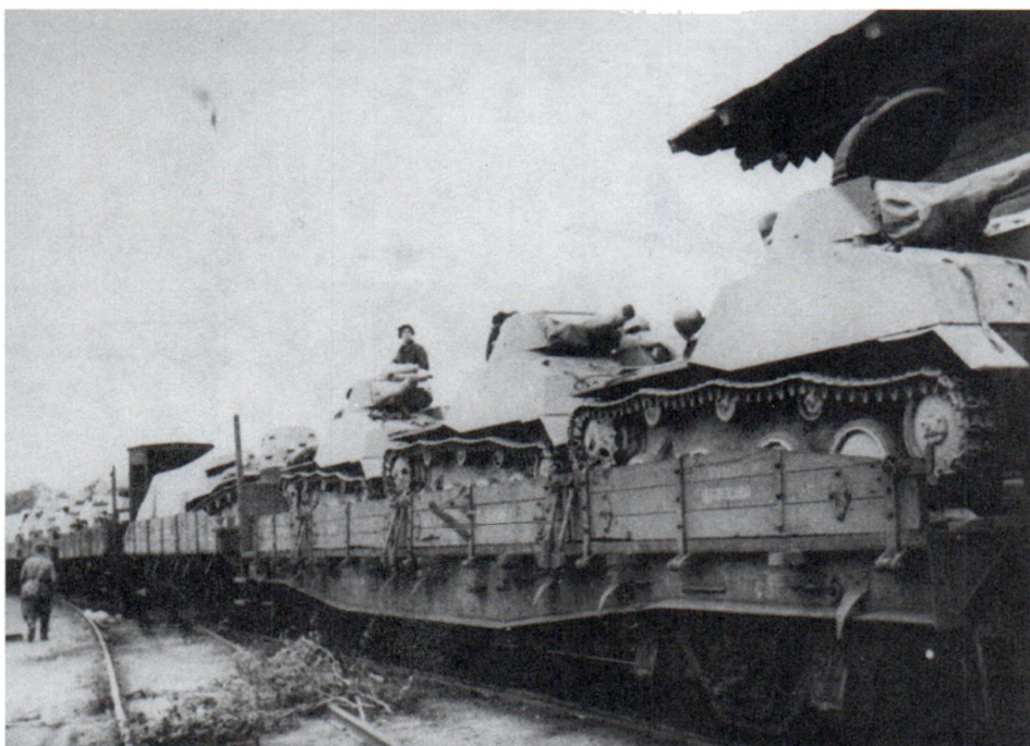
Отправка на фронт эшелона с танками. Москва. Июль 1941 г.