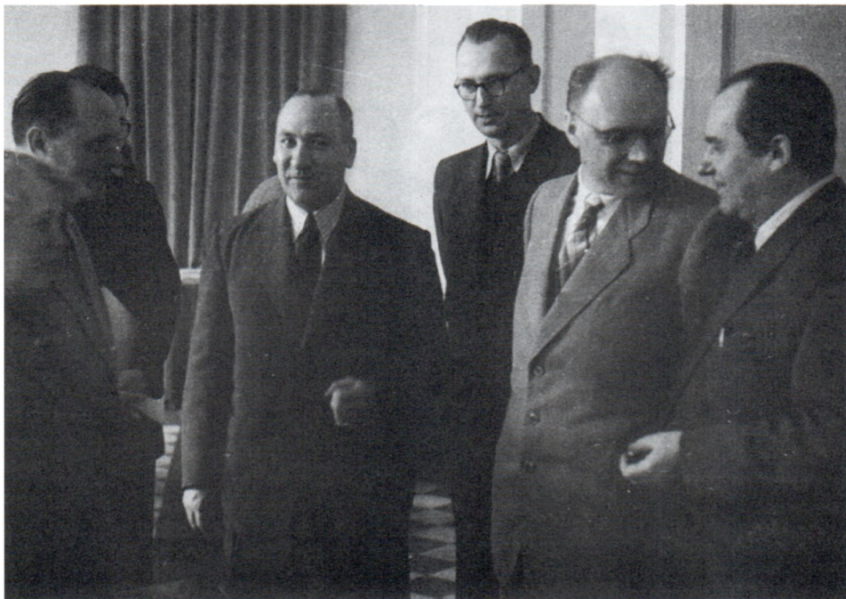
Б.А.Рыбаков и П.Н.Третьяков (справа) на встрече с зарубежными археологами. 1954 г.