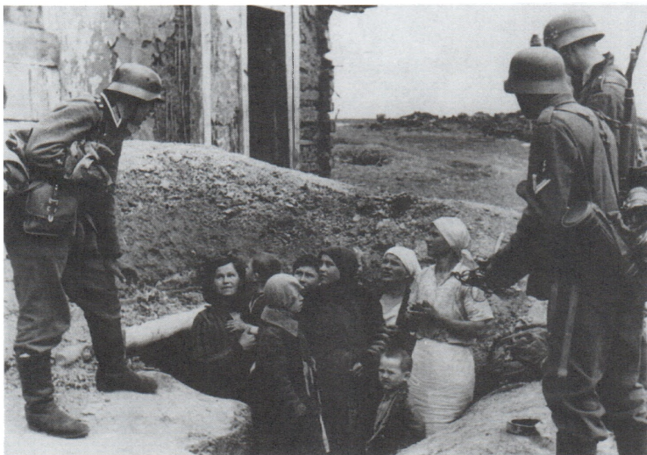
В одном из хуторов, оккупированном немцами. Украина. Июнь 1941 г.