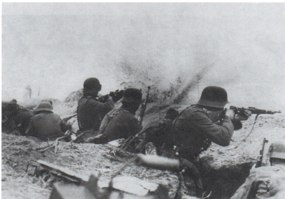
Немецкие солдаты перед атакой. Июнь 1941 г.