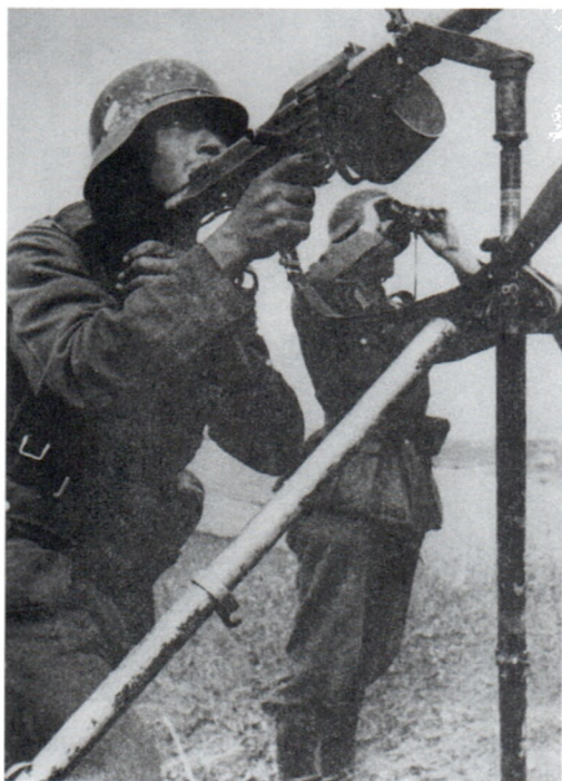
Расчет немецкого зенитного пулемета «М-634». Июнь 1941 г.