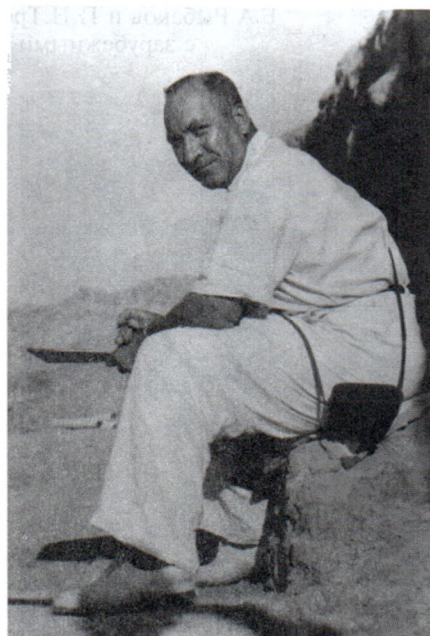
Б.А.Рыбаков с сотрудниками экспедиции на Таманском городище. 1950-е гг.