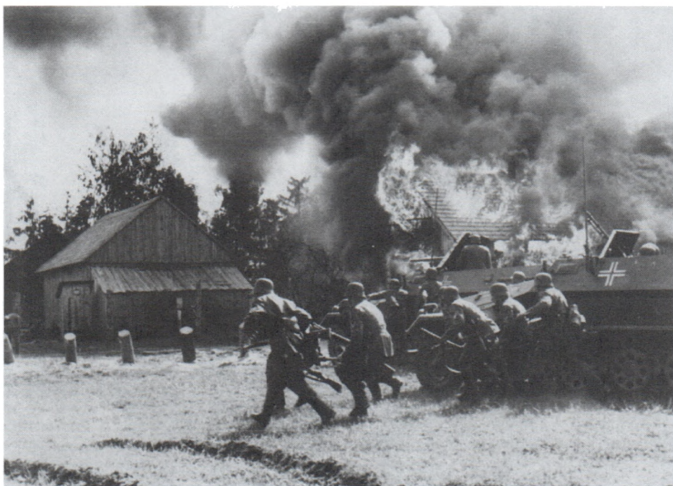
Захват советской деревни. Украина. Июнь 1941 г.