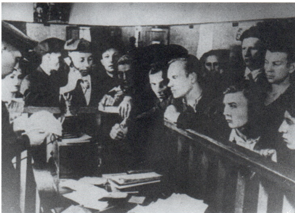
В военкомате в первый день войны. Москва. 22 июня 1941 г.