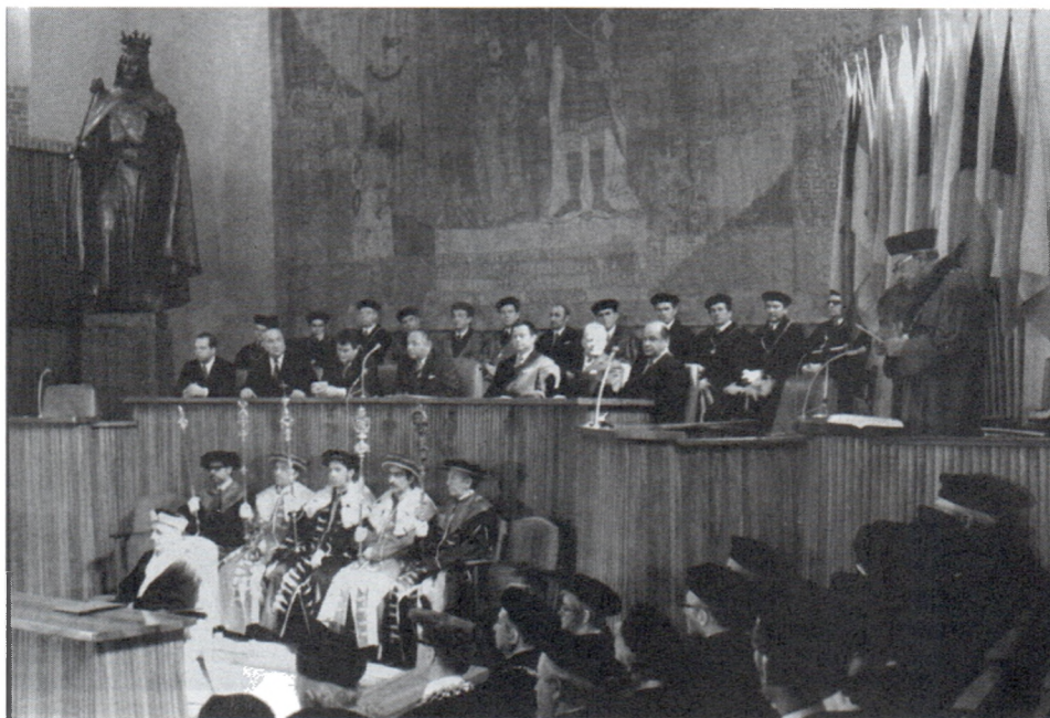
Б.А.Рыбаков (второй слева) на заседании Исполкома Международного общества по доисторическим и раннеисторическим исследованиям. Прага. 1960 г.