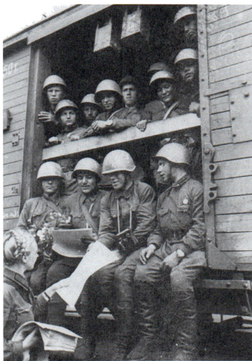
Проводы на фронт. Москва. Июль 1941 г. Авт. Д. Чернов