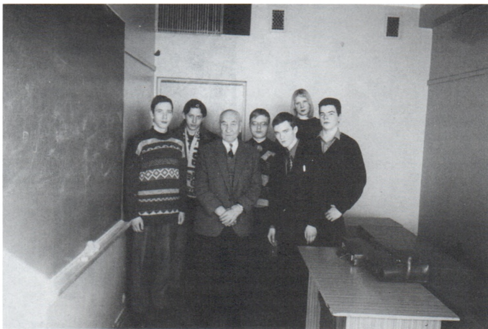
Б.А.Рыбаков с группой студентов истфака МГУ. 1998 г.