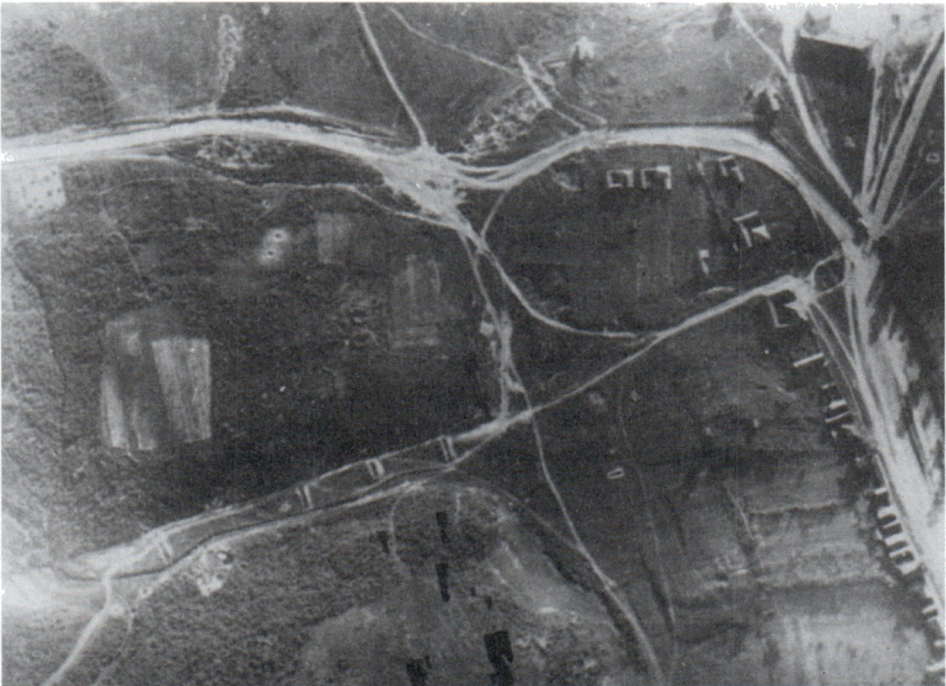
Бомбардировка советской территории. Июнь 1941 г.