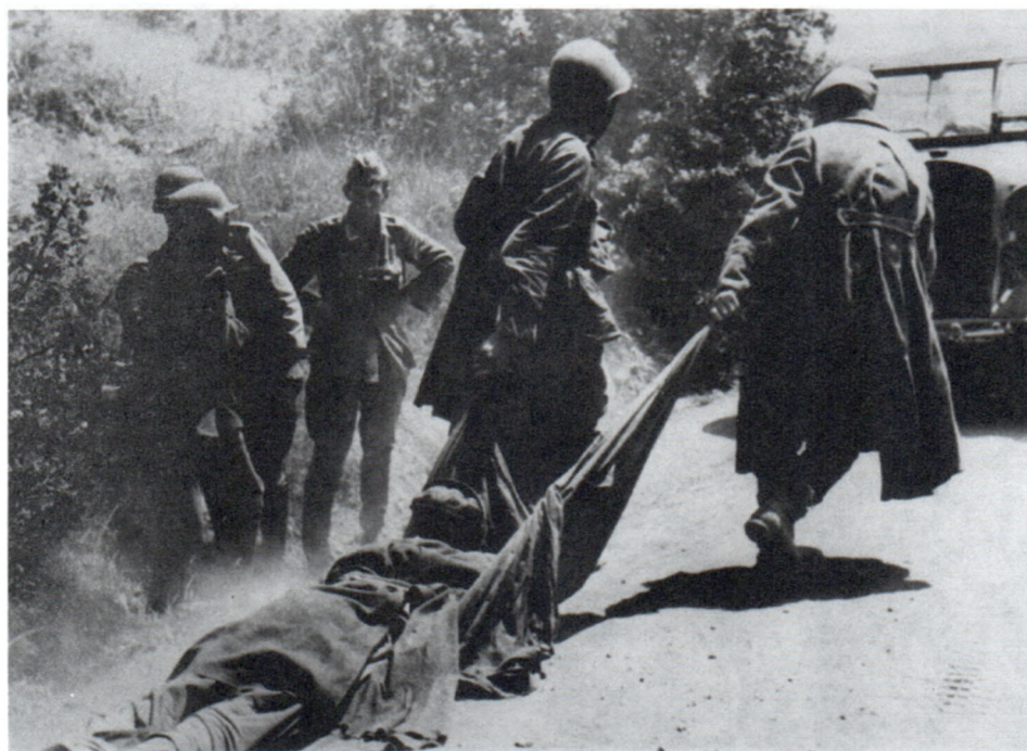
Советские военнопленные. Июнь 1941 г.