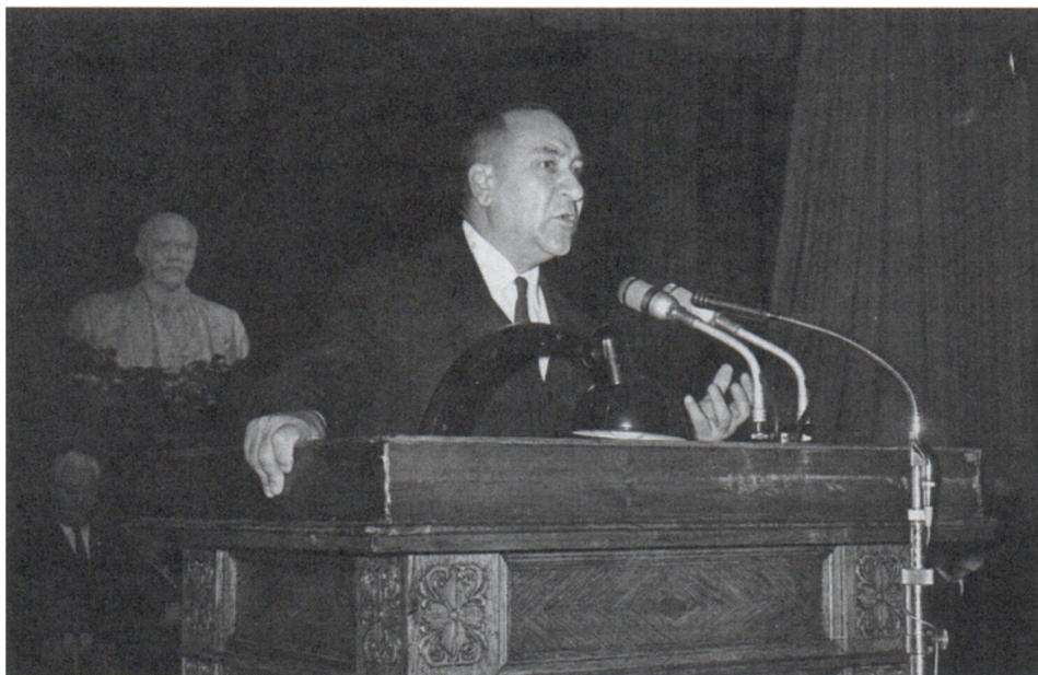
Выступление Б.А.Рыбакова в Институте истории СССР АН СССР. 1971 г.