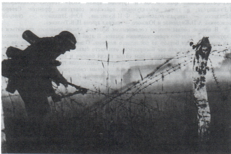
Преодоление линии проволочных заграждений на государственной границе СССР. 22 июня 1941 г.