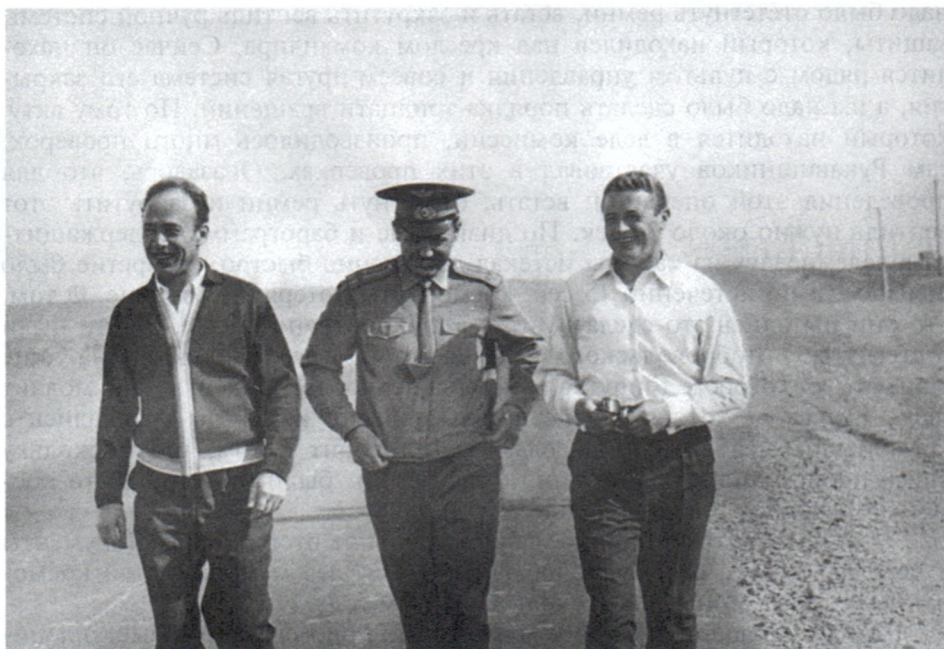
Прогулка по степи в окрестностях космодрома Байконур. Июнь 1971 г.