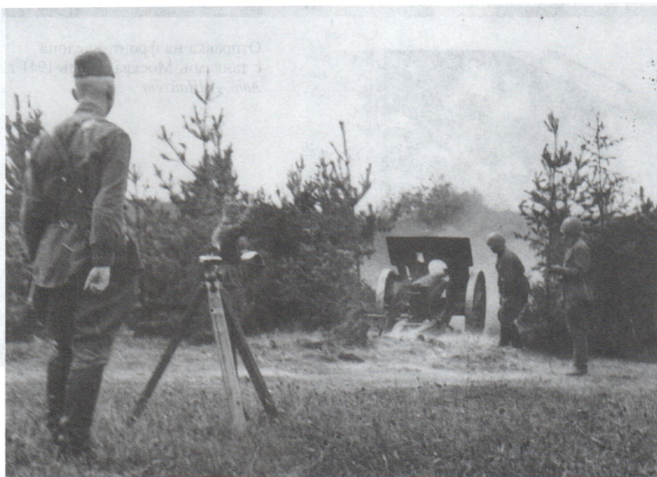
Батарея противотанковых орудий ведет огонь по противнику. Июль 1941 г.