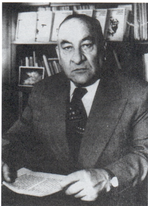
Б.А.Рыбаков в Институте археологии АН СССР. 1987 г.