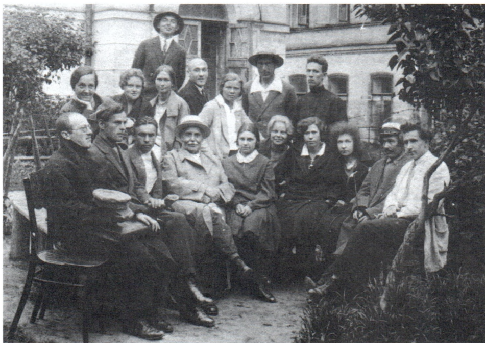
Б.А.Рыбаков (стоит в центре во втором ряду) в группе сотрудников Государственного Исторического музея. Сидит четвертый слева В.А.Городцов. 1930-е гг.