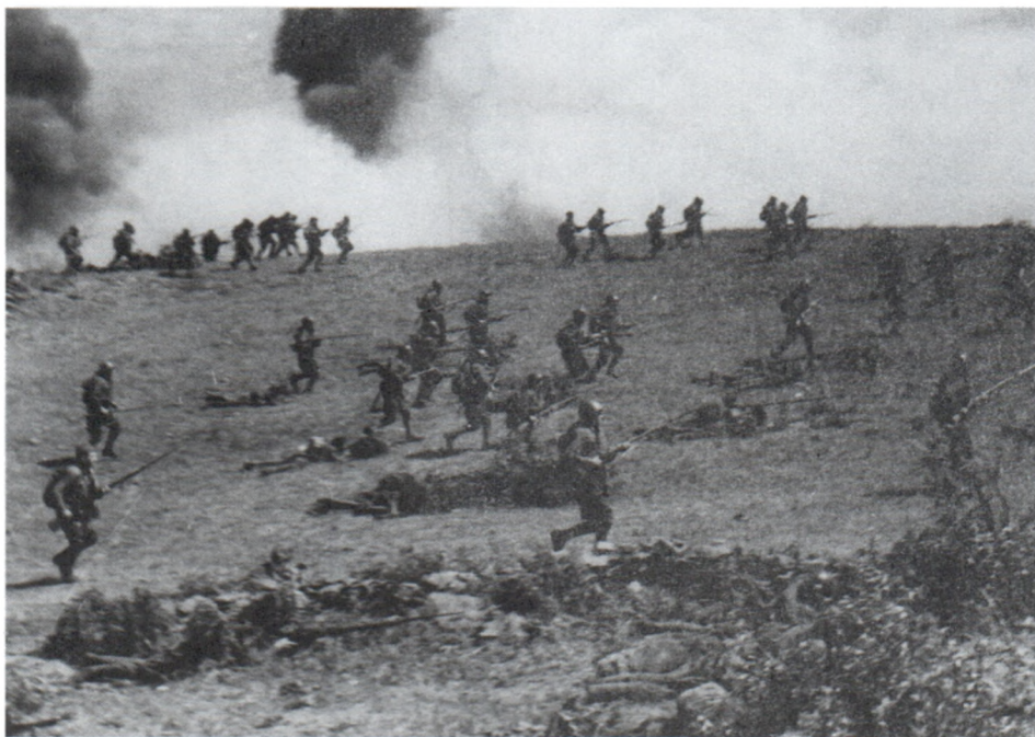
Атака. Южный фронт. Июль 1941 г. Авт. М.Альперт