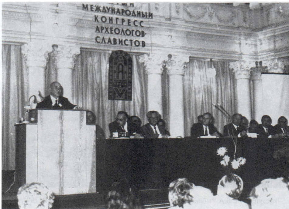
Выступление Б.А.Рыбакова на V Международном конгрессе историков-славистов. Киев. 1985 г.