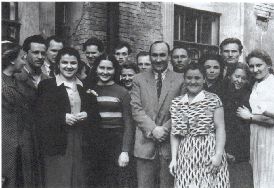
Б.А.Рыбаков с группой студентов истфака МГУ. 1950-е гг.