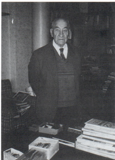
Б.А.Рыбаков. 1998 г.