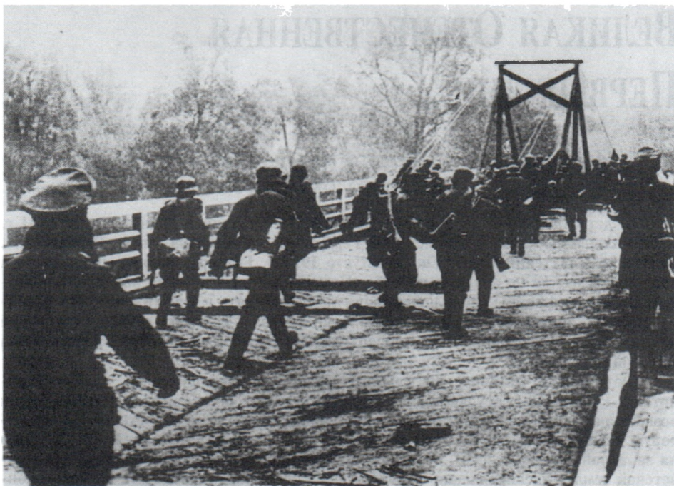
Немецкие войска переходят государственную границу СССР. 22 июня 1941 г.