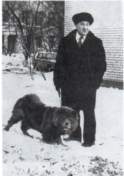
Б.А.Рыбаков. 1990-е гг.