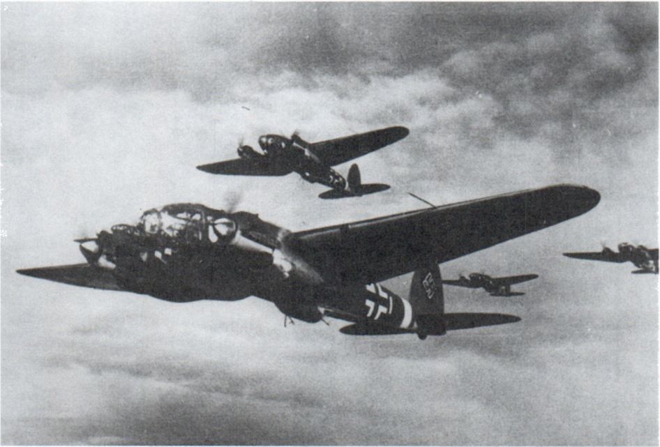
Эскадрилья немецких бомбардировщиков в воздухе. Июнь 1941 г.