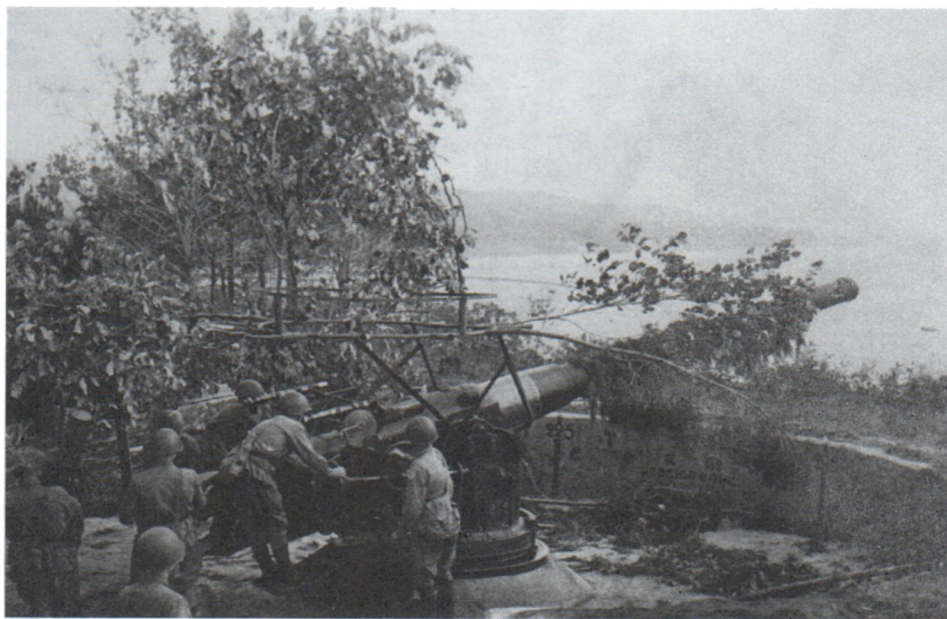
Расчет корабельного орудия «Канэ» на берегу. Балтийский флот. Июль 1941 г.