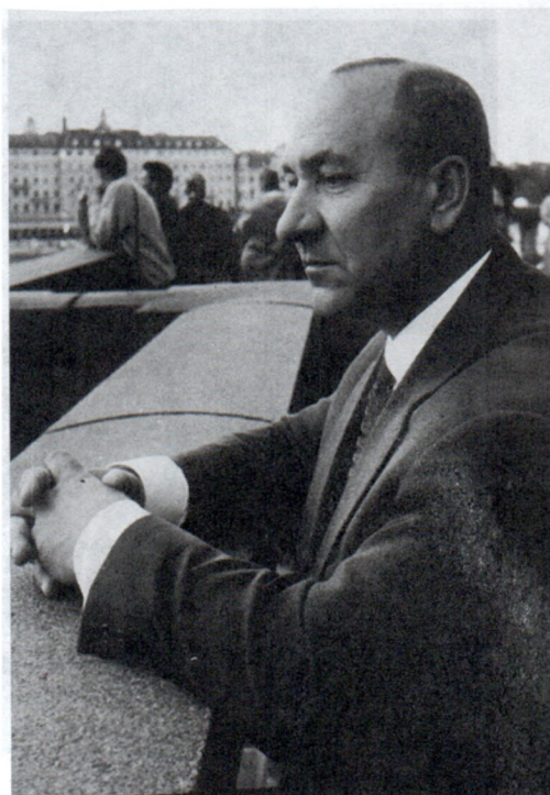
Б.А.Рыбаков во Флоренции. 1970-е гг.