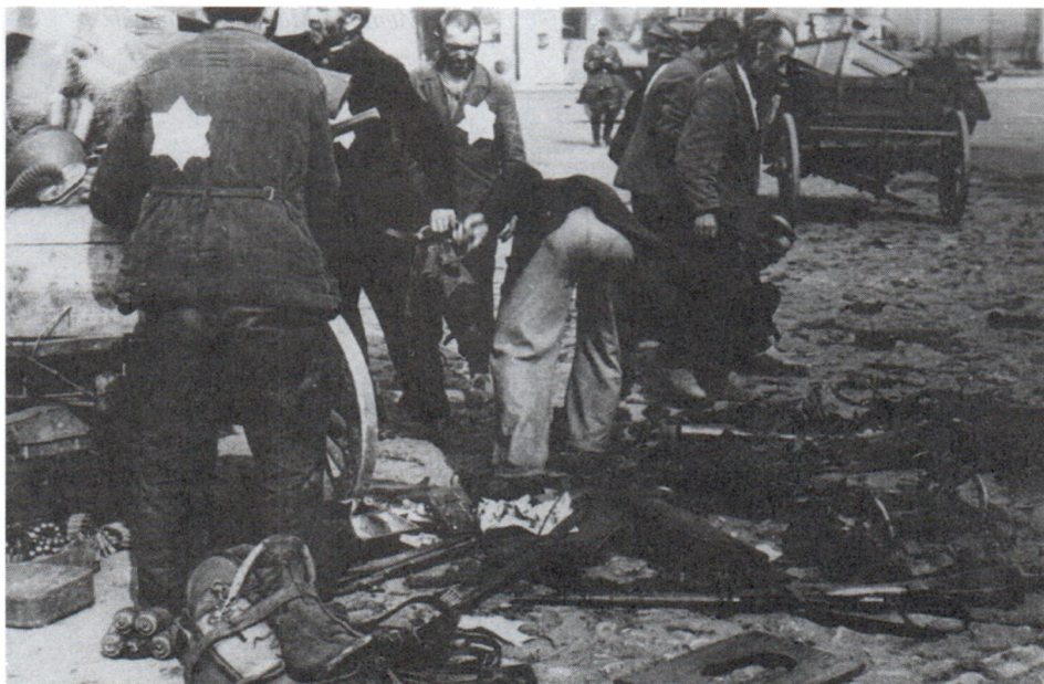
Еврейское население г. Могилева на принудительных работах по расчистке города. Лето 1941 г.