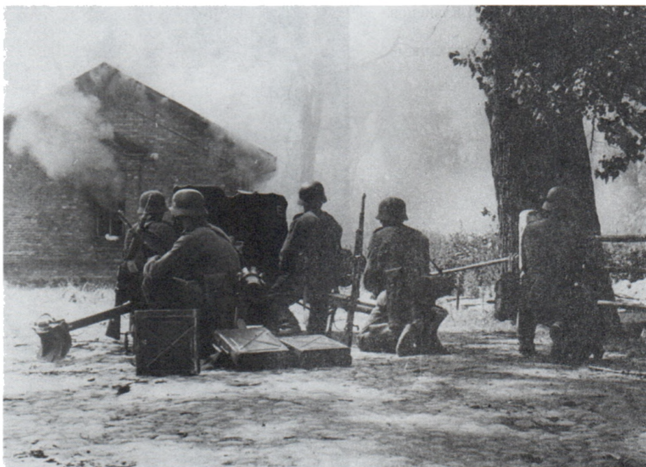
Расчет немецкого противотанкового орудия. Район Бреста. Июнь 1941 г.