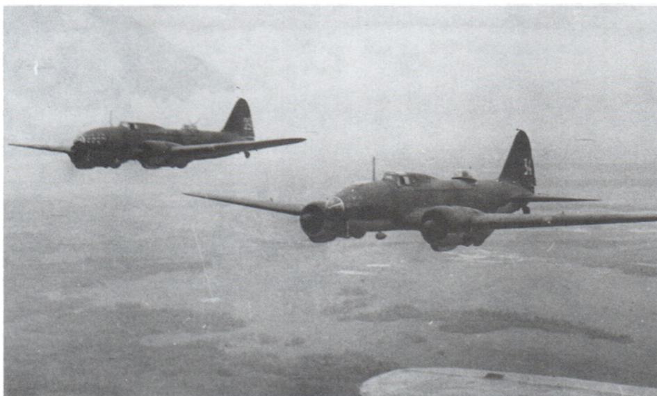
Советские бомбардировщики в небе. Лето 1941 г. Авт. Д.Чернов