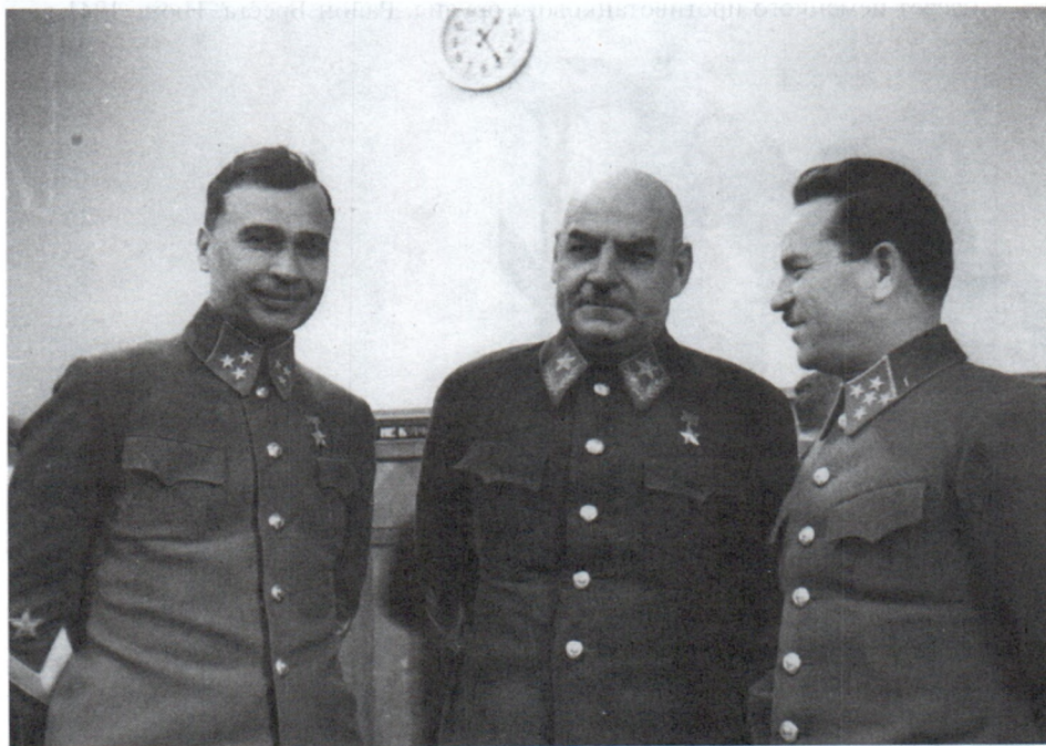
Генерал-полковник М.И.Кирпонос, Маршал Советского Союза Г.И.Кулик и генерал армии И.В.Тюленев. 1941 г. Авт. Ф.Кислов