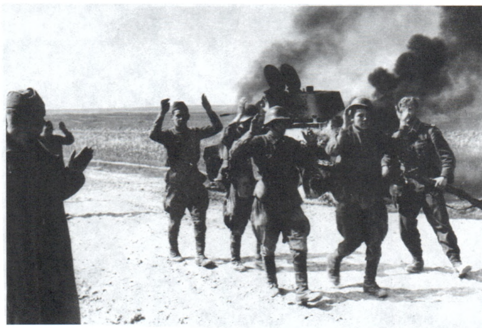
Экипаж советского танка, захваченный в плен. Июнь 1941 г.