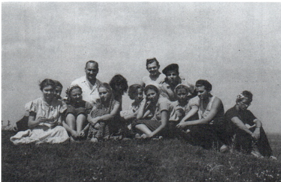
Б.А.Рыбаков с сотрудниками экспедиции в Любече. 1959 г.