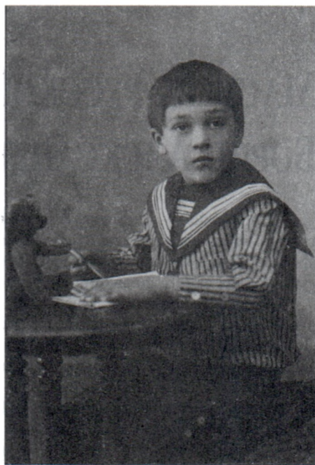
Борис Рыбаков. 1914 г.