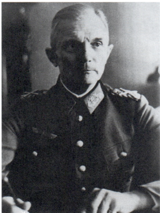
Командующий группой армий «Центр» генерал-фельдмаршал фон Ф.Бок. 1941 г.