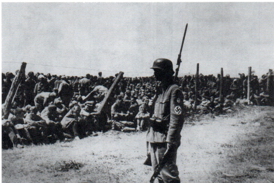
Лагерь советских военнопленных, попавших в окружение под Уманью. Лето 1941 г.