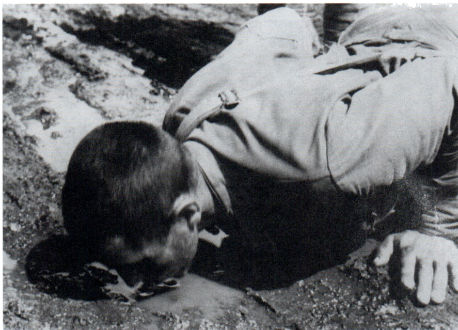
Пленный советский солдат. Лето 1941 г.