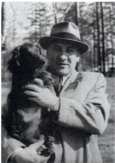
Б.А.Рыбаков. 1950-е гг.