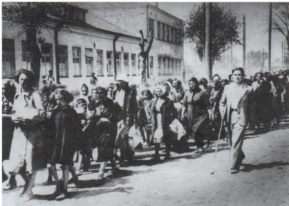
Колонна женщин-евреек конвоируется в гетто. Литва. Июнь 1941 г.