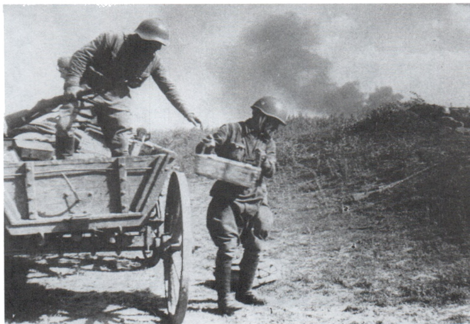
Разгрузка боеприпасов на передовой. Июль 1941 г.