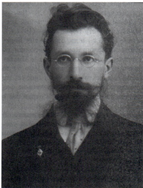
А.С.Рыбаков. 1920-е гг.