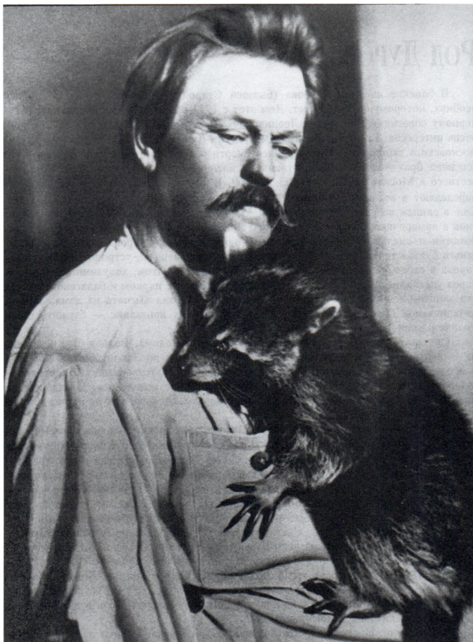
В.Л.Дуров. 1927 г.