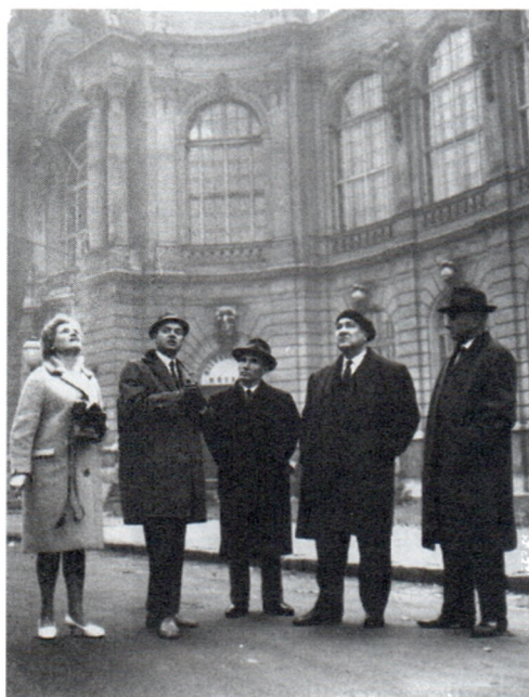
Б.А.Рыбаков с делегацией Общества советско-венгерской дружбы. Будапешт. 1965 г.