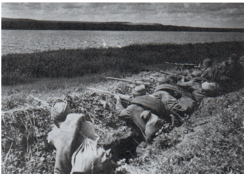
Линия обороны реки Дон. Лето 1941 г. Авт. С.Струнников