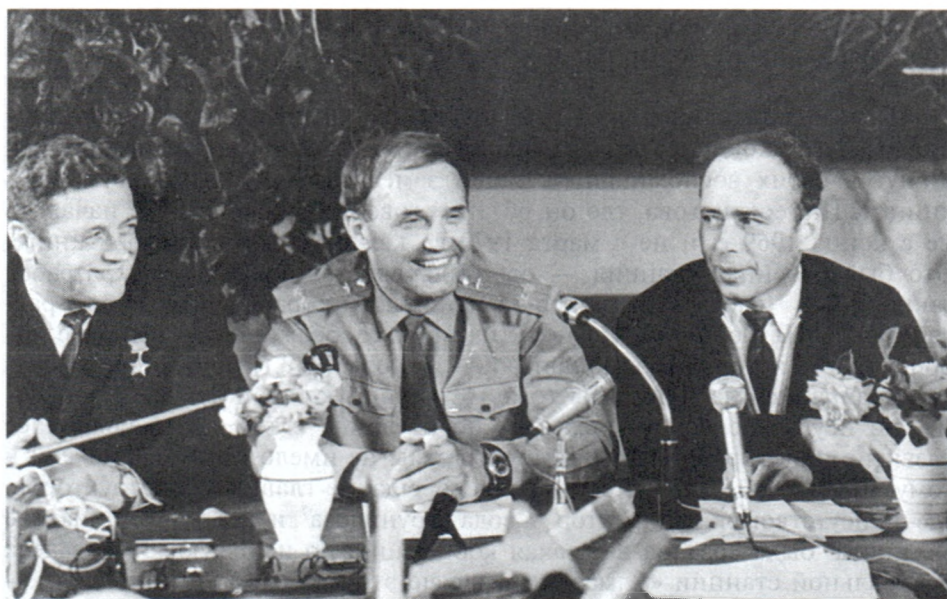
В.Н.Волков, Г.Т.Добровольский, В.И.Пацаев отвечают на вопросы журналистов. Байконур. Июнь 1971 г.