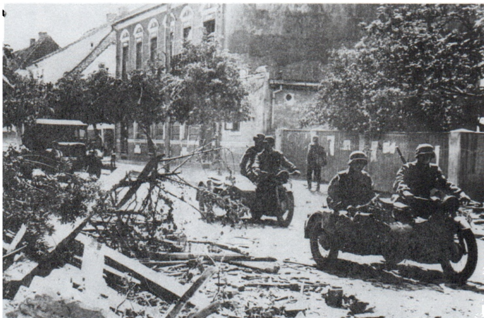
Немецкая мотопехота в одном из занятых городов Литвы. Июнь 1941 г.