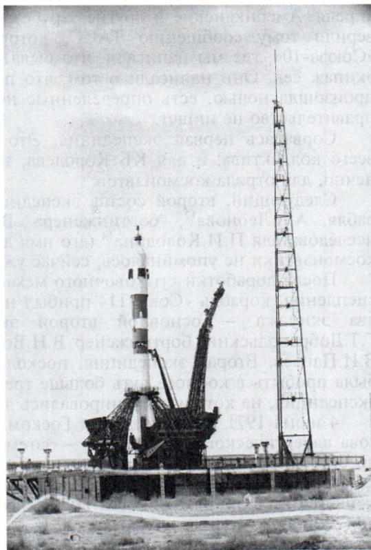
Ракета-носитель с КК «Союз-11» перед стартом. Байконур. Июнь 1971 г.