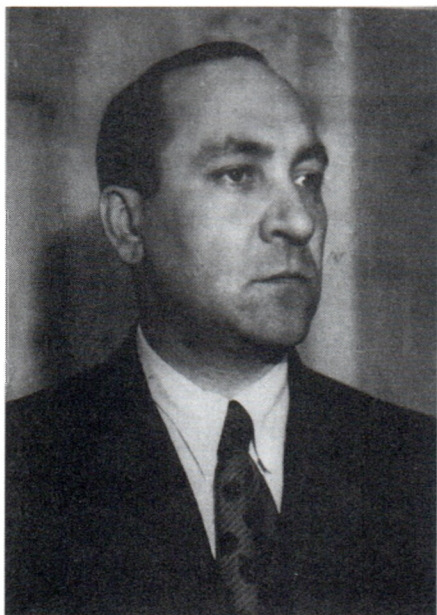
Б.А.Рыбаков. 1940 г.