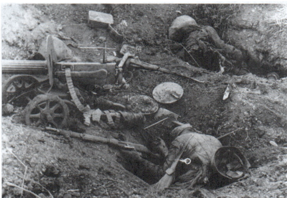
Советская позиция после боя. Июнь 1941 г.