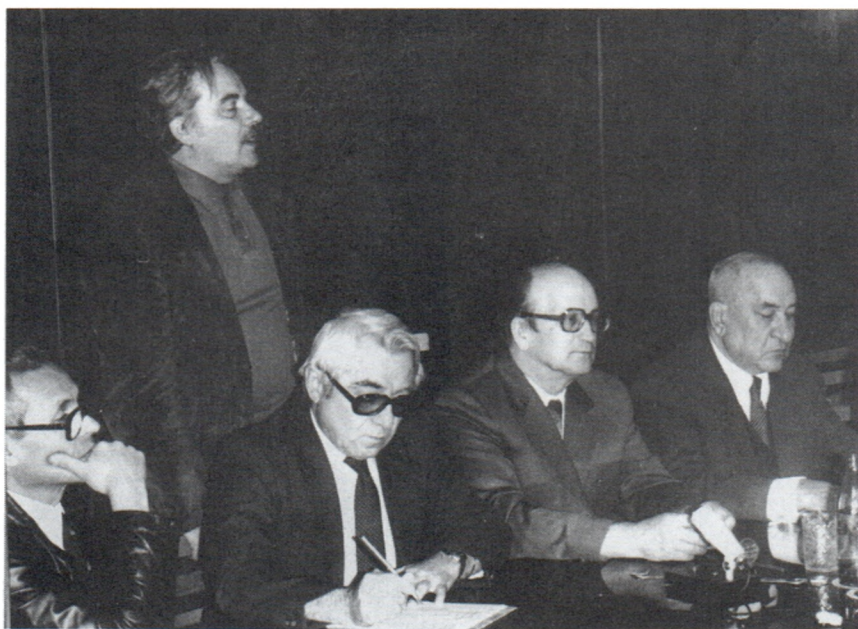
Б.А.Рыбаков на заседании Ученого совета Института археологии АН СССР. Слева направо: Н.Я.Мерперт, Г.А.Кошеленко, Р.М.Мунчаев, Б.А.Колчин. 1970-е гг.