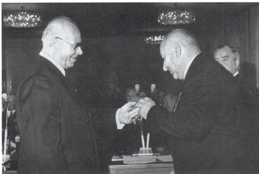
Председатель Президиума Верховного Совета СССР Н.В.Подгорный вручает Б.А.Рыбакову орден Ленина. 1968 г.