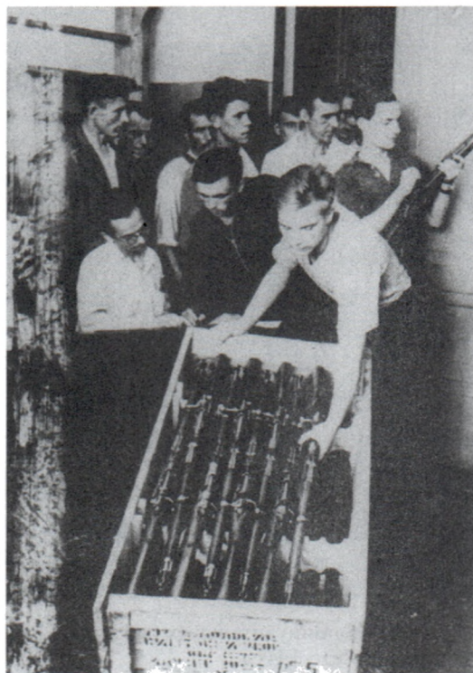
Выдача стрелкового оружия в истребительном батальоне. Украина. Июль 1941 г.