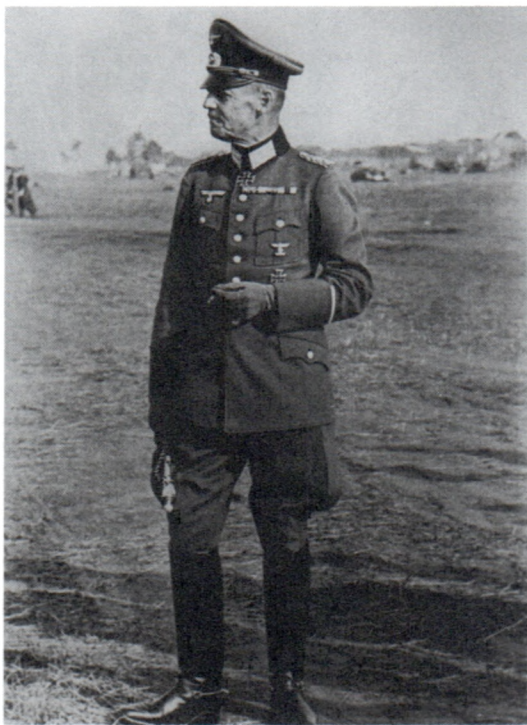
Командующий группой армий «Юг» генерал-фельдмаршал Г.Рундштедт. 1941 г.