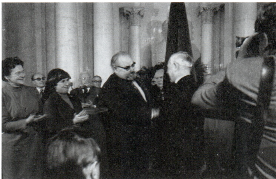
На церемонии награждения журнала «Вопросы истории» орденом Трудового Красного Знамени. 1976 г.