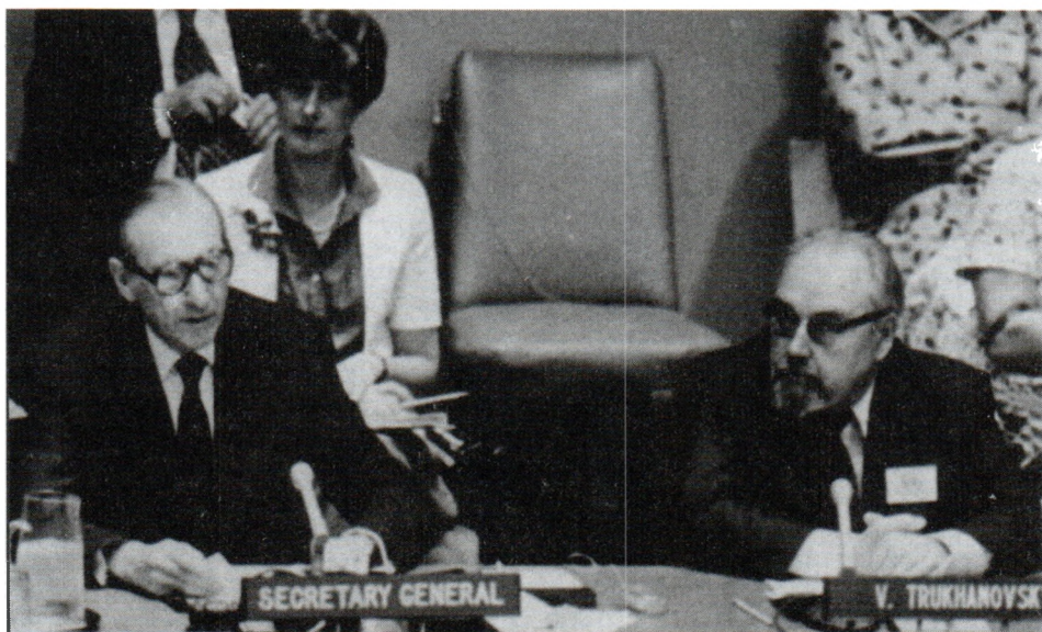
С Генеральным секретарем ООН К.Вальдхаймом. 1975 г.