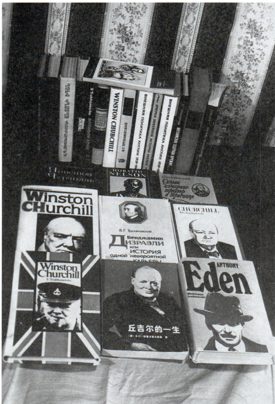
Книги В.Г.Трухановского, изданные в нашей стране и за рубежом