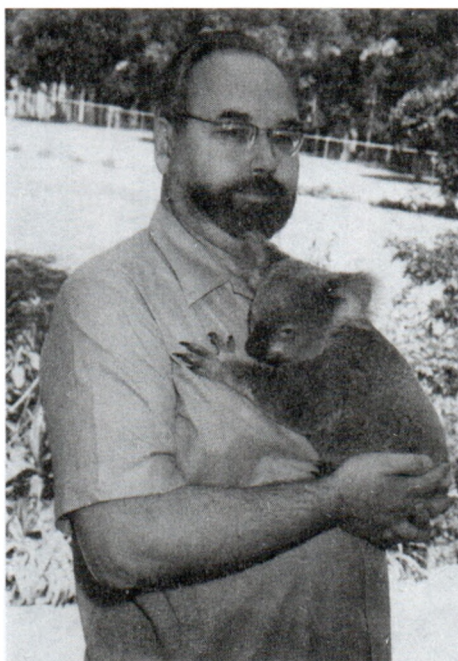
В Австралии. 1970 г.