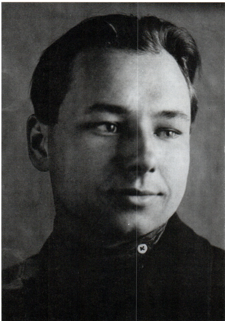
В.Г.Трухановский. 1935 г.