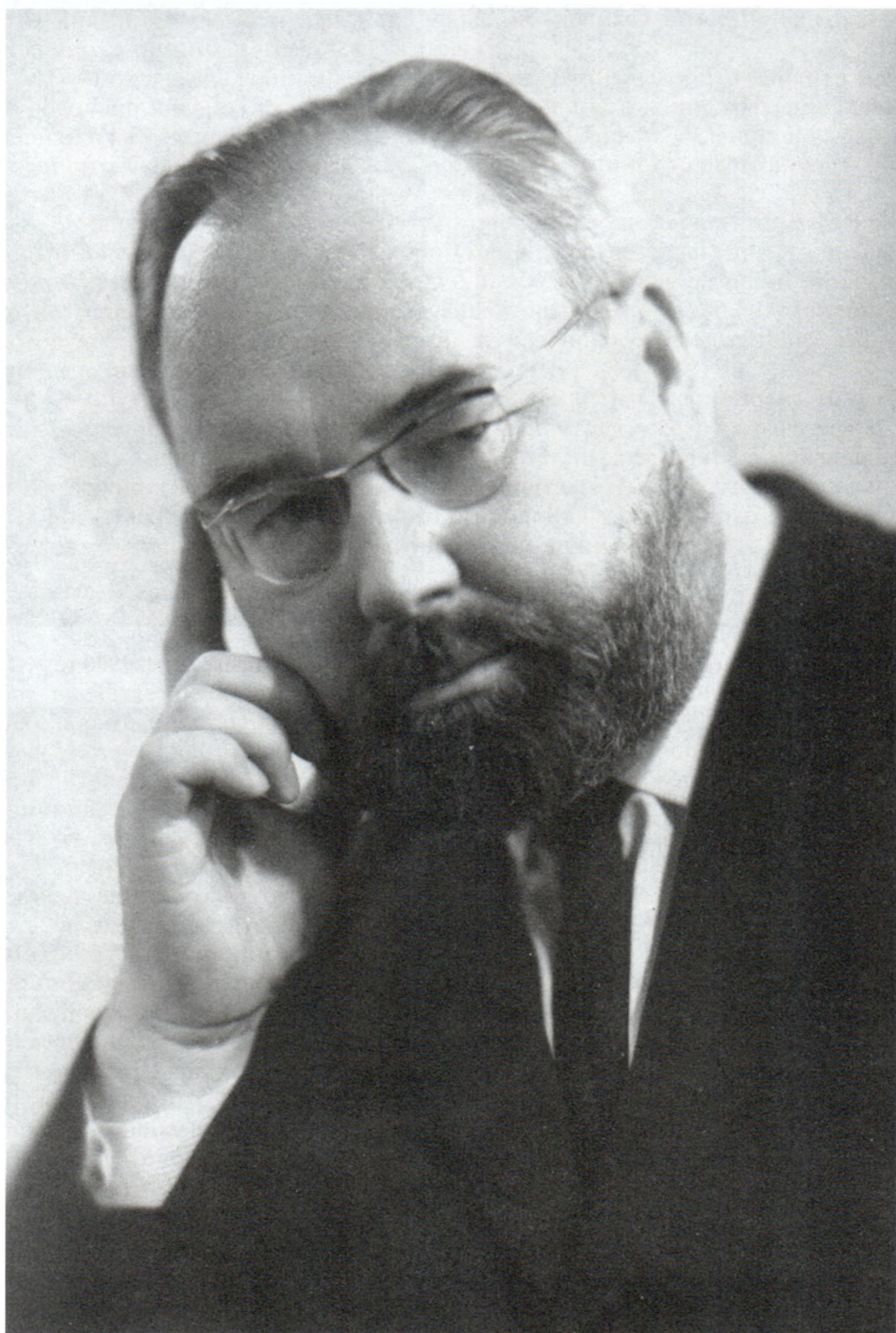
В.Г.Трухановский. 1973 г.