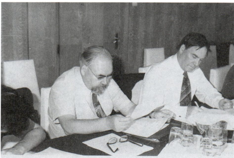
С С.П.Капицей. Варна. 1978 г.