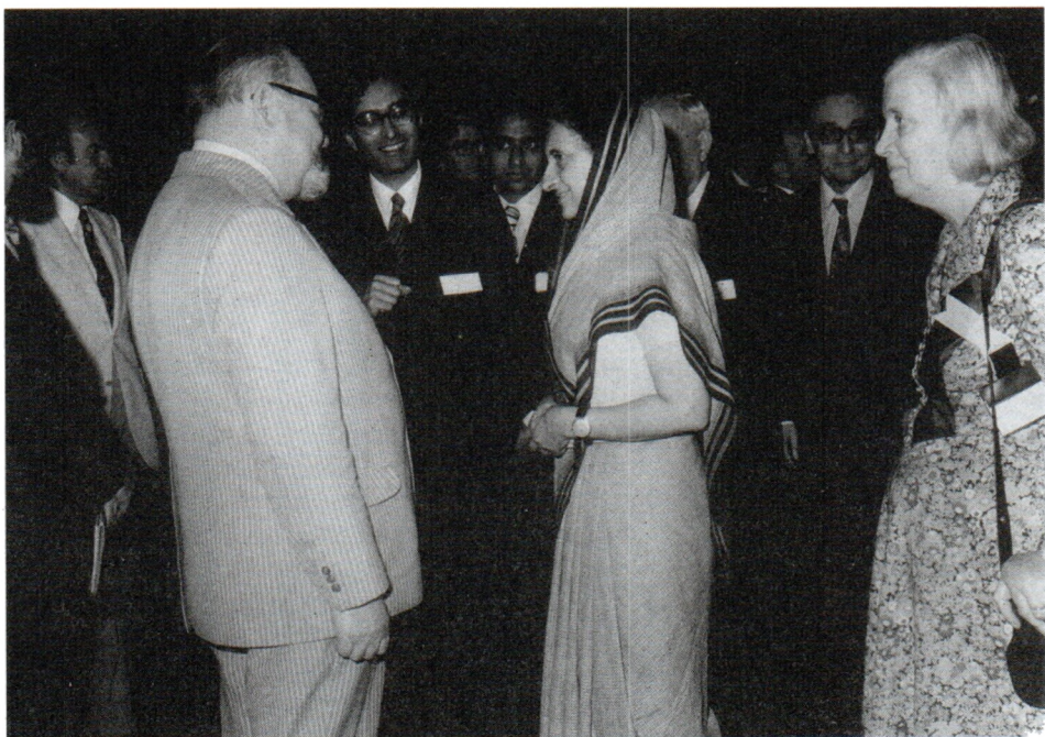
С премьер-министром Индии И.Ганди и президентом Пагуошского движения ученых Д.Ходжкин. 1977 г.