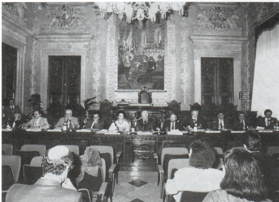
На международной научной конференции в Италии. 1987 г.