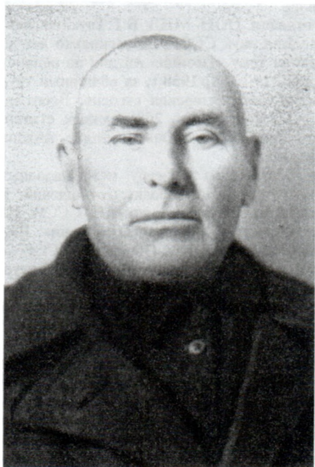
Григорий Ипполитович Трухановский. 1934 г.