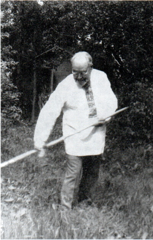
На даче. 1984 г.