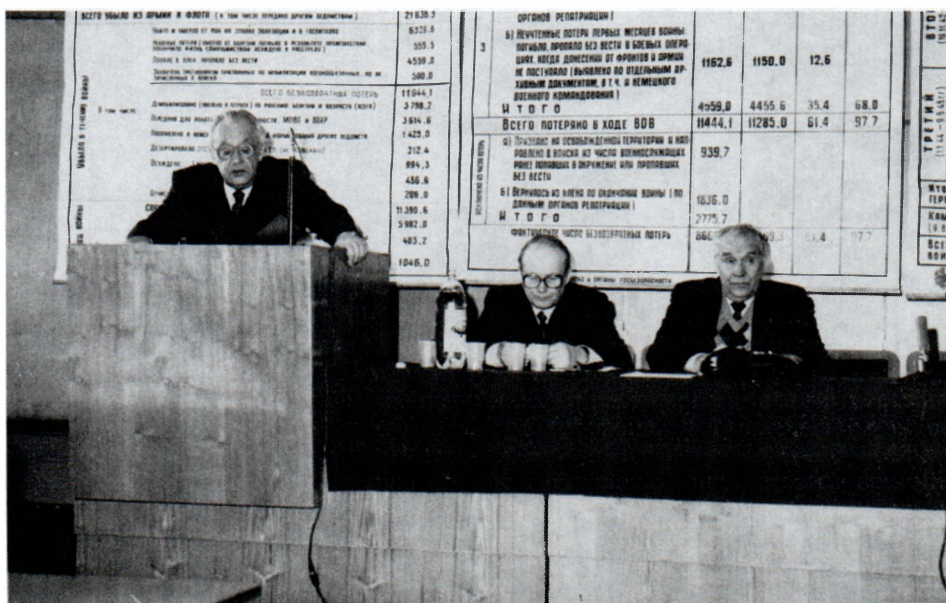
На конференции, посвященной 50-летию Победы над фашистской Германией. Москва. 1995 г.