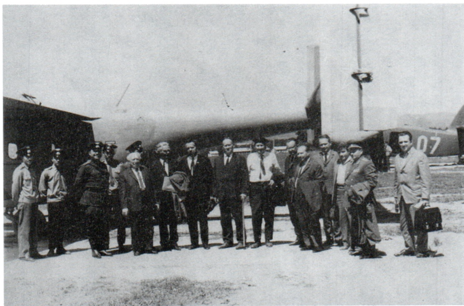
В гостях у авиаторов-пограничников. Район оз. Ханка. 1970 г.