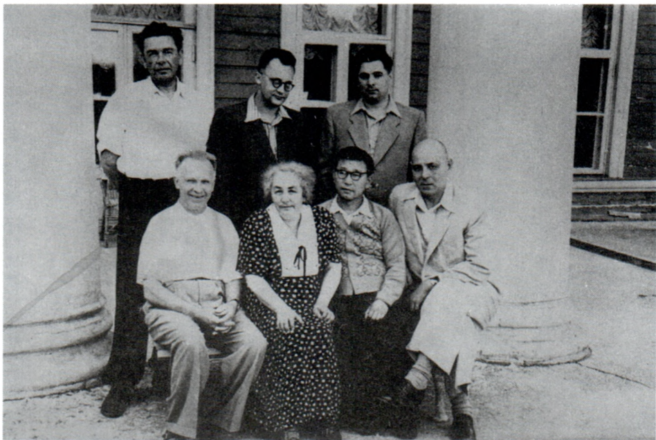
Авторский коллектив первого вузовского учебника по истории советского общества. Узкое. 1956 г.