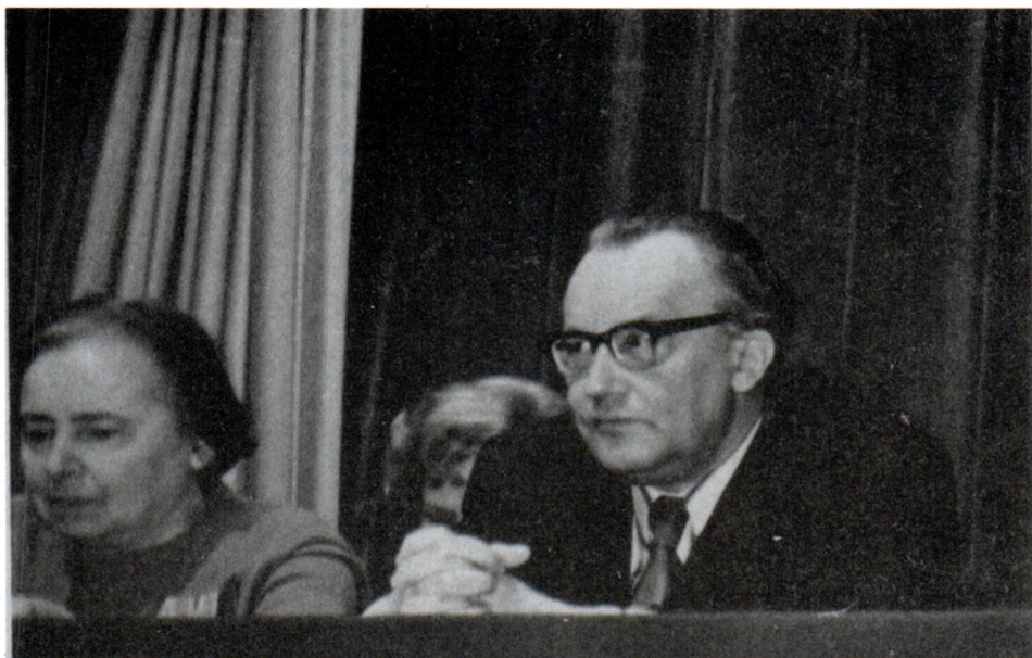
На конференции в Доме ученых. Слева М.В.Нечкина. Москва. 1974 г.