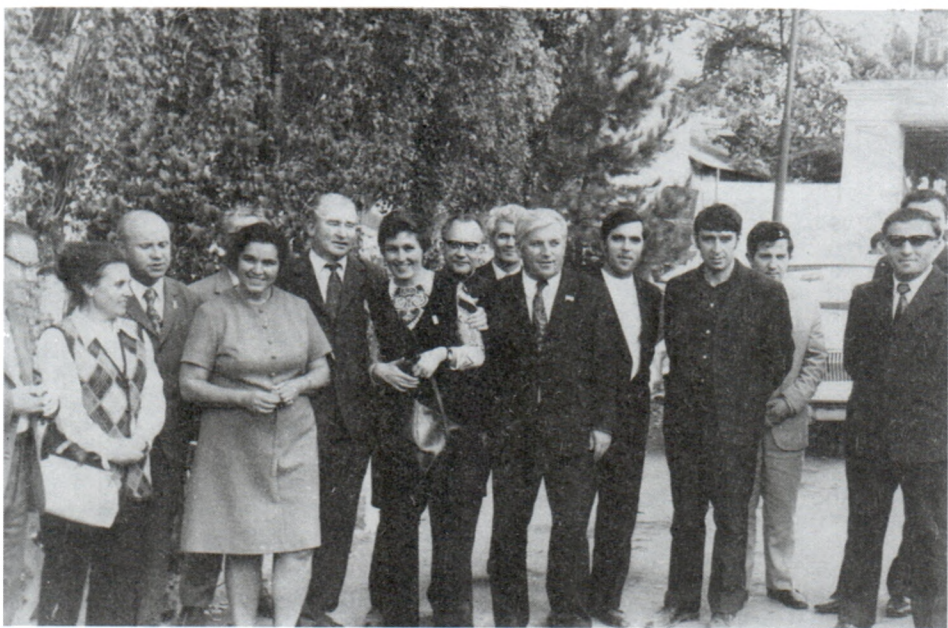
С группой историков в Дербенте. 1974 г.