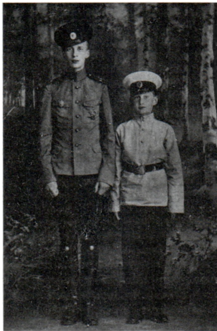
Князь Олег Константинович (слева) в день производства в офицеры. 1913 г.