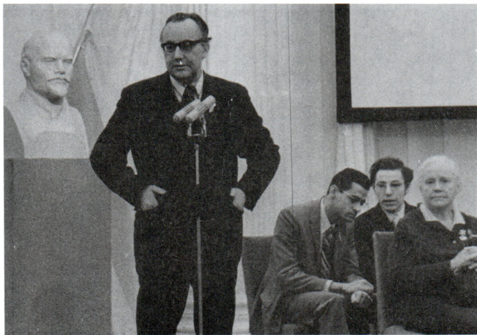
Выступление в Доме дружбы. Москва. 1974 г.