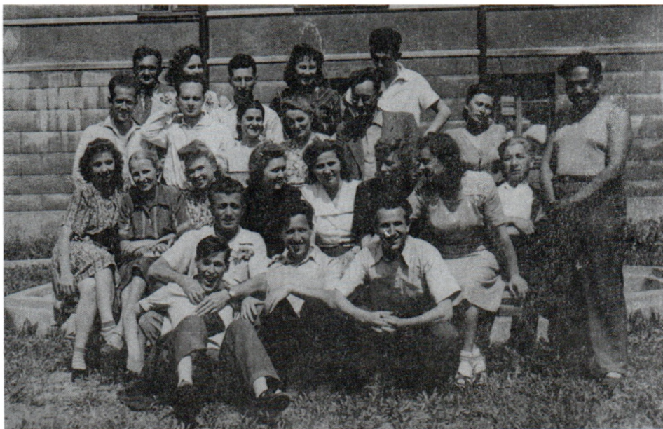
В группе деятелей международного молодежного движения. Москва. 1947 г.