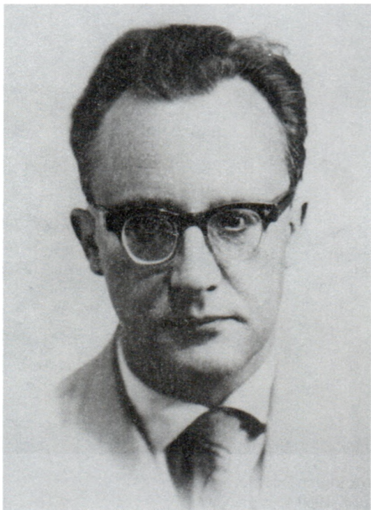
Ю.А.Поляков. Москва. 1966 г.