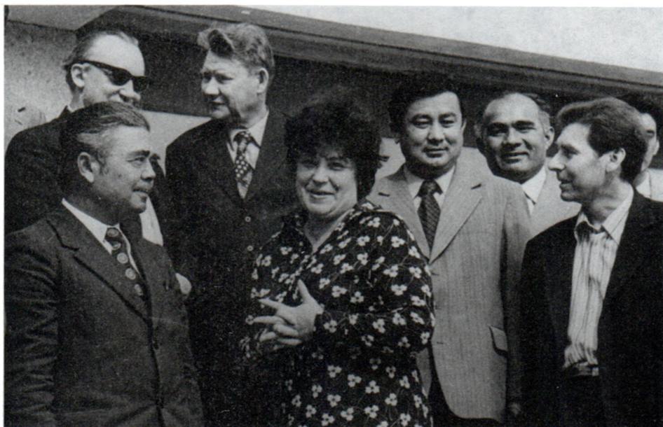
На конференции в Андижане. Третий слева А.П.Окладников. 1975 г.