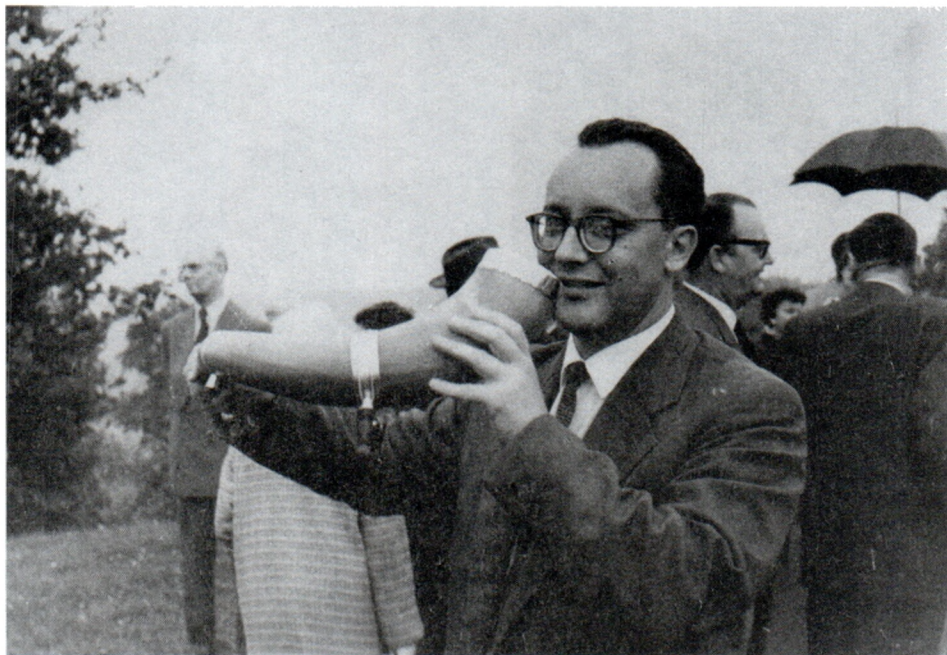
На XI Международном конгрессе историков. Стокгольм. 1960 г.