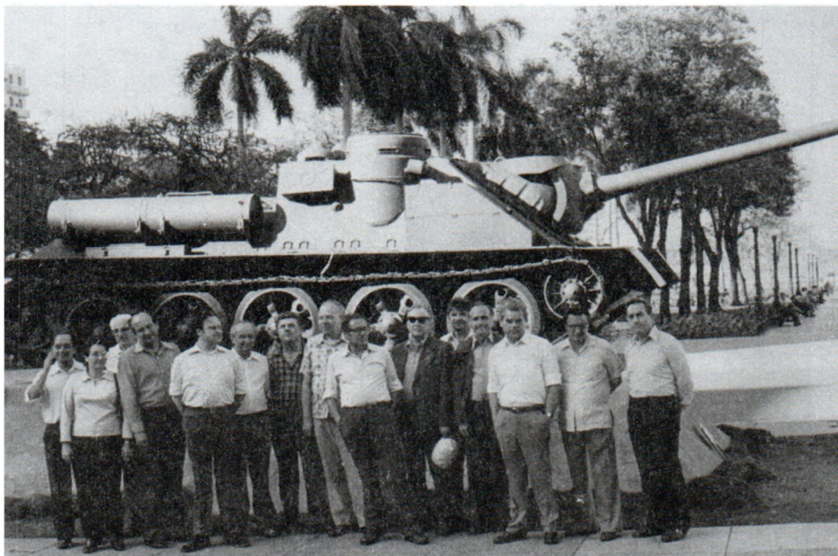
Участники совещания историков на площади Гаваны (Куба). 1981 г.