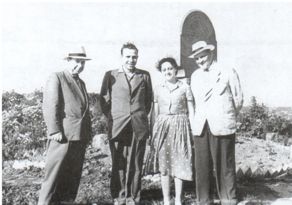
С коллегами-историками. Шлиссельбург. Июнь 1959 г.