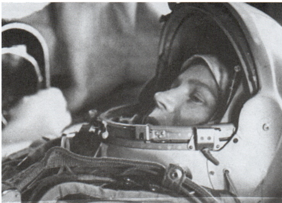
В кабине КК «Восток-6». Июнь 1963 г. Арх. № 09669 цв.