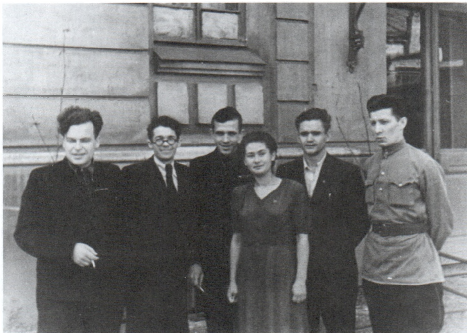
Среди однокурсников. Сентябрь 1950 г.