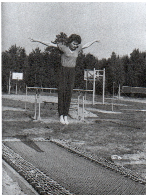
Во время тренировки на батуте. Звездный городок. 1963 г. Арх. № 04697