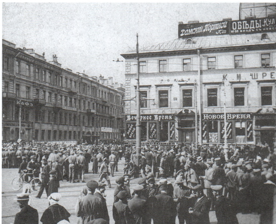
Дом редакции «Нового времени», откуда стреляли по демонстрантам. Июль 1917 г. И.С.Кобозев