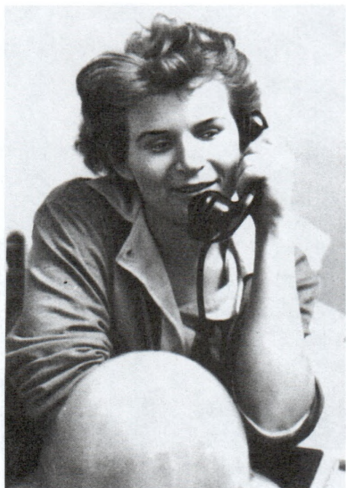
Во время разговора по телефону после завершения полета на КК «Восток-6». 19 июня 1963 г. Арх. № 111205