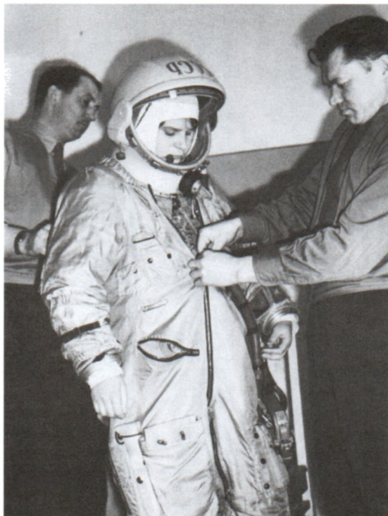
Во время примерки скафандра. Звездный городок. 1963 г. Арх. № 04721