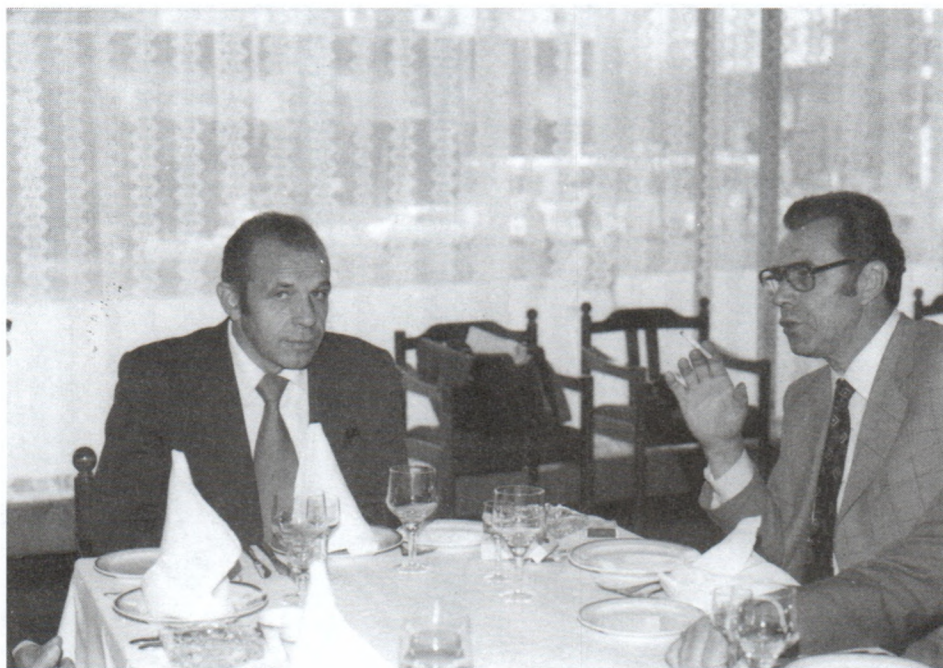
Во время советско-итальянского коллоквиума. Москва. 1977 г.