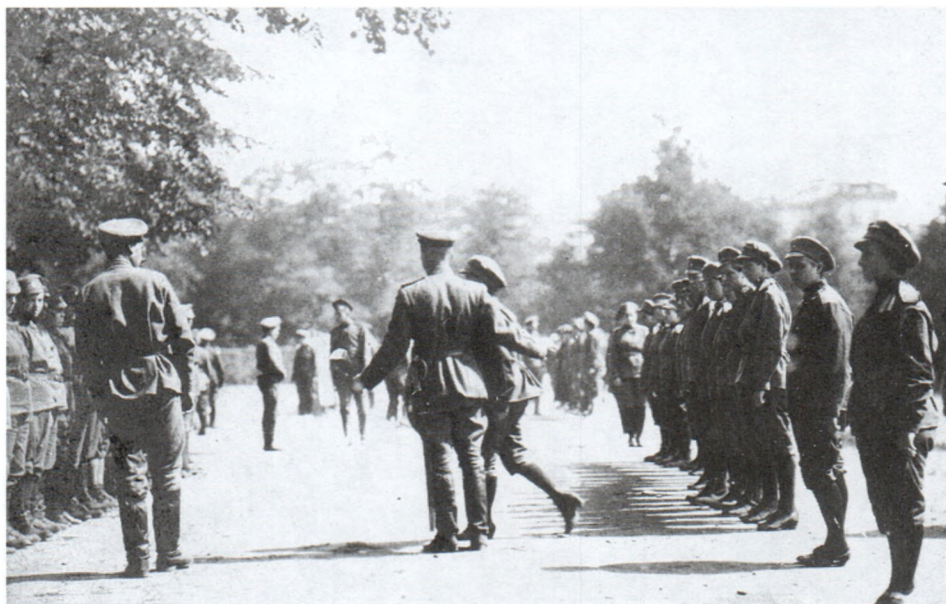
Обучение ударного женского батальона. Июнь 1917 г. И.С.Кобозев