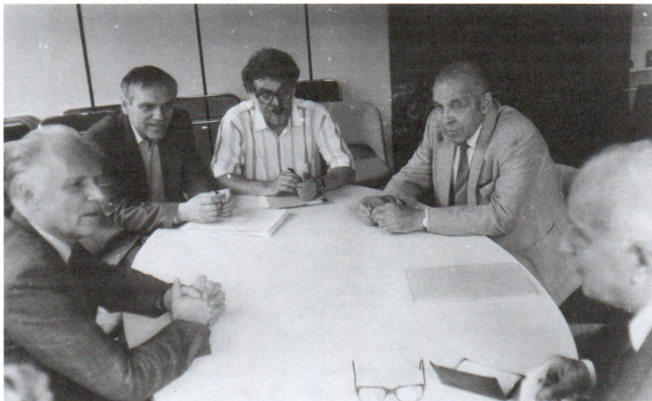
В Доме науки о человеке. Париж. 1991 г.