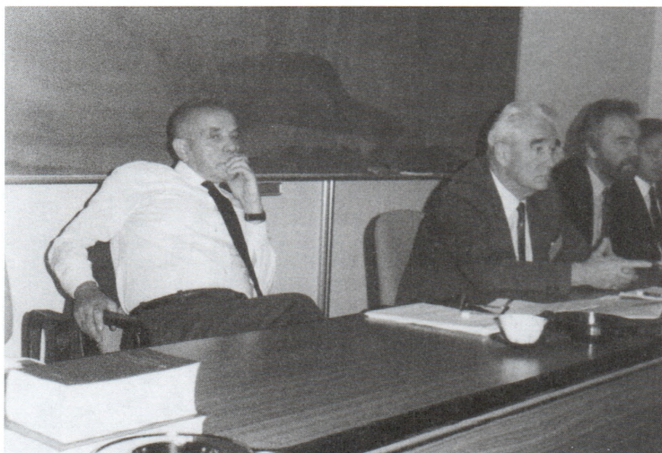
На советско-японском симпозиуме. Токио. 1989 г.