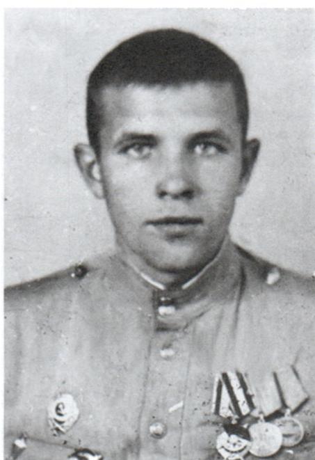
И.Д.Ковальченко. 1945 г.