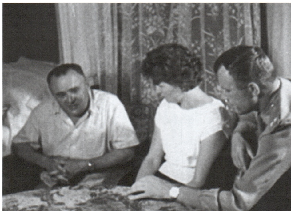
С Ю.А.Гагариним и С.П.Королевым в гостинице космодрома Байконур. Июнь 1963 г. Арх. № 0683 цв.