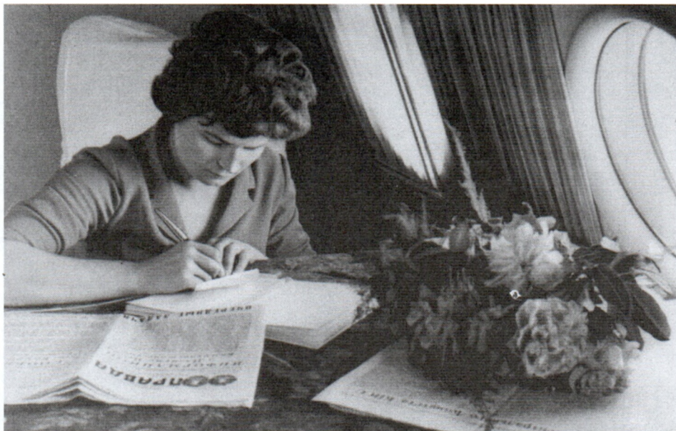
В салоне самолета во время перелета из района приземления в Куйбышев после завершения полета на КК «Восток-6». 20 июня 1963 г. Арх. № 111202