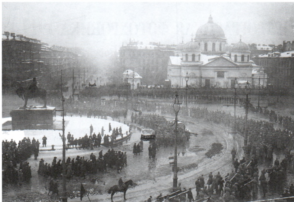
Похороны жертв революции. 23 марта 1917 г.