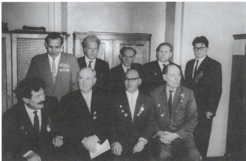
С ветеранами Великой Отечественной войны. Истфак МГУ. 9 мая 1965 г.