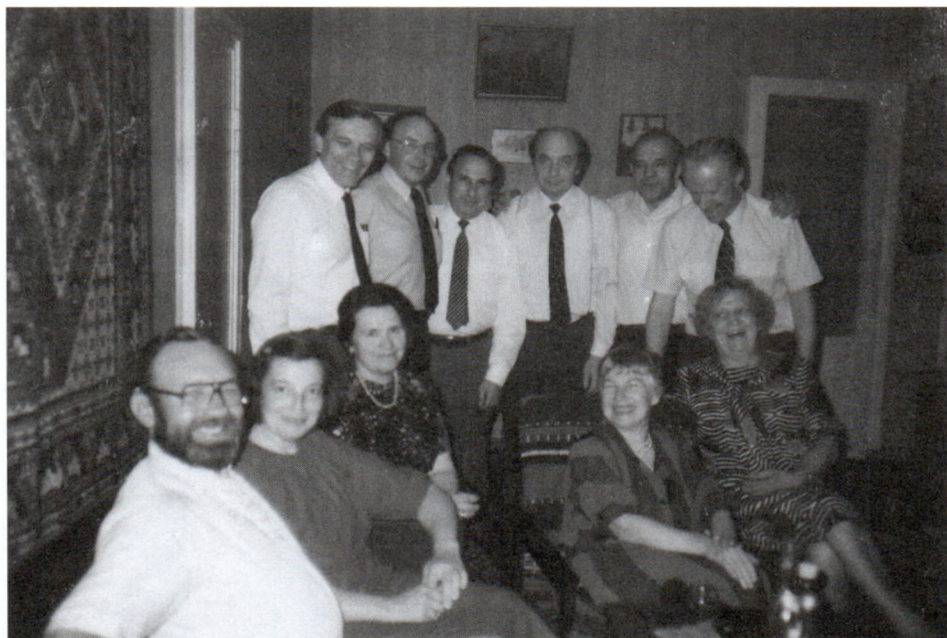
Среди друзей. 1990-е гг.