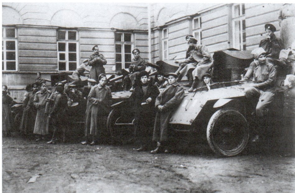
Броневики у Смольного. 25 октября (7 ноября н. ст.) 1917 г. И.С.Кобозев