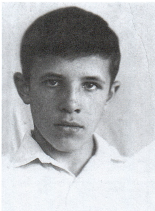
Иван Ковальченко. 1936 г.