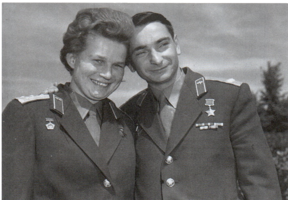
С В.Ф.Быковским. Звездный городок. Июнь 1963 г. Арх. № 11082 цв.