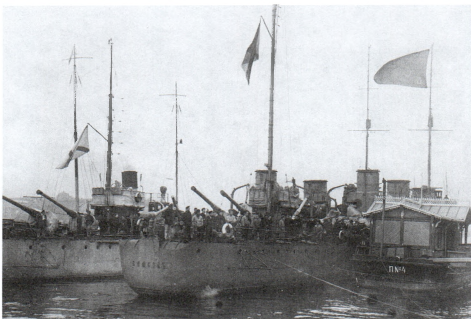
«Самсон» и «Забияка» на Неве. 26 октября (8 ноября н. ст.) 1917 г. И.С.Кобозев