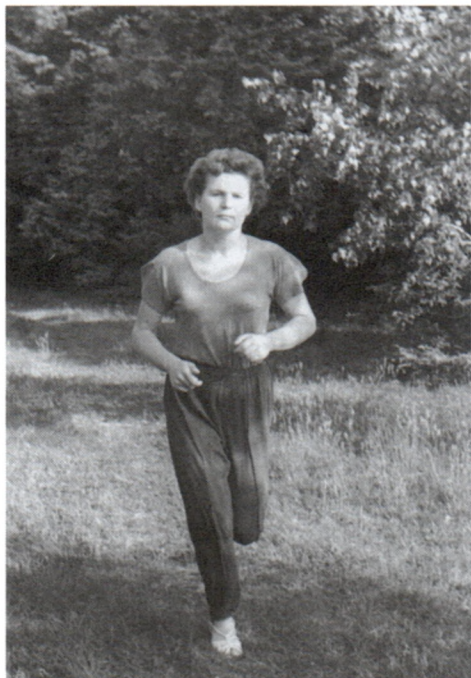
Во время занятий легкой атлетикой. Звездный городок. 1963 г. Арх. № 04696