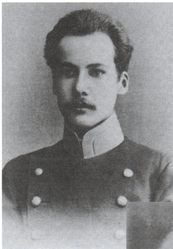
А.Белый. 1903 г.