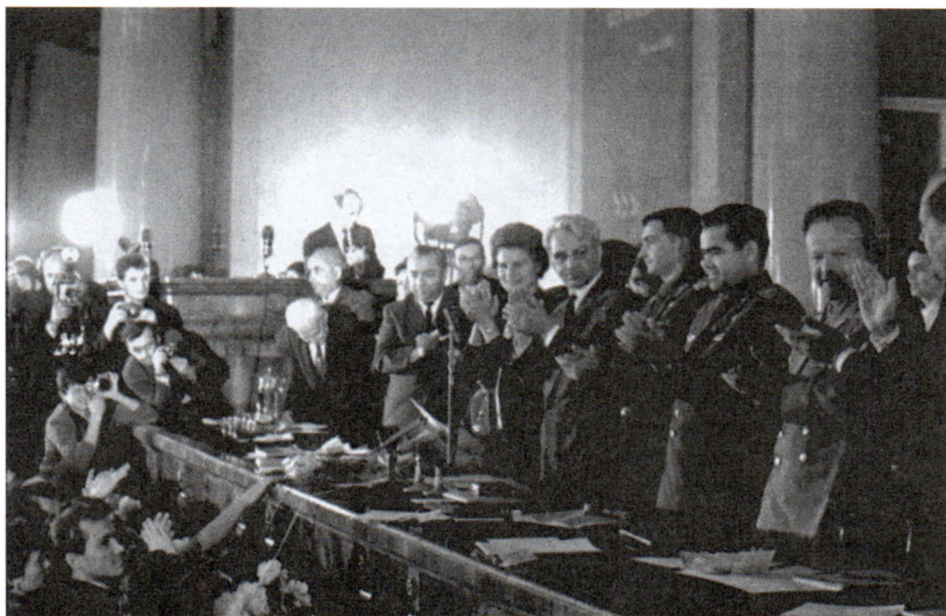
Президиум пресс-конференции, посвященной успешному завершению совместного полета КК «Восток-5» и «Восток-6». Москва. 25 июня 1963 г. Арх. № 02225