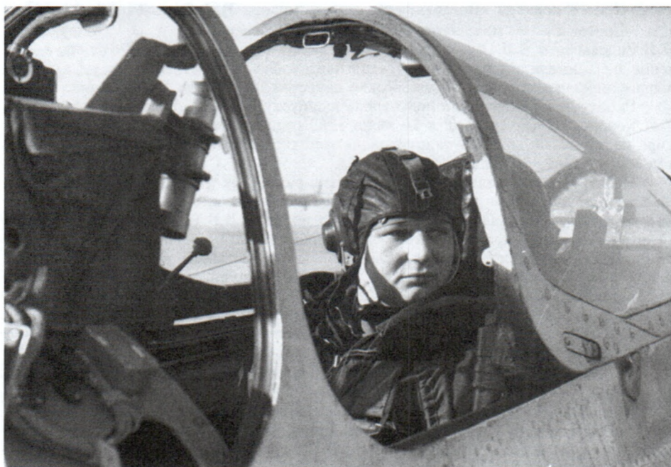
В кабине самолета во время летной подготовки. 1963 г. Арх. № 04688