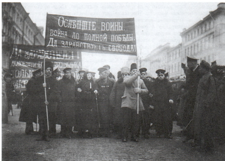
Манифестация инвалидов войны к Государственной Думе. 16 апреля 1917 г. Я.В.Штейнберг