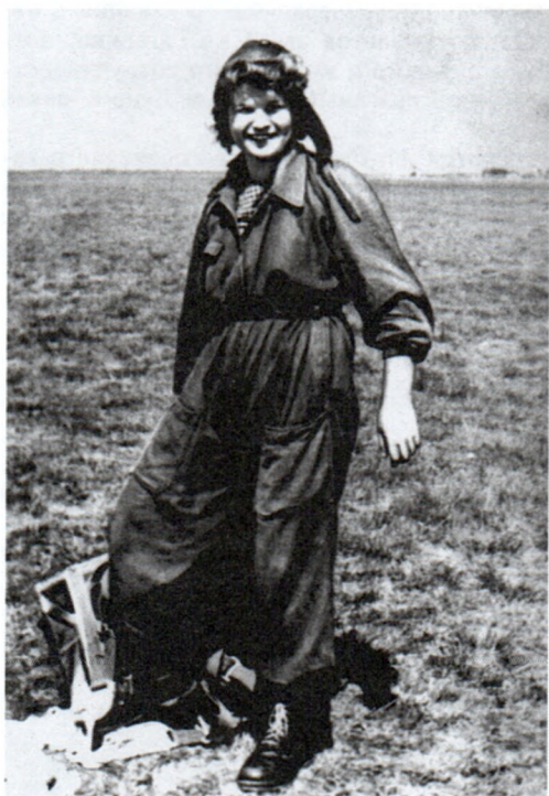
Во время парашютной подготовки. Звездный городок. 1963 г. Арх. № 11182