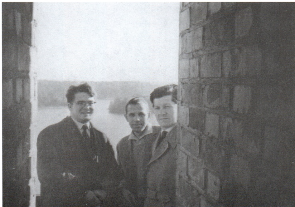
С коллегами-историками. Тракай. 1963 г.