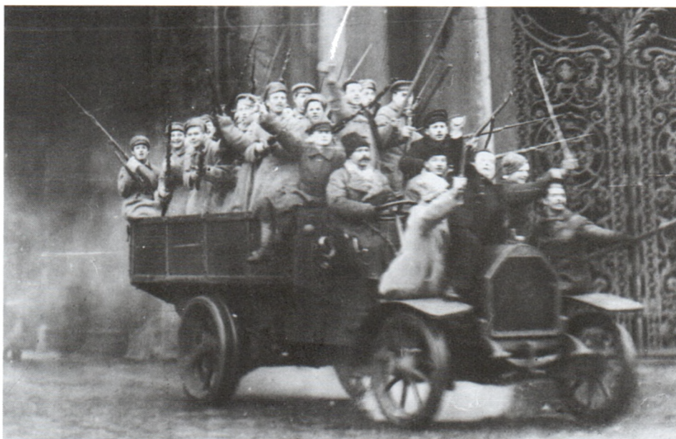
Грузовик с солдатами. 1917 г.