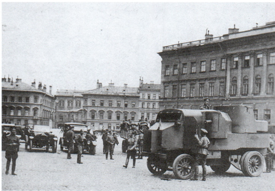
Разоружение 1-го Пулеметного полка. Июль 1917 г. И.С.Кобозев