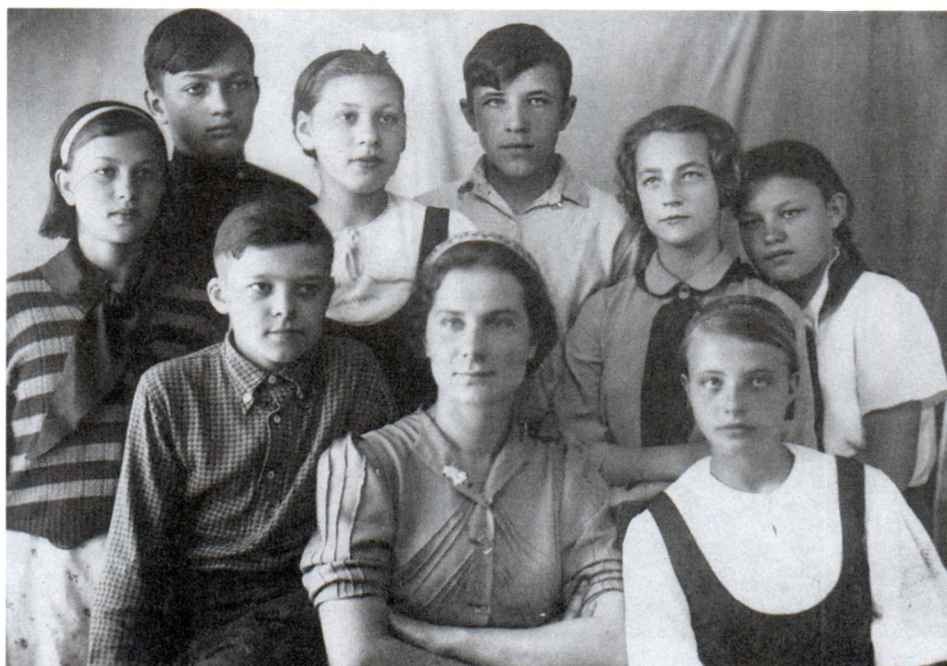
Среди одноклассников. Конец 1930-х гг.