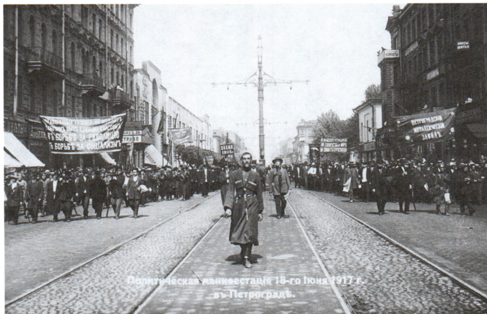
Политическая манифестация 18 июня 1917 г.