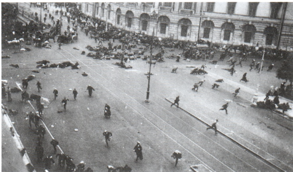
Расстрел демонстрации 4 июля 1917 г. Угол Невского и Садовой. В.К.Булла