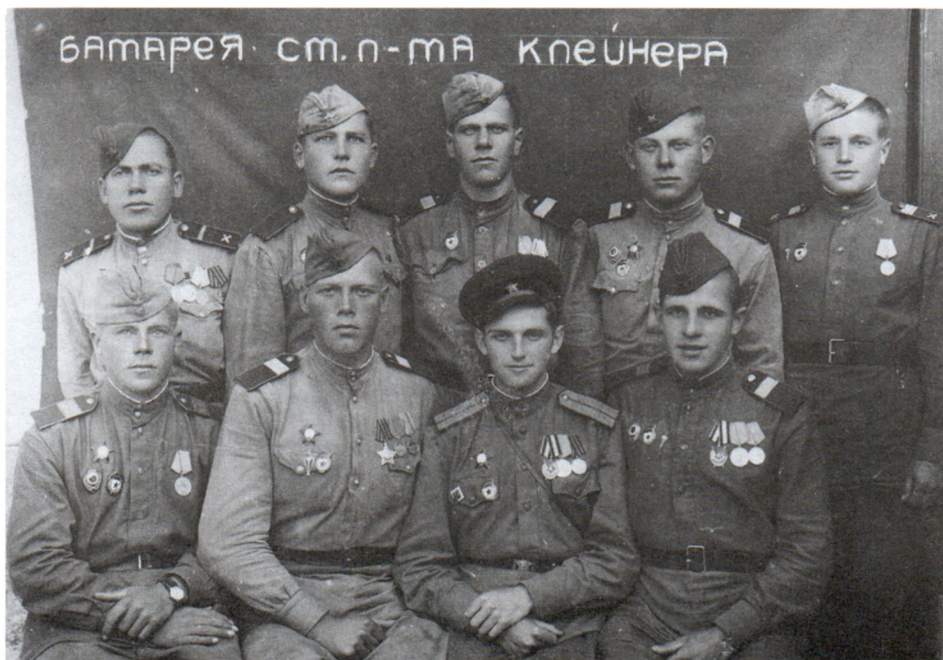
Среди однополчан. Будапешт. 15 октября 1945 г.

Наш боевой победный путь начался в Будапеште и закончился на подступах к Праге. Мы были всегда и везде первыми и прошли сквозь ливень свинца, грохот снарядов, дымы пожаров. Перед нами не устояло ничто. Нас видел Мор и река Рава, Вена и Санкт-Пельтен, Посмотри и вспомни друзей, с которыми вместе воевали, были немцы, как шагали длинными дорогами наступления, как утирали товарищи, которых здесь нет. 1. Гв. ст. л-т 6. Гв. ст. сер 2. Гв. ст. сер. 7. Гв. ст. сер 3. Гв. ст. сер. 8. Гв. мл. сер 4. Гв. ст. сер. 9. Гв. ефр. 5. Гв. сер. Будапешт 15.X.1945г.