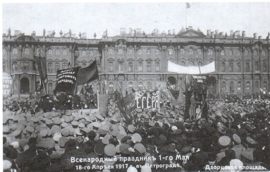
Всенародный праздник Первос мая (18 апреля ст. ст.) 1917 г.