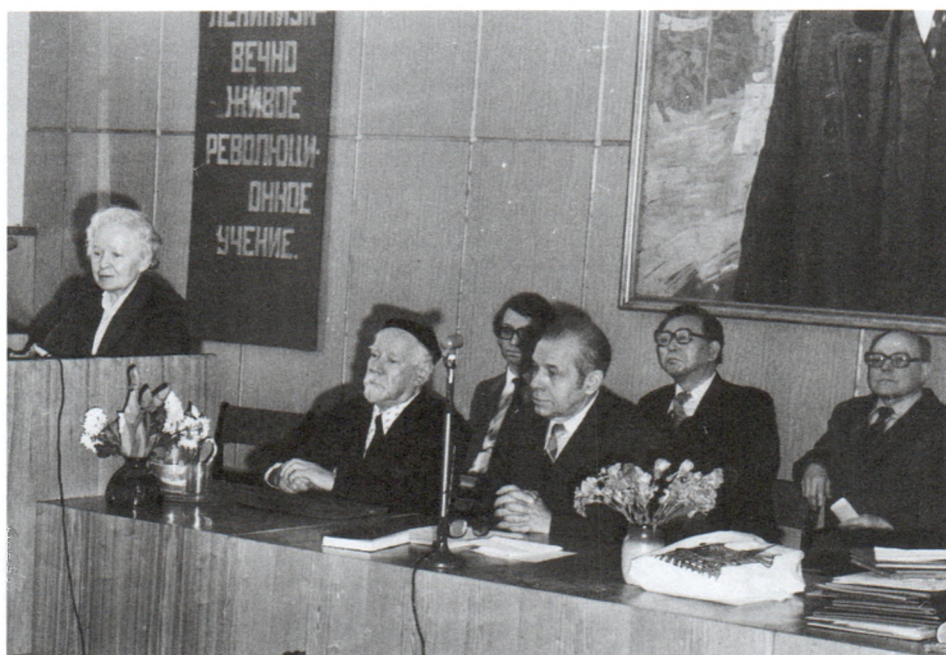
На торжественном заседании, посвященном 100-летию Н.М.Дружинина 13 января 1986 г.