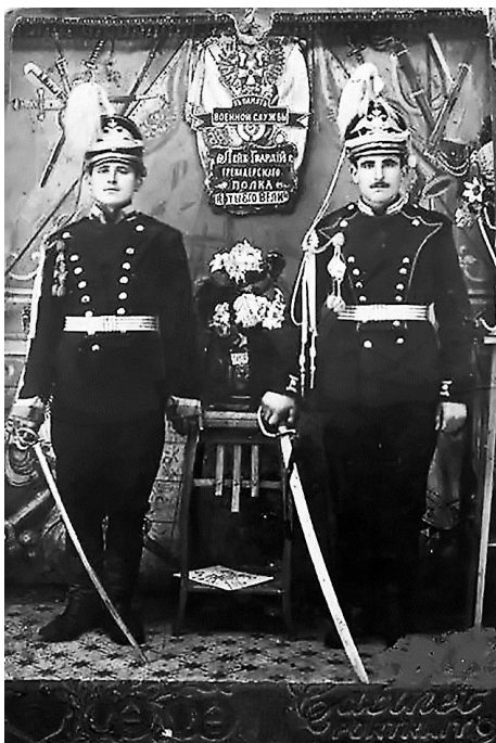
Рис. 2. Нижние чины роты его величества лейб-гвардии Гренадерского полка. Постановочный снимок в фотосалоне

В повседневные задачи полка входила охрана таких мест, как Зимний дворец, Петропавловская крепость, Городок огнестрельных припасов, здание Священного синода и других особо важных объектов. Полк часто участвовал в смотрах, разводах и парадах. С третьей декады мая и до конца лета 1898 года он находился в летнем лагере под Красным селом. Там личный состав проходил курс обучения, который включал в себя упражнения в стрельбе с различных расстояний и из разных положений, а также упражнения в определении расстояний. Солдаты стреляли из ружей, офицеры из ружей и револьверов. Проводились тактические учения различных подразделений полка и учения более высокого уровня с участием других частей лейб-гвардии.