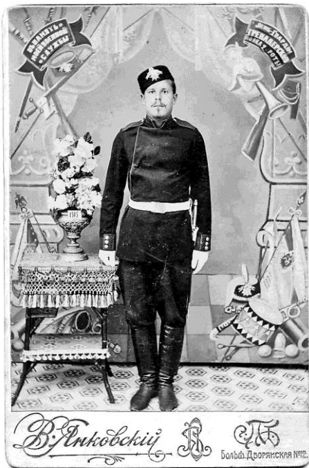
Рис 3. Военнослужащий 2-й роты лейб-гвардии Гренадерского полка. Постановочный снимок в фотосалоне

В части велась планомерная работа с нижними чинами и вне строя. Неграмотных солдат специально назначенные офицеры обучали читать и писать. Сверхсрочники, которые имели семьи, должны были отдавать детей в специальную школу.