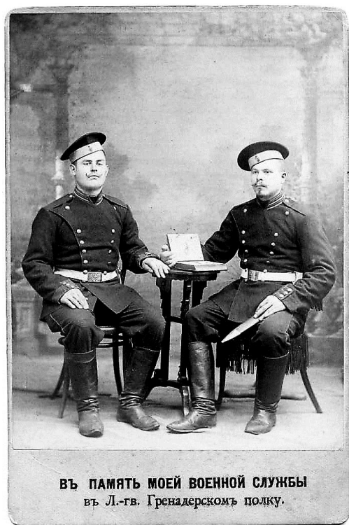
Рис. 4. Фотография на память о службе в лейб-гвардии Гренадерском полку

Лейб-гренадеры строго по расписанию отмечали полковые, государственные и религиозные праздники. Чётко соблюдались посты, как православные и католические, так и мусульманские. В дни их религиозных торжеств нижние чины других вероисповеданий, включая евреев, освобождались от занятий. Во время особо важных праздников специально организовывались игры и увеселения как для офицеров, так и для нижних чинов. Так, например, в день полкового праздника 13 апреля в 1898 году для нижних чинов предлагались следующие развлечения: