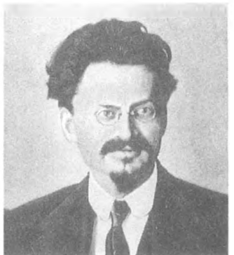
Л. Д. Троцкий