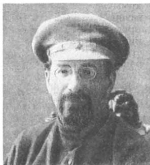
А. В. Луначарский