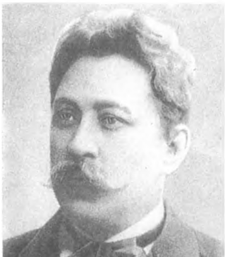
П. И. Стучка