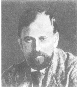
Х. Г. Раковский