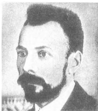
В. С. Мицкевич (В. С. Мичкявичус- Капсукас)