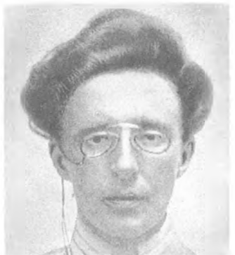
Е. Д. Стасова