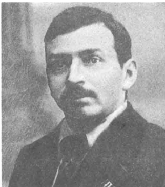
М. П. Томский