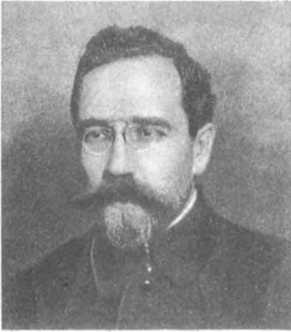
Л. Б. Каменев