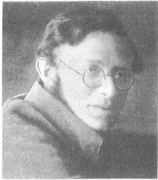
К. Б. Радек