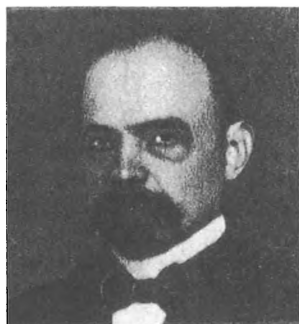
Д. И. Курский