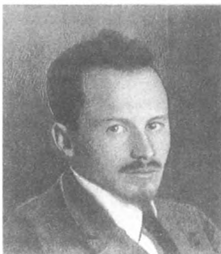
Н. И. Бухарин