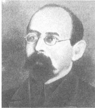
Н. Н. Крестинский