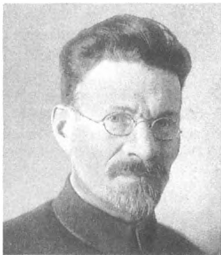
М. И. Калинин