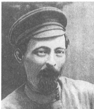
Ф. Э. Дзержинский