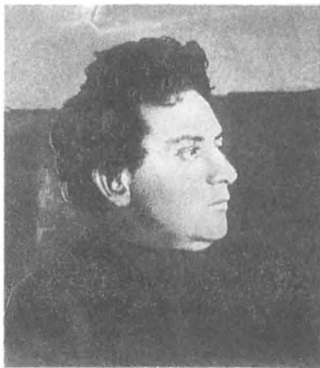
Г. Е. Зиновьев