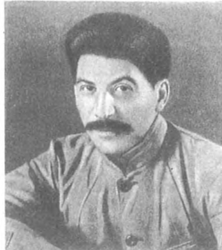
И. В. Сталин