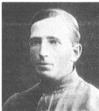
А. С. Бубнов