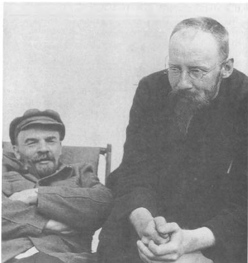
В. И. Ленин и Г. Л. Пятаков в Горках. 24 сентября 1922 г.

Первая публикация фотографии: газ. «Известия», № 18, 22 января 1926 г. Позднее фотография воспроизводилась в виде фрагмента.