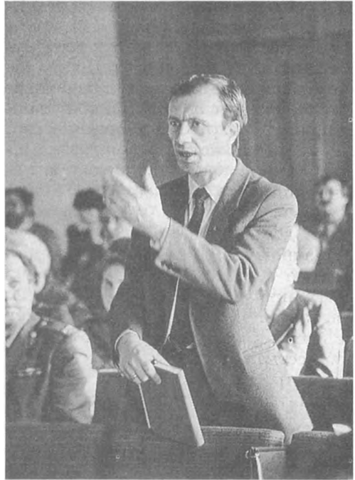
Совещание секретарей первичных партийных организаций Советского района г. Минска: идет обсуждение материалов февральского (1990 г.) Пленума ЦК КПСС. 12 февраля 1990 г.