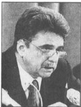
А. Оккетто в марте 1990 г. на XIX внеочередном съезде Итальянской компартии переизбран на пост Генерального секретаря ИКП.