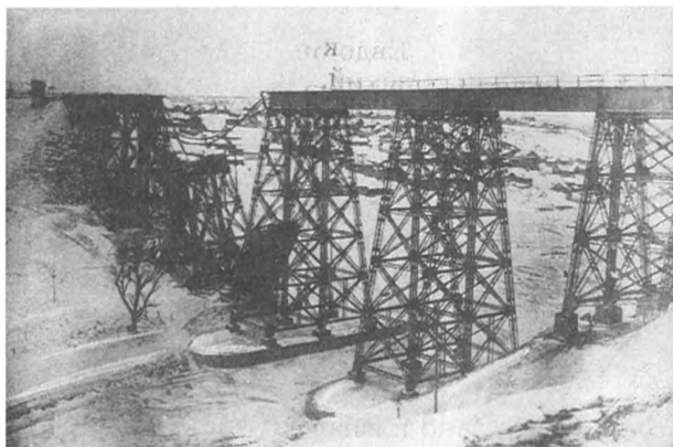
Тихорецкий мост через реку Царицу, взорванный белогвардейцами при отступлении из г. Царицына в ночь на 3 января 1920 г.