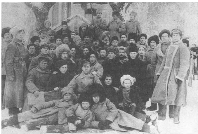
Продотряд в ст. Салтыковка Саратовской губернии. 1920 г.