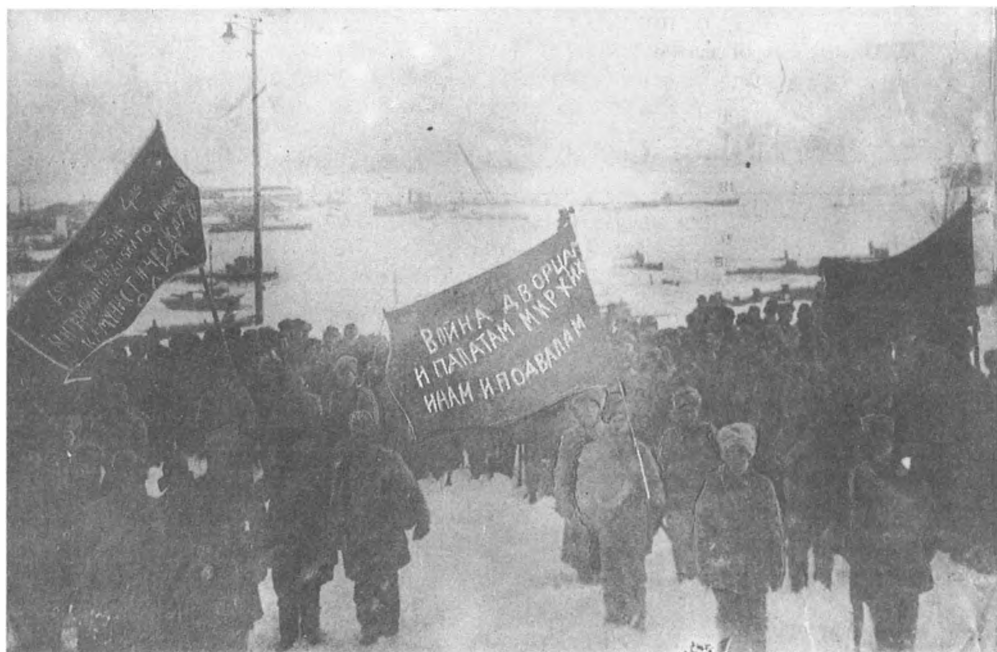
Вступление партизан в г. Николаевск-на-Амуре. 29 февраля. 1920 г.

Участники парада войск Петроградского гарнизона, посвященного 2-й годовщине Красной Армии. Петроград. 23 февраля. 1920 г.