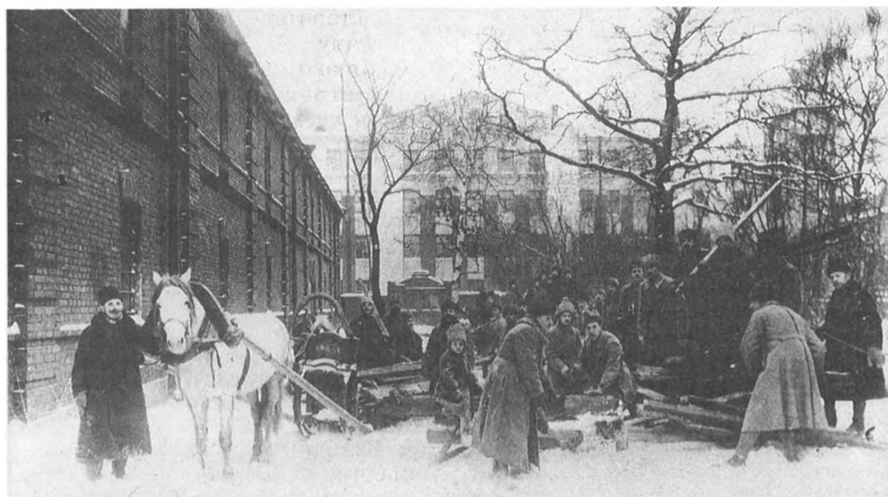
На воскресенье, посвященном неделе фронта. Петроград. 1920 г.