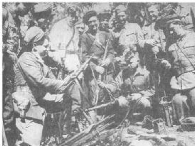
Гродненская область. Белорусские партизаны осматривают боевые трофеи.

Из фондов Белорусского государственного музея истории Великой Отечественной войны.