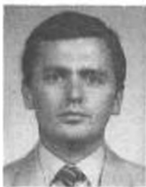
Дьюла ТОРМЕР Председатель Венгерской социалистической рабочей партии

Несмотря на это, есть все основания смотреть уверенно в будущее. Болгарское общество в целом леворазориентированное. И хотя страна не может оставаться оазисом в Восточной Европе — так называемый эффект маятника, то есть определенный сдвиг общества в целом вправо, имеет место и у нас, — перспективы развития и утверждения БСП в стране в качестве основной левой силы объективно благопри-