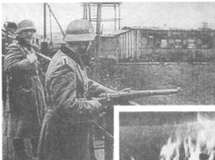
Немецкий патруль в оккупированном Минске.