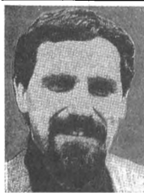
Любомир КЮЧУКОВ заместитель Председателя Президиума Высшего Совета Болгарской социалистической партии

Как и во всех других восточноевропейских странах, в Болгарии сейчас происходит процесс быстрой реорганизации всего политического пространства. Завершается переход от государства-партии к нормальной парламентской демократии.