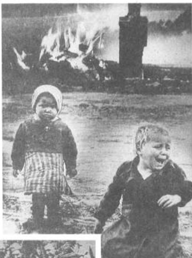
Здесь прошла война.