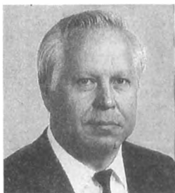
В. А. КУПЦОВ, секретарь Центрального Комитета КПСС

Не вдаваясь в детали, скажу, что в суждениях и предложениях представителей различных движений в КПСС заключено много полезных конструктивных идей, отвечающих нашему требовательному времени.