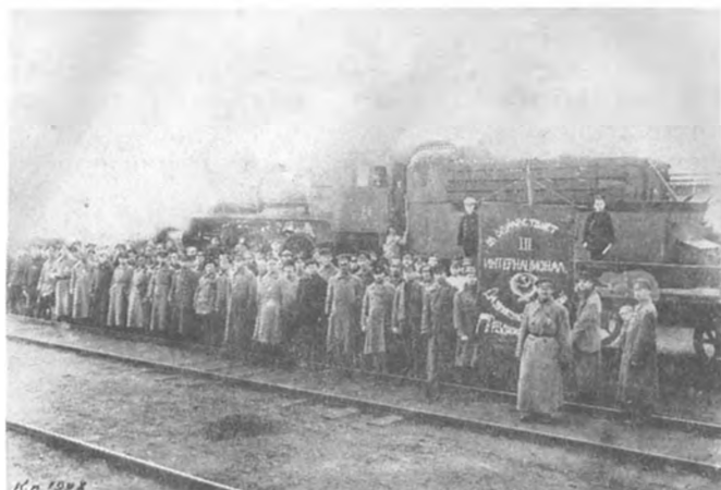
ФОТОГРАФИИ ИЗ АРХИВА

Участники ликвидации разрухи на железнодорожном транспорте перед отъездом на восстановительные работы. Петроград. 1920 г.