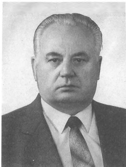
МАЛОФЕЕВ Анатолий Александрович

Член Политбюро ЦК КПСС, первый секретарь ЦК Компартии Белоруссии. Родился 14 мая 1933 года в городе Гомеле в семье служащих. Белорус. В 1949 году окончил Гомельское железнодорожное училище, в 1967 году — Белорусский государственный институт народного хозяйства им. В. В. Куйбышева, в 1974 году — Заочную высшую партийную школу при ЦК КПСС. Член КПСС с 1954 года.