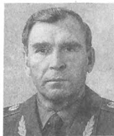
М. А. МОИСЕЕВ, член ЦК КПСС, начальник Генерального штаба генерал армии

— Михаил Алексеевич, подписан Договор по обычным вооруженным силам в Европе, который качественно меняет внешнеполитическую ситуацию во всем мире. В связи с этим наши читатели задают вопрос: исчезает ли военная угроза и какова будет военная политика советского государства?