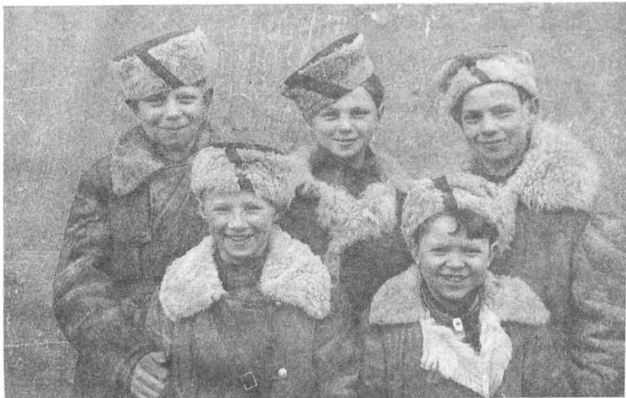
ФОТОГРАФИИ ИЗ АРХИВА

Юные партизаны-разведчики. Ленинградский фронт. 1944 г.