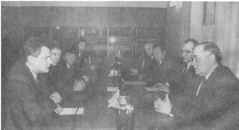
Во время встречи В. А. Ивашко с Председателем Главного Совета СДРП А. Квасъневским.