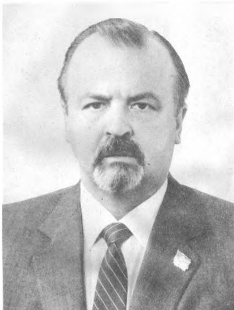
АННУС Лембит Эльмарович

Член Политбюро ЦК КПСС, первый секретарь ЦК Компартии Эстонии (КПСС). Родился 17 сентября 1941 года в городе Кохтла-Ярве Эстонской ССР в семье рабочего. Эстонец. В 1960 году окончил Таллиннский строительный техникум, в 1973 году — Заочную высшую партийную школу при ЦК КПСС, в 1979 году — Академию общественных наук при ЦК КПСС, кандидат исторических наук. Член КПСС с 1963 года.