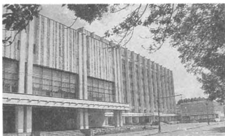
На снимках: Общественно-политический центр МК и МГК партии; во время дискуссии.