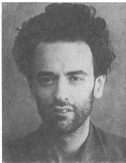
Л. Д. Ландау. Снимок сделан во внутренней тюрьме НКВД. Москва, 1938 г.

По просьбе «Известий ЦК КПСС» из архива Комитета государственной безопасности СССР были извлечены материалы уголовного дела по обвинению Л. Д. Ландау в антисоветской вредительской деятельности. Будущий академик был арестован 27 апреля 1938 г. и освобожден 28 апреля 1939 г. Однако «за отсутствием состава преступления» данное дело было прекращено лишь 23 июля 1990 г.