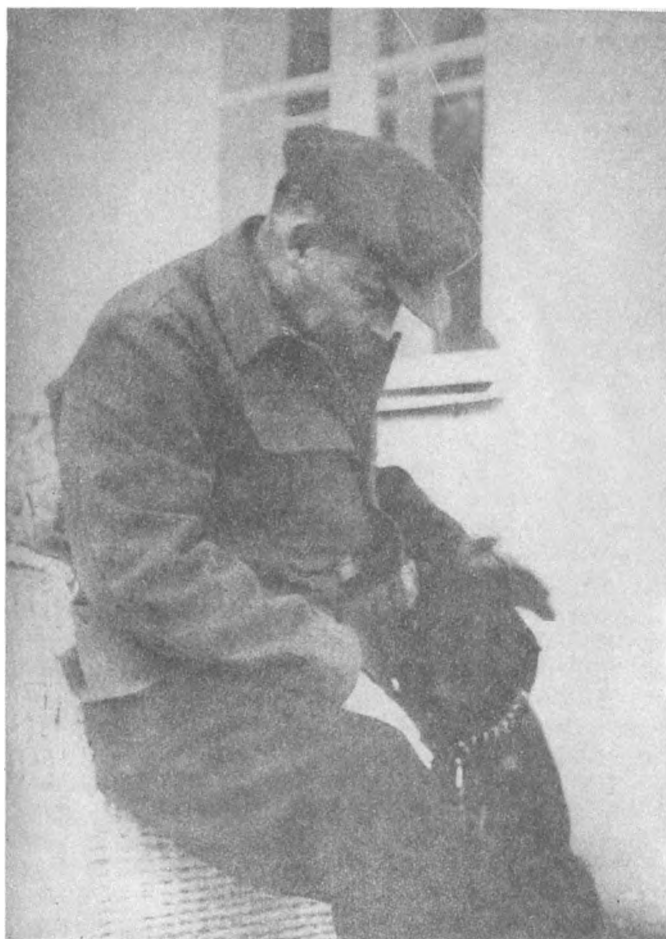
В. И. Ленин с собакой Айда. Начало августа — сентябрь 1922 г.