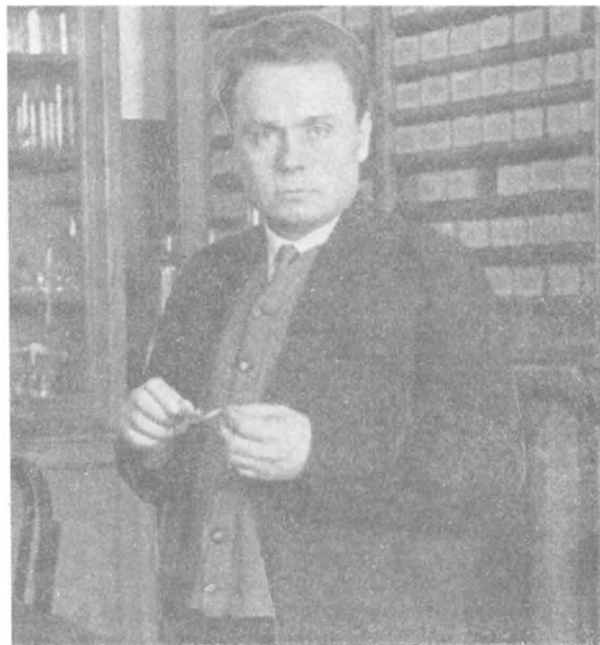
Академик АН БССР А. Р. Жебрак. 40-е годы.