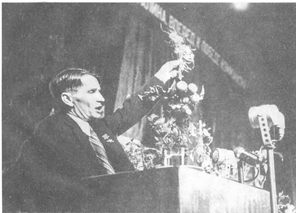
Т. Д. Лысенко выступает на сессии АН СССР. Сентябрь 1948 г.