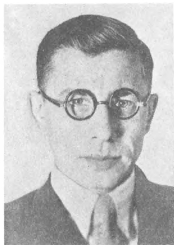
Суворов С. Г. В 1945—1947 гг. заместитель начальника Управления пропаганды и агитации ЦК ВКП(б). 1946 г.