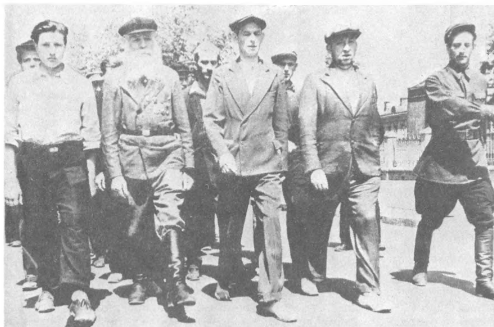
Стрелковые занятия в подразделении народного ополчения. Москва. Август 1941 г.