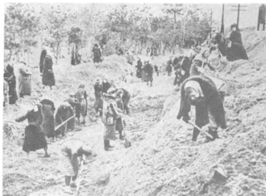
Строительство оборонительных сооружений на подступах к столице. Октябрь 1941 г.