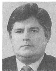
Г. Ю. СТРИЖАК , член ЦК КПСС, директор Закарпатского лесотехнического техникума.

всю деятельность партии — от первички до райкома, обкома и ЦК — заботой о человеке.