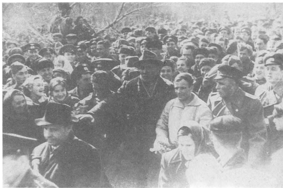
12 апреля 1961 г. Первые встречи на Земле в районе г. Энгельса Саратовской области. На снимке внизу рядом с Ю. А. Гагариным (справа) заместитель главкома ВВС генерал-полковник авиации Ф. А. Агальцов.