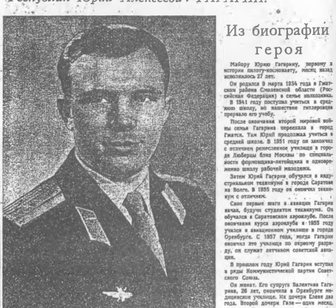
Юрий Алексеевич Гагарин.

Первый человек, проникший в космос, — гражданин Союза Советских Социалистических Республик Юрий Алексеевич ГАГАРИН.