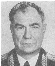
Д. Т. ЯЗОВ, член ЦК КПСС, министр обороны СССР, Маршал Советского Союза

Военная реформа — составная часть перестройки, обновления советского общества. Она охватывает всю систему отношений в сфере обороны и безопасности страны. Содержание ее основных параметров определяется конкретными условиями и тенденциями развития международной военно-политической обстановки, реальными социально-экономическими, научно-техническими и духовными возможностями страны, а также задачами приведения ассигнований на оборону, военного производства, состава, оснащения, всей инфраструктуры Вооруженных