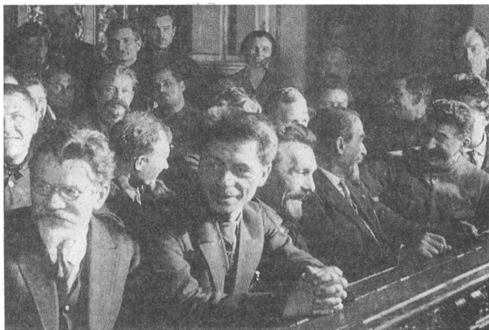
Кадры из документального фильма «XII съезд РКП(б)». Вверху (слева направо) — М. П. Томский, Л. Б. Каменев, Ф. Э. Дзержинский, М. М. Лашевич проходят в зал заседаний съезда. Внизу (слева направо) — М. И. Калинин, П. П. Постышев, А. И. Рыков, Н. А. Скрипник, И. В. Сталин в зале заседаний съезда.