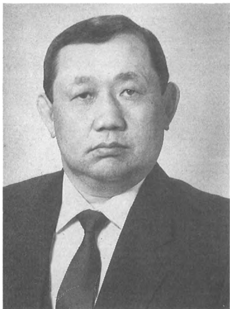
АМАНБАЕВ Джумгалбек Бексултанович

Член Политбюро ЦК КПСС, первый секретарь ЦК Компартии Кыргызстана. Родился 2 февраля 1945 года в селе Чаек Джумгалского района Нарынской области в семье служащего. Кыргыз. В 1966 году окончил Киргизский сельскохозяйственный институт им. К. И. Скрябина, в 1985 году — Академию общественных наук при ЦК КПСС, кандидат биологических наук. Член КПСС с 1972 года.