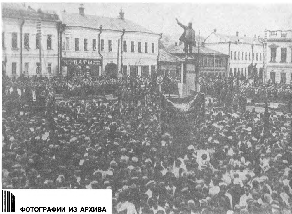
ФОТОГРАФИИ ИЗ АРХИВА

Открытие памятника В. И. Ленину, сооруженного на собранные трудящимися средства. г. Тула. 1924 г.