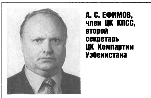
А. С. ЕФИМОВ, член ЦК КПСС, второй секретарь ЦК Компартии Узбекистана

— Я не стал бы отделять кризисные явления в республиканских компартиях от общего кризиса КПСС. Ведь здесь все взаимосвязано. Это во-первых.