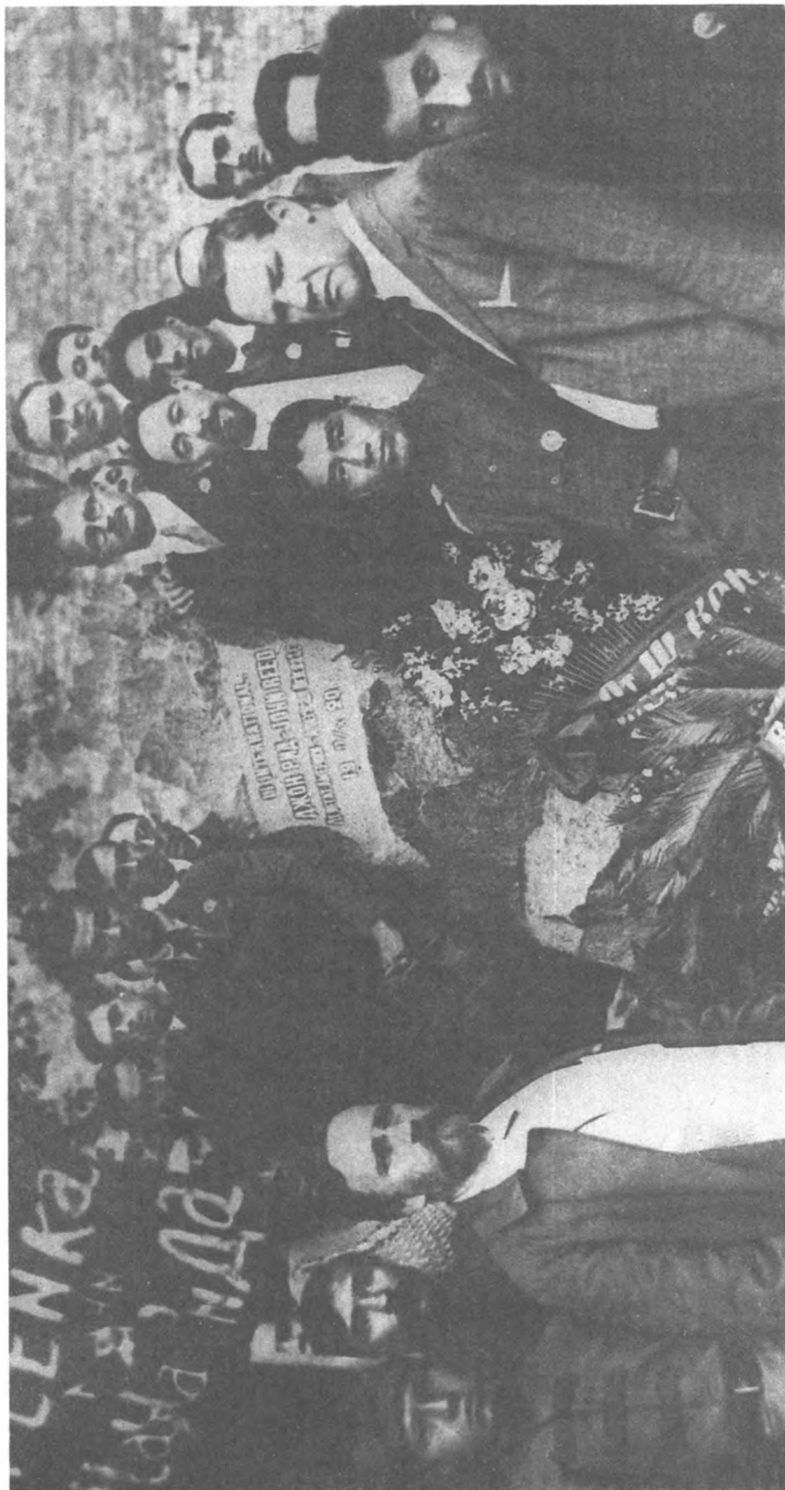
На похоронах Джона Рида. Красная площадь. 1920 г. Слева Л. Б. Каменев.