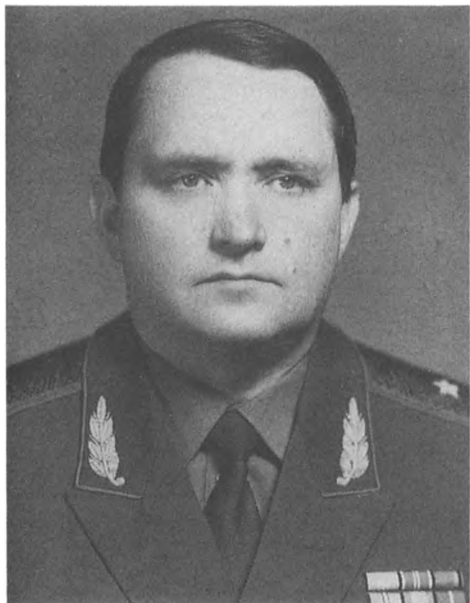
СУРКОВ Михаил Семенович

Член Политбюро ЦК КПСС, секретарь Всеармейского партийного комитета. Родился 2 декабря 1945 года в городе Челябинске в семье рабочего. Русский. В 1977 году окончил Военно-политическую академию им. В. И. Ленина. Генерал-лейтенант. Член КПСС с 1968 года.