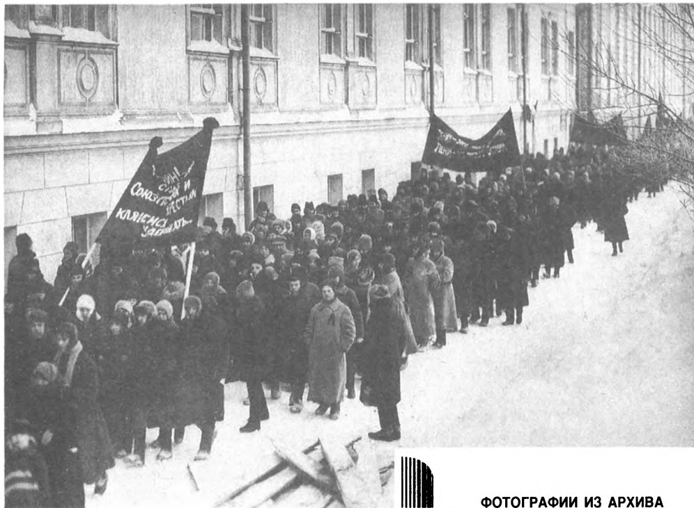
ФОТОГРАФИИ ИЗ АРХИВА